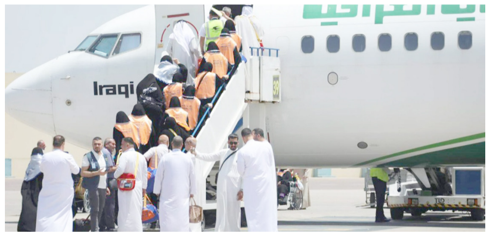
حجاج عراقيون أثناء توجيههم إلى مكة المكرمة