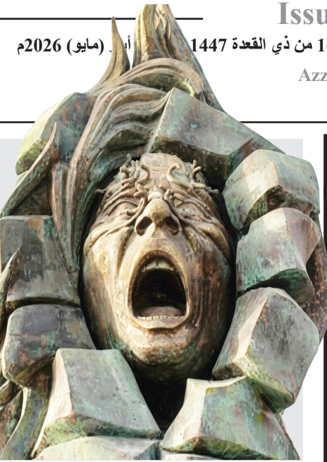
إبداع: أعمال ابداعية للطبيب التشكيلي علاء بشير