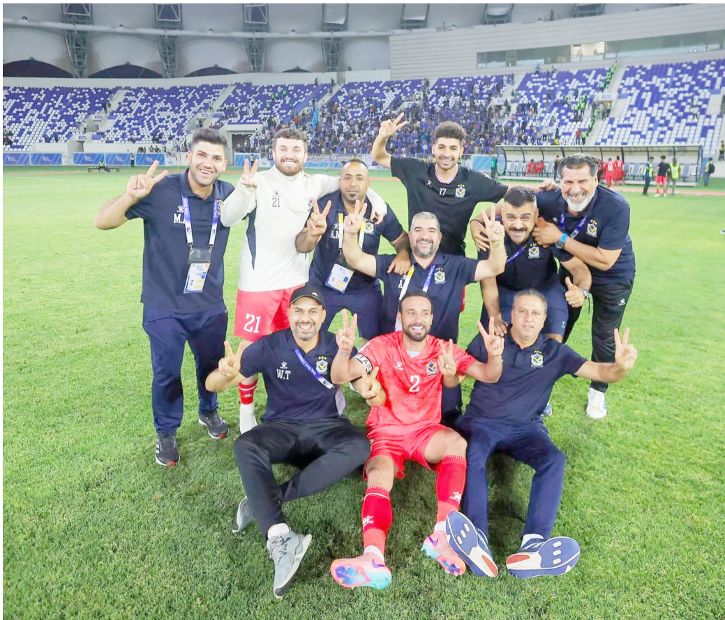
فرحة: فريق القوة الجوية يعبر عن فرحته بعد تحقيق الفوز في دوري المحترفين