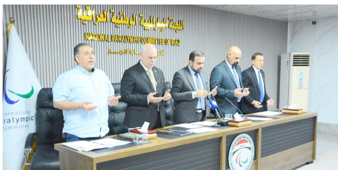
لجنة : اجتماع الهيئة العامة للجنة الباراولمبية

بغداد - الزمان تصدر خبر استقالة رئيس اللجنة الباراولمبية الوطنية العراقية جدول أعمال الاجتماع الإعتيادي للهيئة العامة الذي عقد في مقر اللجنة بالعاصمة بغداد بحضور أعضاء المكتب التنفيذي والهيئة العامة ورؤساء الاتحادات الرياضية ورؤساء الهياكل. وبلغ عدد أعضاء الهيئة العامة 31 عضواً حضر منهم 28 عضواً. فيما جرى التصويت بالإجماع على جميع فقرات جدول الأعمال واستهل الاجتماع بقراءة سورة الفاتحة تحمداً على شهادته العراق قبل الشروع بمناقشة الملفات المدرجة.