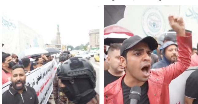
تظاهرة: متعاقدون خلال تظاهرة

مؤكدين انهم (شريحة مظلومة عانت لسنوات طويلة. لحرمانهم من الدرجات الوظيفية اسوة بالشرائح الأخرى). يذكر أن (أصحاب العقود طالبوا في تظاهرات سلمية بإنصافهم واعادتهم إلى وظائفهم، ضمن تخصيصات محافظة بغداد، استناداً إلى المخاطبة الرسمية التي وردت من مكتب رئاسة الوزراء، بالانقادات إلى هذه الشريحة والمباشرة بتعيينهم من قبل المحافظة).