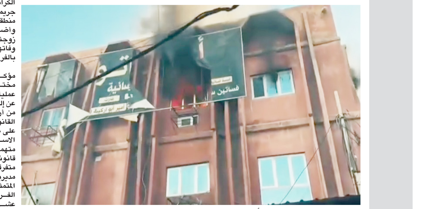
حريق: رجال الدفاع المدني يخمدون حريقاً في السماوة

المحافظات - مراسلو الزّمان) القت قوة أمنية، القبض على عدد من المتهمين على صلة بحادث قتل مواطنين أثناء حفل تابيني في محافظة كربلاء. وقال بيان لوزارة الداخلية أمس إن (مقارن وكالة الاستخبارات والتحقيقات الاتحادية، المتمثلة بخلية الضفر الاستخبارية في كربلاء وبالتنسيق مع خلية الضفر الاستخبارية ببغداد الرصافة، نفذت عمليتين أمنيتين منفصلتين، أسفرتا عن إلقاء القبض على أربعة متهمين، لتورطهم في حادث قتل مواطنين اثنين داخل مجلس حفل تابيني وإصابة عدد