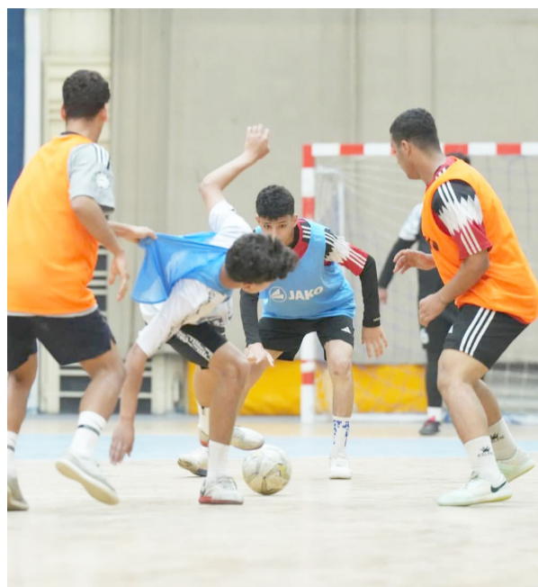
كرة: اختبار اللاعبين كرة الصالات للشباب