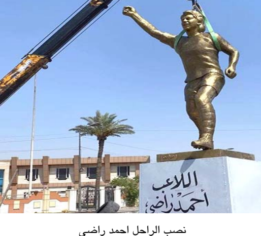
نصب الراحل احمد راضي

بغداد- الزمان استنكرت أمانة بغداد ما وصفته بالتجاوز للاحصاري والامتهان لمكانة أسطورة الكرة العراقية الراحل احمد راضي وذلك من خلال اقامة نصب نحتي لتطبيق عليه اسبسط المعايير الفنية مع قاعدة بانسة للنصب في منطقة البروك شارع الرابع شوارع ضمن قاطع بلدية المنصور ودون اخذ الموافقات الاصولية من امانة بغداد ووزارة الثقافة. وذكر البيان ان امانة بغداد قررت ازالة النصب المذكور كونه لايرتقي بمكانة الالعب الدولي الراحل احمد راضي. واضاف البيان ان امانة بغداد وبالتعاون مع وزارة الشباب ووزارة الثقافة واتحاد الكرة العراقي ستقيم نصبا جديدا بمواصفات فنية مناسبة. وتابع ان الاعمال الفنية والجمالية في مدينة بغداد لايمكن تنفيذها بصورة شعبية لاتتناسب والدوق العام الذي نطمح اليه ومن دون اخذ موافقات اصولية ويجب إخضاعها للجهات المختصة في امانة بغداد ووزارة الثقافة.