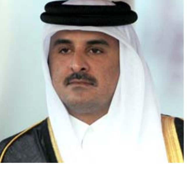
امير دولة قطر

إلى نادي العاصمة الفرنسية. وقال أمير قطر ليمحو كل الملاحظات والهوامش التي تركتها عقلية المدرب كاتانيتش وقولته الدفاعية التي التزم بها المنتخب عبر أكثر من محطة.