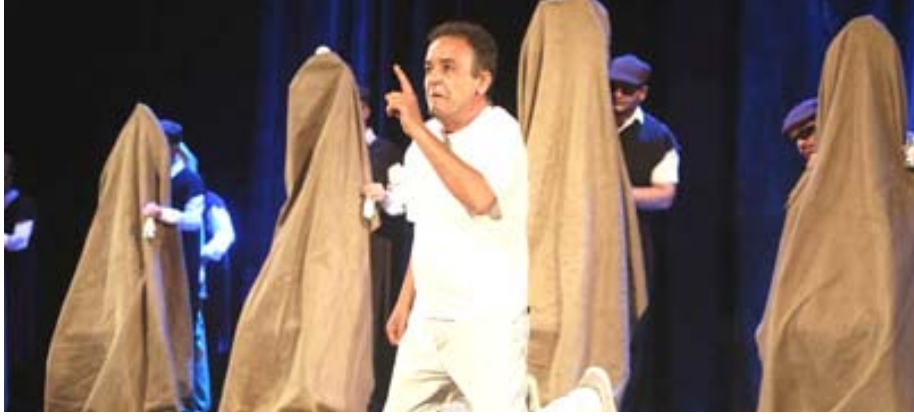
إبداع؛ ممثلون من ذوي الإحتياجات الخاصة يبدعون في مسرحية (أوفر بروفة)