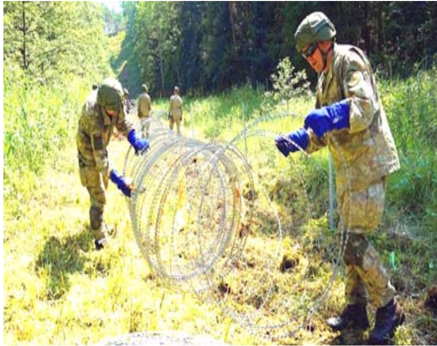
حلوله: قوات بيلاروسيا تضع الاسلاك الشائكة على حدودها

جداً لما له من جنبة فنية تعود بالنفع الكبير على الشبكة الوطنية وتحقق الاستقرار، وهو أيضاً بوابة لدخول السوق الخليجي. وشدد وزير الكهرباء وكالة على تشجيع الاستثمار العربي والاجنبي في مجال الطاقة لافتاً إلى انه ليس لدى العراق اي افق مغلق تجاه اي شركة من الشركات، وأن الشركات السعودية ستضيف زخماً جديداً لاستقطاب الاخوة العرب للعمل في العراق. وأوضح كريم، لتأثير الاستثمار والتعاون الاقليمي على واقع المنظومة الوطنية، كما شرح للوفد السعودي الخطة التي تروم الوزارة تنفيذها.