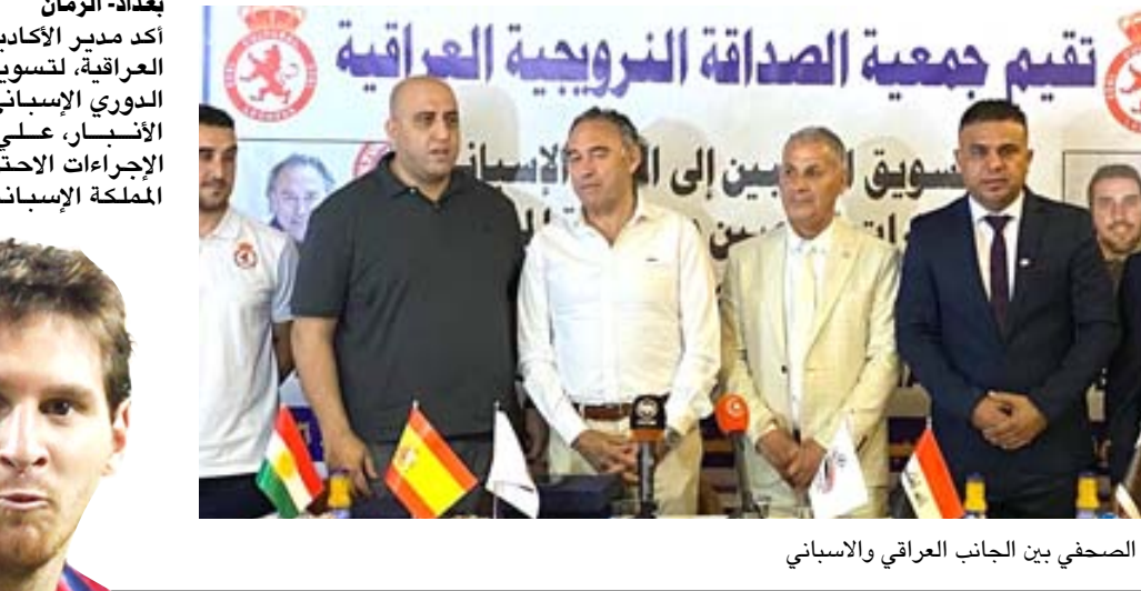
جانب من المؤتمر الصحفي بين الجانب العراقي والاسباني