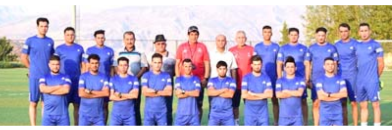
الحكام المشاركين في المعسكر التدريبي بأربيل