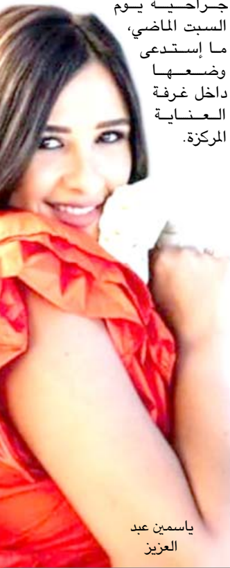
ياسمين عبد العزيز

كشف الممثل المصري أحمد العوضي، زوج الممثلة المصرية ياسمين عبد العزيز خروجها من المستشفى، الجمعة، ويحدث لصحيفة مصرية، أعلن أحمد (خروج ياسمين بعد تحسن حالتها الصحية نسبيًا عقب خضوعها لجراحة دقيقة قبل أسابيع) وأكد العوضي ان (ياسمين ستستكمل علاجها في المنزل تحت إشراف طبي)، منمننيا (استرداد ياسمين لكامل عافيتها خلال الفترة المقبلة). وتأتي أزمة عبد العزيز نتيجة مشاكل صحية جاءت بعد محاولات العمل، فدخلت في غيبوبة، بعد خضوعها لعملية جراحية يوم السبت الماضي، ما استدعى وضعها داخل غرفة العناية المركزة.