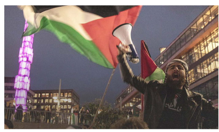
كيميل يقدّم حفل جوائز الأوسكار الأغنية السويدية تحيا فلسطين تكتسح منصات التواصل