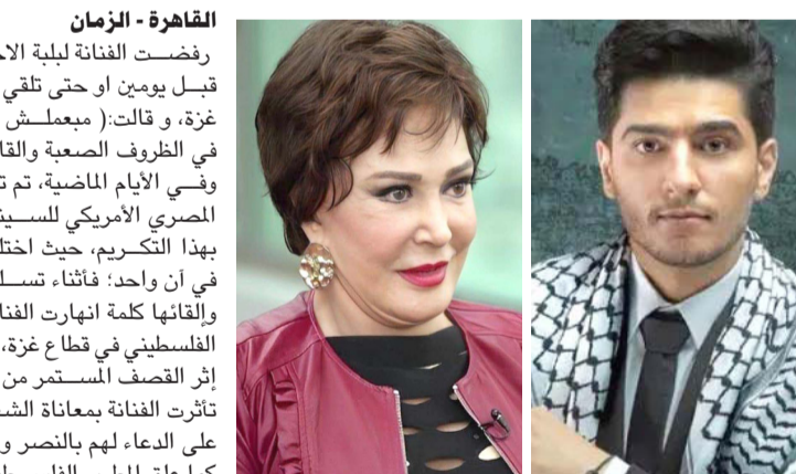
محمد عساف لبلة

القاهرة - الزمان رفضت الفنانة لبلة الإحتفال بعيد ميلادها الذي صادف قبل يومين او حتى تلقي التهاني، وذلك تضاّمًا مع أهالي غزة، و قالت ( مبعملش عيد ميلادي وميحتفلش بأي حاجة في الظروف الصعبة والقاسية اللي بيمر بها أهالي غزة). وفي الأيام الماضية، تم تكريم الفنانة لبلة، في المهرجان المصري الأمريكي للسنيما والفنون، لكن الفنانة لم تسعد بهذا التكريم، حيث اختلط شعور الفرحة والحزن لديها في أن واحد؛ فأنشأت تسلمها الجائزة على خشبة المسرح، وإلقاها كلمة انهارت الفنانة من البكاء، بسبب معاناة الشعب الفلسطيني في قطاع غزة، وأسستها الآلاف من الفلسطينيين إثر القصف المستمر من قوات الاحتلال الإسرائيلي، حيث تأثرت الفنانة بمعاناة الشعب الفلسطيني الشقيق، وحرصت على الدعاء لهم بالنصر والثبات في محتدهم. كما علق الطرب الفلسطيني محمد عساف، عبر حسابه بتطبيق (إكس)، على الجرائم والمجازر الوحشية التي