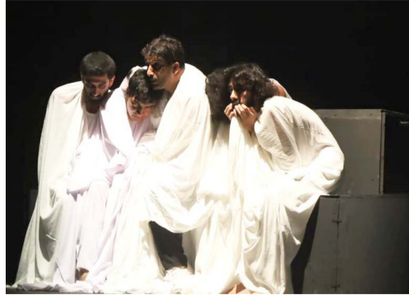
مسرحتان؛ مسرح الرشيد يضيف مسرحيتي (أم المراءة) و(C4كلوذا)