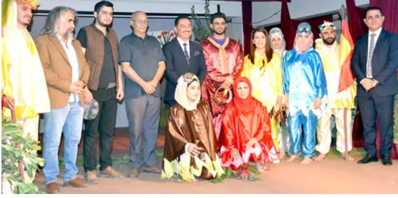
فريق مسرحية (لطيور أجنحة من ذهب)