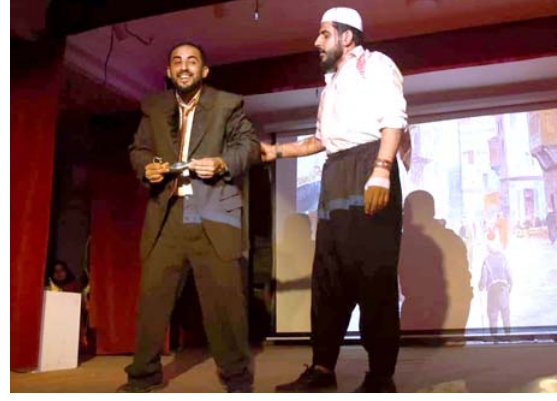
مشهد من مسرحية المراد

المشتركة هي الوصول الى هدفي وتقديم اعمال ثري في جميع (تربية فنية