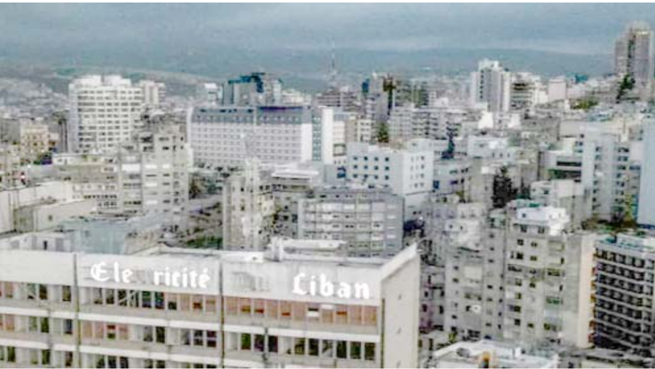
ظلام: لحظة جوية لمؤسسة كهرباء لبنان في بيروت وسط الظلام بسبب انقطاع التيار