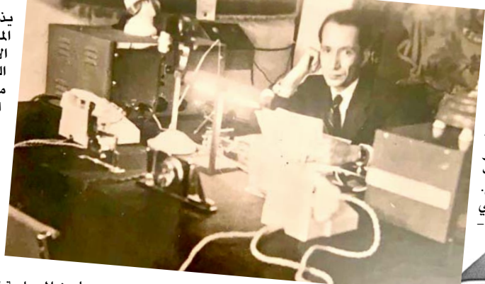
قصر الزهور الملكي

صارت تصل إلى بعض الدول المجاورة وخاصة في بداية عام 1939، حيث أصبح للإذاعة خمس محطات. فتح منصف العام 1938 حول الملك غازي (إذاعة قصر الزهور) بمزمنة القضاية العربية. فاخذت ذبوع أخيرا وفصائد حماسية ، وسدءات شبيعة بروح وطنية وقومية. خاصة فيما يتعلق بسوريا وفلسطين. وكان الملك يشرف بنفسه على الإذاعة ويذيع بعض الأحيان بصوته دون ذكر اسمه. وأصدرت (إذاعة قصر الزهور) مجلة غرفت بأرجحة راديو قصر الزهور. وكانت عبارة عن مجلة ثقافية شهرية ، صدر العدد الأول منها