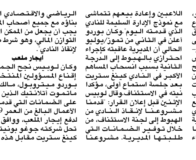
بورديو وأنجيه يكسبان الإستئناف وينجوان من الهبوط إلى الدرجة الأولى

□ بورديو (فرنسا)، (أ ف ب) - ضمن ناديا بورديو وأنجيه بقاعهما في دوري الدرجة الأولى بعدما منحتهما لجنة الاستئناف التابعة للمديرية الوطنية للرقابة والإدارة الضوء الأخضر بذلك عقب طعنهما في عقوبة الهبوط إلى الدرجة الثانية بسبب مخالفات مالية. وأعلن الناديان في بيانين منفصلين إنهما سيلعبان في دوري الدرجة الأولى الموسم المقبل بعد كسبهما استئناف عقوبة الهبوط التي فرضتها هيئة الرقابة المالية مطلع الشهر الحالي. وقال بورديو تم إنقاذ اللاعبين وإعادة بيعهم لتماشي مع نموذج الإدارة السليمة للنادي الذي قدمته اليوم. وكان بورديو أعلن في الثاني من تموز/يوليو الحالي أن المديرية عاقبته كإجراء احترازي بالهبوط إلى الدرجة الثانية بسبب انسحاب المساهم الأكبر في النادي كينغ ستريت بعد جلسة استماع أولى، مؤكداً بنه في الاستئناف وقال لويس الإثنين قبل إعلان القرار: "قدمننا مشورعتنا لإنقاذ النادي من الهبوط إلى لجنة الاستئناف، من خلال توفير الضمانات التي طلبتها المديرية. مشورعتنا الرياضي والاقتصادي الذي تم بناؤه مع جميع أصحاب المصلحة، يجب أن يجعل من الممكن استعادة التوازن المالي، وهو شرط ضروري لإنقاذ النادي. إيجار ملعب وكان لويس نجح الجمعة في إقناع المسؤولين المنتخبين في بورديو بمتروبول، مالك ملعب ماتموت أتلانتيك الذين وافقوا على الضمانات التي قدمها رجل الأعمال البالغ من العمر 49 عاماً لدفع إيجار الملعب، ووافق على أن تحل شركته جوغو بونيتو محل كينغ ستريت مقابل هذه الدفعة