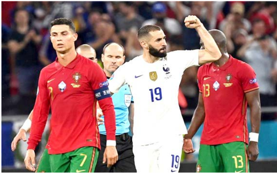
يورو: إحدى اللحظات المثيرة في بطولة يورو 2020

ورنادو لم تكن أيضاً في الموعد، وتركت حملة الدفاع عن لقبها سريعاً من دور ال16 على يد بلجيكا، ولم ينجح المغرب المخضرم فرناندو سانتوس في استكمال مسيرة النجاح ولم يختلف الأمر لمانيا التي أسلحت الستار على حقبة المدرب يواكيم لوف بإخفاق جديد، حيث ظهرت بصورة مبعدة تماماً عما كانت عليه قبل سنوات عندما جلست على عرش العالم بلقب المونديال في البرازيل، وودعت هي الأخرى البطولة في دور ال16 أمام ألمانيا. تغفر هولندا