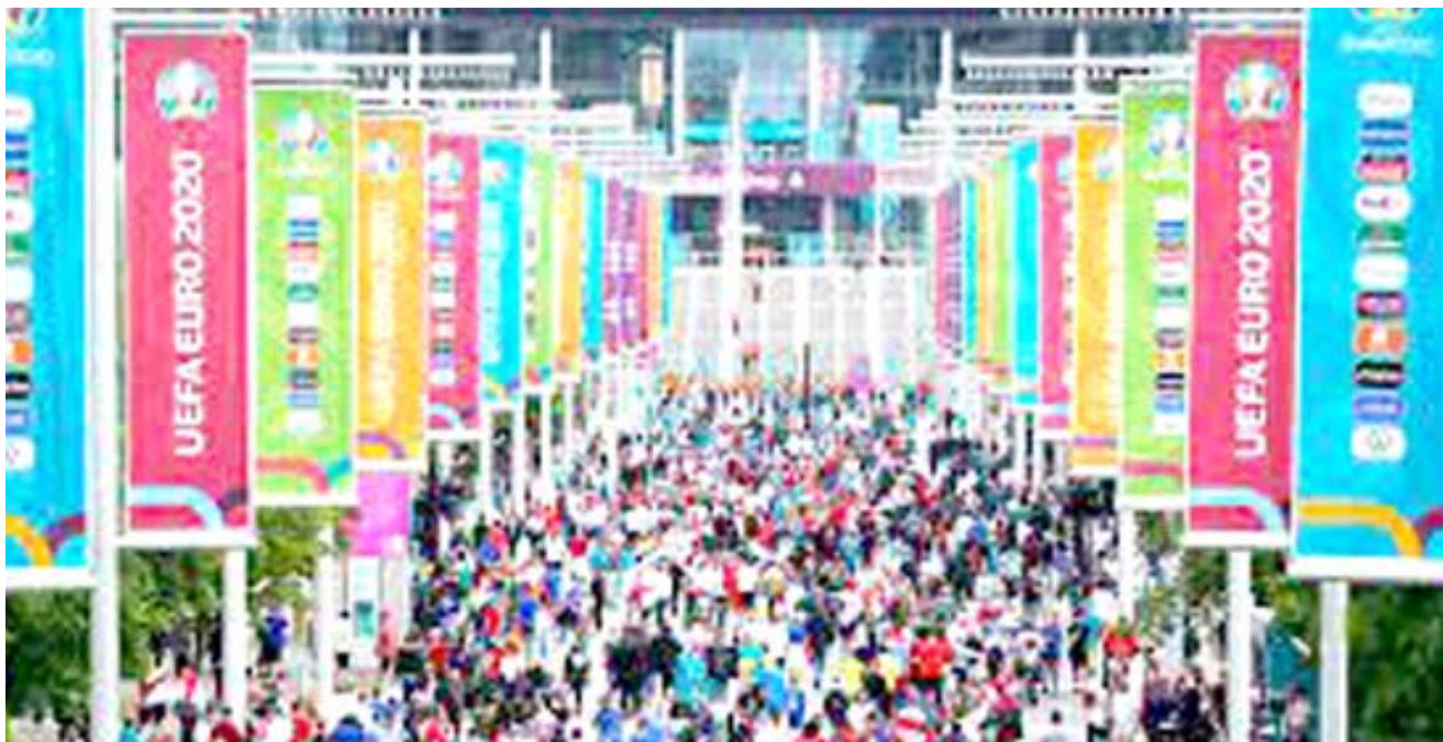
ملعب : مشجعو منتخب انكلترا لكرة القدم يتوافدون إلى ملعب ويمبلي في لندن