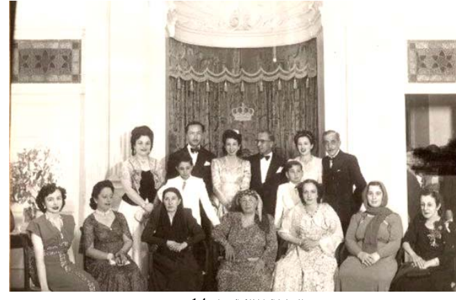
العائلة المالكة قبل 14 تموز

وفوقه الحاج الملكي العراقي. ويحيط بالعرش إمار زخرفي من الخارج. وإزدان سقف القاعة بزخرفة من المحار بعد 21 ضلعًا. أما الطابق العلوي فقد ضم لثمان أجنحة ، كل جناح يضم غرفة جلوس وحمام ، و من غرفة نوم كبيرة فاخرة وباتاتها وديكوراتها وتقوسها. وتزين شبابيك القصر التي غطيت بشبابيك خشبية فتحت إلى الخارج، ولطيفها منع دخول الشمس مباشرة وتسمح بدخول الهواء لأنها مصنوعة من أشرطة خشبية افقية. أما الشبابيك الزجاجية فتقع خلف الشبابيك الخشبية. وتم طلاء الشبابيك باللون الأخضر بحيث تتميز عن الجدران الملطخة باللون البيجي الخفيف off-white.