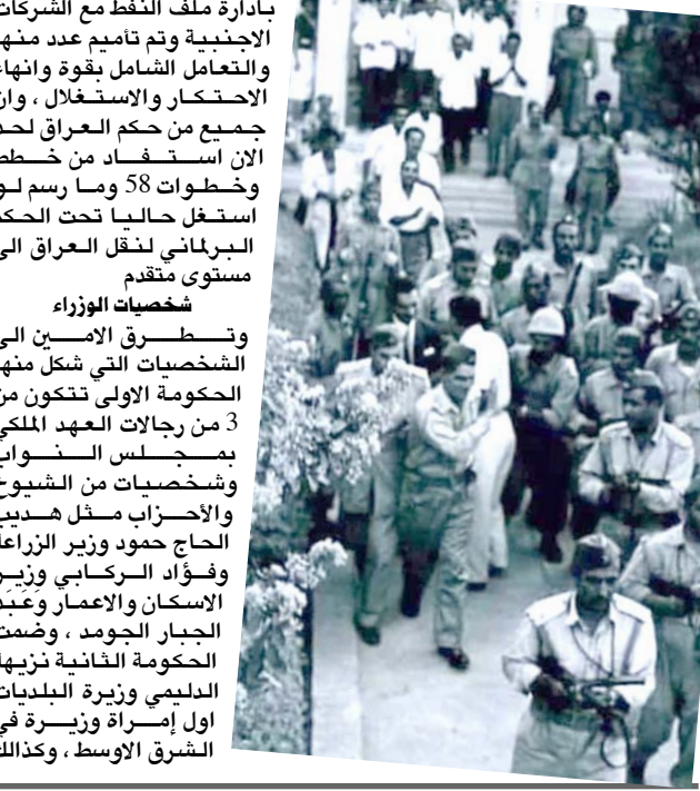
الشرق الاوسط، وكذلك

ثناء الحرب العالمية الاولى ( 1914 - 1918) عقدت اتفاقية سرية للغاية بين وزير خارجية بريطانيا سايكس بيكو وتخيره الفرنسي فرانسوا جورج بيكو بمشاركة روسيا القيصرية اذذاك عرفت بمعاهدة سايكس بيكو واصبحت ساري المفعول بتاريخ 5/16/1916 وكشفت روسيا غطاء السرية عنها بعد قيام ثورة أكتوبرعام 1917والتي تضمنت توزيع مناطق نفوذ الدولة العثمانية فيما بين دول الحلفاء كخنازير حرب ومن ام بنودها حصة روسيا ، وإليات أرض ورتارزون و وان وتبليس التي تعرف بآرمينيا التركية تغلتوذلك منطقة من القسم الشمالي لكوردستان على خط يمر عبر موث و زعفر وجزيرة ابن عمر واميدي الى الحدود الإيرانية وتبلغ مساحتها