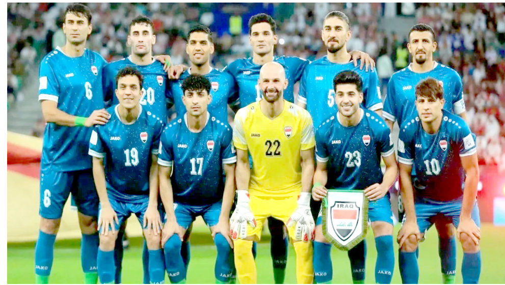
كرة: المنتخب الوطني لكرة القدم

بيني وبين أن مواجهة منتخب الكونغو الودية الرسمية بعد التأهل إلى كأس العالم لا سيما أننا بحاجة إلى منتخب أفريقي لأن مجموعتنا التاسعة تضم منتخب السنغال إلى جانب فرنسا والنرويج. فرصة مناسبة