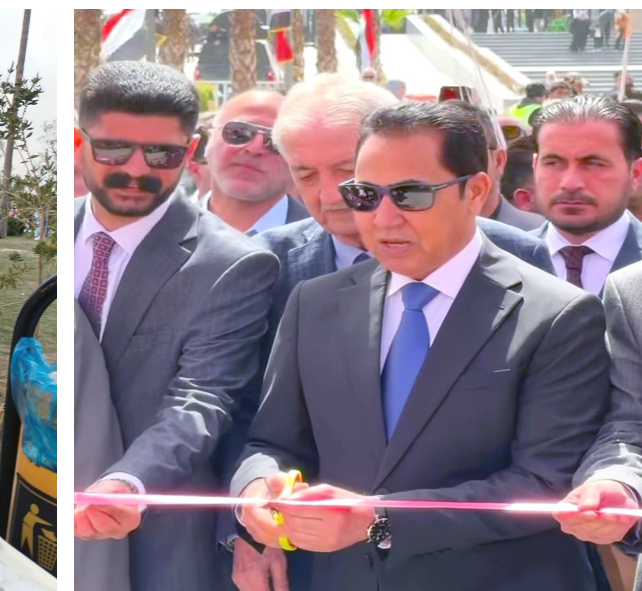
افتتاح: محافظ نينوى يفتتح معرض الزهور السنوي بحضور عدداً من برلماني نينوى واعضاء مجلس المحافظة

دايت بلدية الموصل منذ عقود ومع إبادة فصل الربيع واعتدال المناخ دأبت على تنظيم معرض الزهور السنوي كواحدة من أبرز الفعاليات البيئية والجمالية التي تميزت بها الموصل. ولأهمية تعزيز المساحات الخضراء وإنسجاماً مع موسم الإنبات الطبيعي وتمتع المدينة باجواء ربيعية حيث صفاء المناخ ومناظر الخضرة تزدهن الموصل بجمال الورد وتنفس عبقها الأخاذ ومنظر زرق السماء المرصعة بالغيوم البيضاء والوان الزهور التي تريح النظر وتبهج القلوب المنتشرة على أرضها الخصبة المعطاءة.