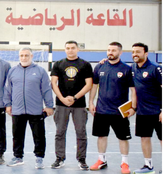
إختبارات: الشرفون على إختيار شباب كرة الصالات