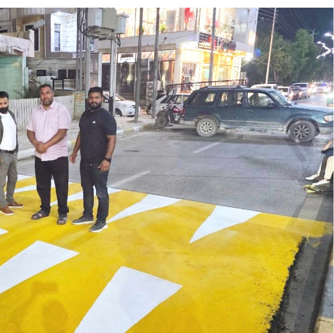
شوارع: المبادرة بإزالة المطبات البلاستيكية المنتشرة في عدد من شوارع ميسان

مشيرا الى ان (الحملة تأتي في إطار جهود المديرية المستمرة للحفاظ على الحوض المائية ومنع التجاوزات على الموارد المائية). البيان أوضح الى ان الحملة شملت كسر أكتاف ثلاث بحيرات مخالفة، إضافة إلى قطع التيار