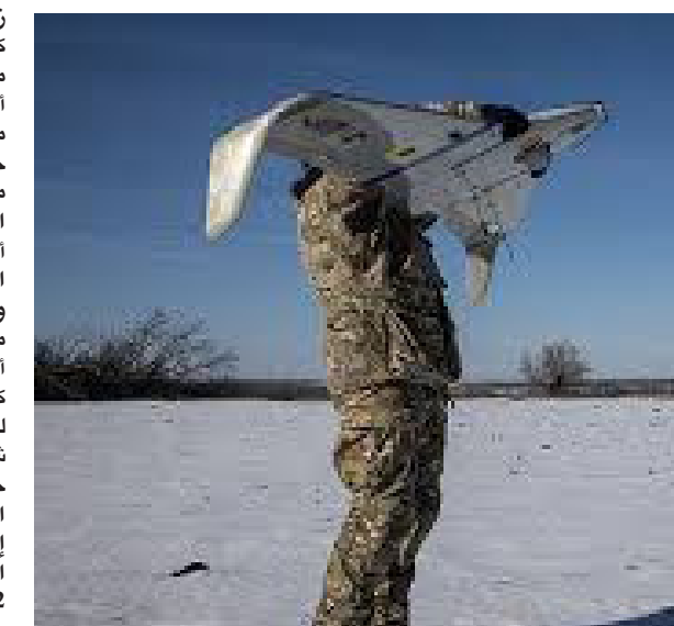
كيفية (ا ف ب) - قال الرئيس الأوكراني فولوديمير زيلينسكي إن خبراً عن تحقيق أوكرانيا مع إيران في الشرق الأوسط وخلال لقاء مع صحفيين من بينهم مراسلون من وكالة فرانس برس، صرح زيلينسكي بأن قواته تربط «بعض الدول على كيفية التعامل مع أنظمة الاعتراض مثل نيرانها، نعم، فعلنا، وعلل ذلك في دولة واحدة فقط كلاً، في عدة دول، وأضاف الرئيس الأوكراني، في تصريحات خطر نشرها قبل يوم الجمعة، أن الأمر لم يكن يتعلق بمهزمة تدريبية أو مشاورات، بل بدعم بناء نظام دفاع جوي حديث يمكنه العمل فعلياً، نعم، لقد كنا وسقطون طائرات شاهدة».

الثاني عشر من نيسان/أبريل 2026، وأوضح الكرمليين أن هيئة الأركان العامة «تلقت توجيهات بوقف العمليات القتالية في كل الاتجاهات خلال هذه الفترة» مضيفاً أن القوات مستعدة للنصيحة لأي استفسارات محتملة من الجانب العدو، ونقلت وكالة «تاس» للأنباء عن الناطق باسم الكرمليين دميتري سبوكوف قوله إن إعلان هذه الهدنة تم بإقتراح مسبقاً مع كييف وواشنطن، ولا يرتبط بمفاوضات إنهاء الحرب. وتابع بيان موسكو «نفترض أن الجانب الأوكراني سيحذو حذو روسيا الاتحادية».