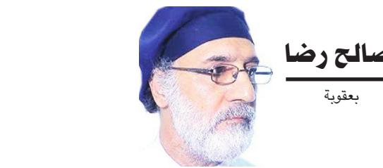
صالح رضا بقوية

ان يسقط في المباشرة او الخطابية. لقد كان يؤمن ان الدراما ليست ترفاً، بل مسؤولية. وأن الكلمة يمكن ان تكون موقفاً. تميز عطوان بقدرته على بناء شخصيات حقيقية، ليست بيضاء تماماً ولا سوداء بالكامل، بل تحمل داخلها صراغاً إنسانياً عميقاً. شخصياته تعيش، تتألم، تخطف، وتبحث عن خلاصها في عالم معقد، وهذا ما جعلها قريبة من القلب، وباقية في الذاكرة. لقد اسهم هذا الكاتب في نقل الدراما العراقية من السيادة الى العنق، ومن السرد التقليدي إلى البناء المركب، حيث تتداخل الأزمنة، وتتقاطع المصائر، في نصوص تحمل بعداً فكرياً وإنسانياً واضحاً. ولعل ما يميز تجربة صباح عطوان، هو صدقه الفني، وابتعاده عن التزييف، فقد ظلّ وقيماً للإنسان العراقي، يكتب عنه، له، ومن اجله. لم يكن يبحث عن الشهرة بل كان يبحث عن قدر ما كان يبحث عن