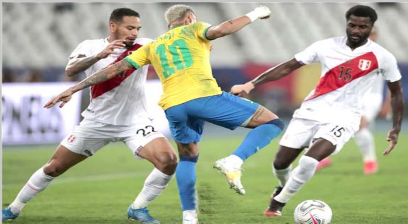
تاهل: منتخب البرازيل يتاهل الى نهائي كوبا أمريكا

بزيادة التغييرات من 3 إلى 5 في مايو/أيار 2020 لمواجهة تداعيات كوفيد-19 ولدعم سلامة اللاعبين، وسط جدول مباريات متكدس. وسيكون تمديد مدة القاعدة على رأس القضايا التي تحنّج مراجعة من الاتحاد الدولي (الفيفا) بقيادة أرسين فينجر مدرب أرسنال السابق، لكن القرار سيخص مجلس كرة القدم على الأرجح. وواجهت الفكرة معارضة من بعض مدربي الفرق بداعي التغييرات الخمسة تخدم الأندية صاحبة الموارد المالية الكبيرة التي تتمتع بعنف في التسكيلة. لكن إذا كان تأخير البلاء جلبا في الأدوار الإقصائية بطولات كبرى فمن الممكن أن تزيد الرغبة في الإبقاء على القاعدة، لتجديد الدماء وإعناش الفرق في أوقات متأخرة بالمباريات.