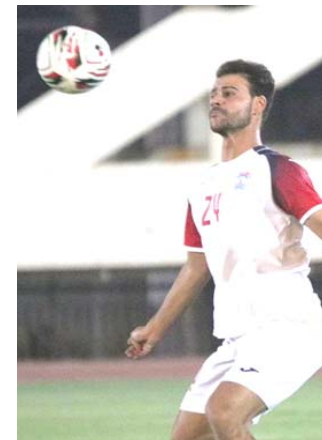
مباراة: نفط ميسان والصناعات الكهربائية