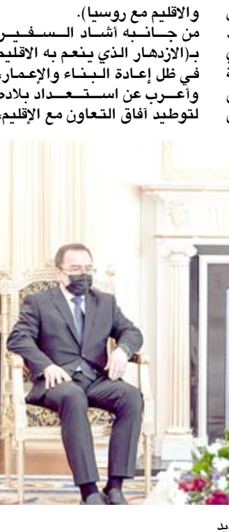
استقبال رئيس اقليم كردستان خلال استقباله السفير الروسي الجديد

وقال بيان تلقتّه (الزمان) امس ان (البارزاني هنا السفير الوفد المرافق له خلال اللقاء الذي جمعهما في اربيل بمناسبة تسلم منصبه، وتضمن له التوفيق في مهامه لتعزيز علاقات العراق