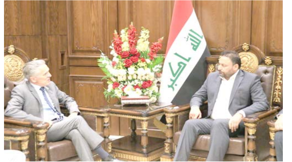
لقاء النائب الاول لرئيس مجلس النواب خلال لقائه رئيس بعثة المنظمة الدولية للهجرة

إلى زعيم الواقعة السياسية سماحة القائد الوطني المقدم والعلمي والشعبي السيد مقتدى الصدر. الموقر. انك اول زعيم ديني وومني يخرج من ديوانه الحصن الى اماكن المسؤولية ليعف اين يكمن الخطأ. انها خطوة تسجل باسم القائد الوطني السيد مقتدى الصدر . لازيم علماني ولا زعيم ديني سيقك. لانك من عروق النخلة وشرايين القلب. ان مهايتك ترتفع في عيون الخريصين على مسار الحياة الطبيعية في بلدنا الذي تحول الى مختبر تجارب سياسية كلما اقتربت من معاناة الفقراء وهو مايفعله عن جدارة تباركك الشعبي والسلام عليكم ورحمة الله.