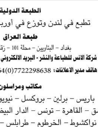
قاسم حسين صالح