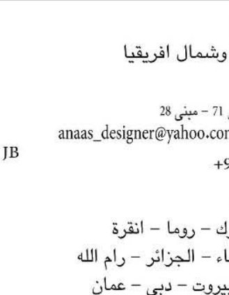
قاسم حسين صالح