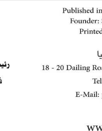
قاسم حسين صالح