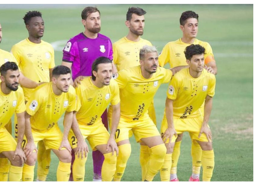
دوري : جرت أمس الثلاثاء، مواجهتان في ختام منافسات الجولة الخامسة والثلاثين للدوري الممتاز لكرة القدم بقاء فريق اربيل مع فريق الكهرية بينما واجه فريق الشرطة على ملعب الشعب فريق الحدود. نتيجة المواجهات على الموقع الإلكتروني لجريدة (الزمان).

اصابة بكورونا في منحني غير مسبوقة منذ ظهور الجائحة. وأشار الموقف الوبائي اليومي الذي اطلقت عليه (الزمان) امس ان (الفحوصات المختبرية التي اجرتها الوزارة لحالات مشتبه اصابها بالفايروس بلغت 52 ألف فحص، حيث تم رصد 8818 إصابة في جميع المحافظات)، مبينا ان (الشفاء بلغ 5998 حالة ووباق 31 وفاة جديدة)، وتابع ان (أكثر من 35 ألف شخص تلقى جرعات اللقاح المضاد في بغداد والمحافظات).