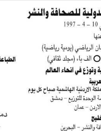
قاسم حسين صالح