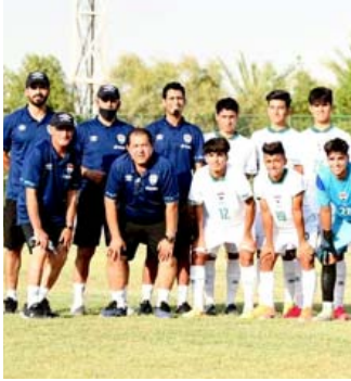
منتخب: الكادر التدريبي واللاعبين لمنتخب الناشئين

واوضح ان حظوظ الفريق بالمنافسة على الوصافة ما زالت قائمة: لدينا 3مباريات نسعى للتصويص من خلالها، مباراتنا المقبلة أمام أمانة بغداد في ملعبنا. يشار إلى أن النجف خسر أمام الزوّراء اليوم في استاد الشعب الدولي بهدفين دون رد. ورفع نفط ميسان رصيده إلى النقطه 39 في المركز الرابع عشر، بينما رفع الصناعات الكهربائية رصيده إلى النقطه 33 في المركز الثامن عشر.