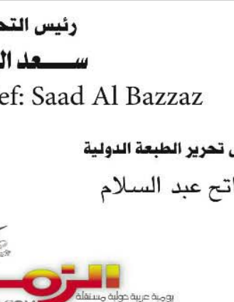
قاسم حسين صالح