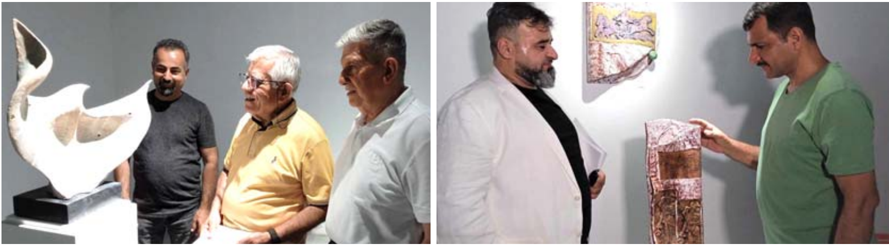
معرض : لغات من معرض (ذاكرة الطين) في اربيل

القاهرة - الزمان حقق ديو المطربة السورية أصالة نصري والمطرب ماجد المهندس (الحب الأبدي) أكثر من مليون مشاهدة عبر منصة (يوتيوب). في أقل من 24 ساعة. كما تصدر هاشتاغ (الحب الأبدي) التريند الأول على منصة (إكس) تويتر سابقاً. في مصر وعدد من الدول العربية. لاسيما بعد تفاعل الجمهور مع جرعة الرومانسية والإحساس العالي بين الثنائي في الفيديو والأغنية من كلمات فاتح حسن. الحان محمود خيامي. توزيع موسيقي مدحت خميس. ميكس وماسنر جاسم محمد. وقد عبر الثنائي نصري والمهندس عن سعادتهما بطرح الأغنية. في منشورات عبر حساباتهما على مواقع التواصل الاجتماعي.