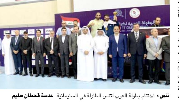
تنس: إختتام بطولة العرب لتنس الطاولة في السلیمانية