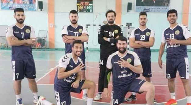
كرة: فريق الحشد الشعبي بكرة اليد