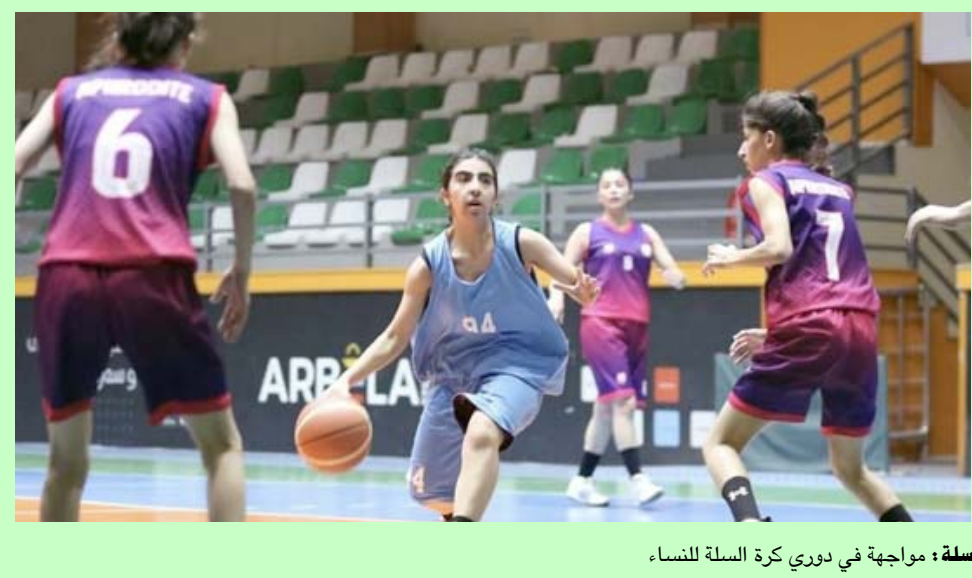
سلة: مواجهة في دوري كرة السلة للنساء