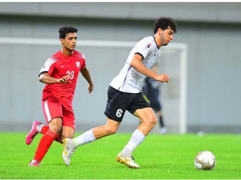
مواجهة: إحدى مواجهات فريق الكهرباء في الدوري الممتاز

المرحلة الثانية تقدم للوصافة ثم تراجع ثالثاً وتأخر فيه لمدة مع امتحان بعض النتائج مدعوماً بحاصل النقاط لكن تراجع نتائجه التي تضاعفت مع مرور الوقت في الفترة الأخيرة وفيها تلقى أكثر من ضربة موجعة الزمنية انتهاء المسابقة خامساً بعدنمائي هزائم في المرحلة الحاسمة وسط اشتداد وتضاعف المنافسة بين الكل من أجل تحسين المركزين ومعها افتقد لنصي من توازنه وخسر الكثير في الجولات الأخيرة لكن ما جمعه من نقاط في البداية هي من أسعفت الموقف وانتهاء الموسم في مركزين جيداً من قبل الإبراهيم والمشاركين السابقين في ظل ما قدمه الأعباء من مساهمات ومساهمات في الفريق برونزية عالية وغير من أوجه المنافسة وقصر نسبة في بداية ولاوع عززت موسم الأعباء في الاتجاه الصحيح وظل أداء الهجوم واستغلال الفرص عندما سجل 53 هدفاً اقل بهدفين عن الزوراء ويهدف عن الطلبة والظهور الجيد للهداف مهمين سليم ملاح