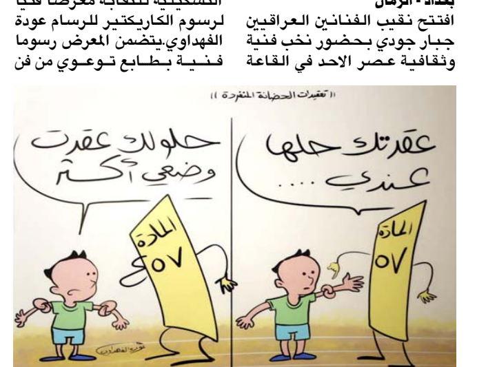
صخرة طفل محور معرض الفهداوي

الكاركتير معبرة عن المطالبة بتعديل المادة 57 من قانون الأحوال الشخصية (احكام الحضنة). وفي كلمة تقب الفنانين هنا القائمين على هذا المعرض مؤكداً ان النقابة تتعاقد بالبراي والمطالبة مع هذه الحملة الوطنية لتعديل المادة 57، مضيفاً ان (الفن رسالة إنسانية سامية والنقابة أبوابها مفتوحة لأي حملة أو حدث يساهم في تنمية المجتمع بواقع إنساني يرتقي إلى مصاف الدول المتقدمة في حقوق الانسان والاهمية احكام الحضنة في بناء الأسرة بقصد الحفاظ على الأطفال من الضياع وتنظيم الروابط الأسرية وتحقيق التوازن بين حقوق الطفل وذويه).