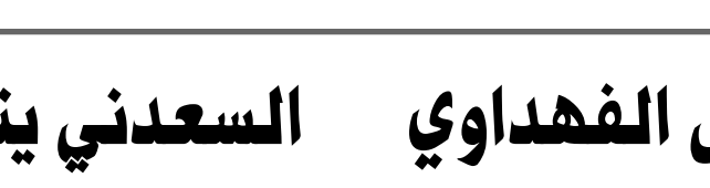
وقدم المخرج السينمائي مهند حياح

وقدم المخرج السينمائي مهند حياح عرضاً للأفلام الطويلة، وما تواجهه الصناعة السينمائية في العراق وحاجتها إلى الدعم الحكومي. وشارك بعدها بعام بدور صغير مع الفنانة شادية في فيلم شيء من الخوف، لكن الإنطلاقة الحقيقية والفرصة كانت حينما شارك امامها كبطل في فيلمها نحن لا نزرع الشوك عام 1971. وتقدم ياسين للمسابقة التي أخرجتها الممثلة فاطم حمامة، من أجل اختيار وجه جديد يشاركها بطولة فيلمها الخيط الرفيع، والذي قررت أن تعود به للسينما بعد فترة غياب، ليتم اختياره بالفعل في أول فرصة له للبطولة بعد أن شارك في تقديم انوار صغيرة في افلام شيء من الخوف امام شادية، والقضية 86. كانت فترة التسعينيات الانتعاشة الفنية لياسين في السينما المصرية حيث