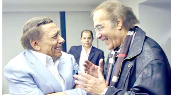
محمود ياسين وعادل امام

المناسبة نستذكر بعض من محطات حياته وفقاً لتقرير موقع الفن، الذي يشير إلى أنه إنقل من بورسعيد إلى القاهرة مع والده بعد تأميم قناة السويس عام 1956 وحصل على ليسانس الحقوق عام 1964 والتحق بالمرح القومي أثناء دراسته الجامعية، وبعد تخرجه من الجامعة عمل بالمحاماة لفترة، لكنه توجه بعدها للمرح القومي. بدأ ياسين مشواره الفني بمسرحية الحلم مع المخرج عبد الرحيم الزرقاني، ليقتف بعدها على