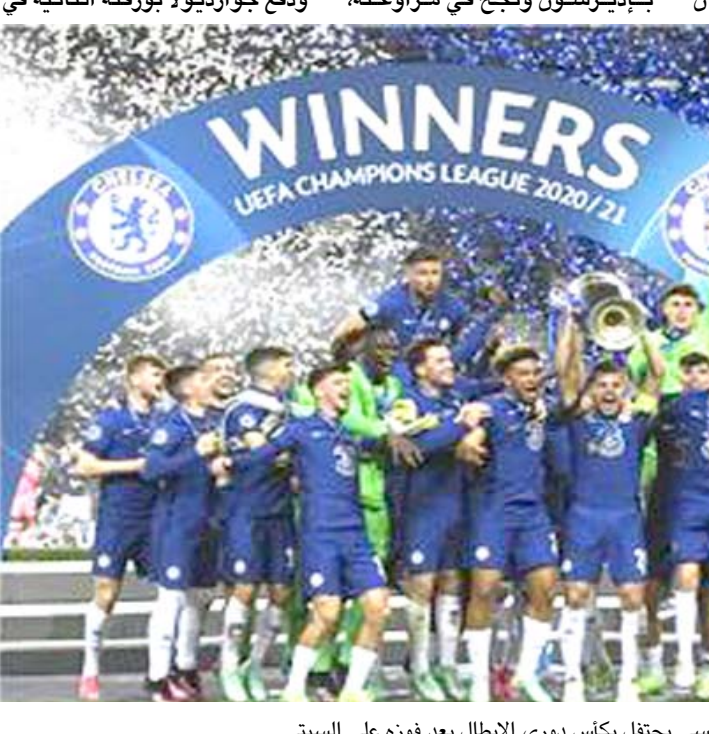
احتفال؛ تشيلسي يحتفل بكأس دوري الأبطال بعد فوزه على السيتي