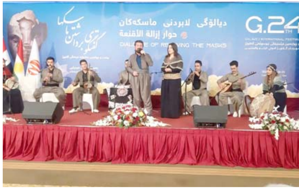
وصلة: فرقة غنائية ايرانية تقدم وصلة من تراث مدينة سندنجد

اسماء ادبية لامعة في الوسط الادبي الكردي، علماً ان هذا المنبر لم للمهرجان الذي يستمر لمدة ثلاثة ايام انه (برغم الأزمات السياسية