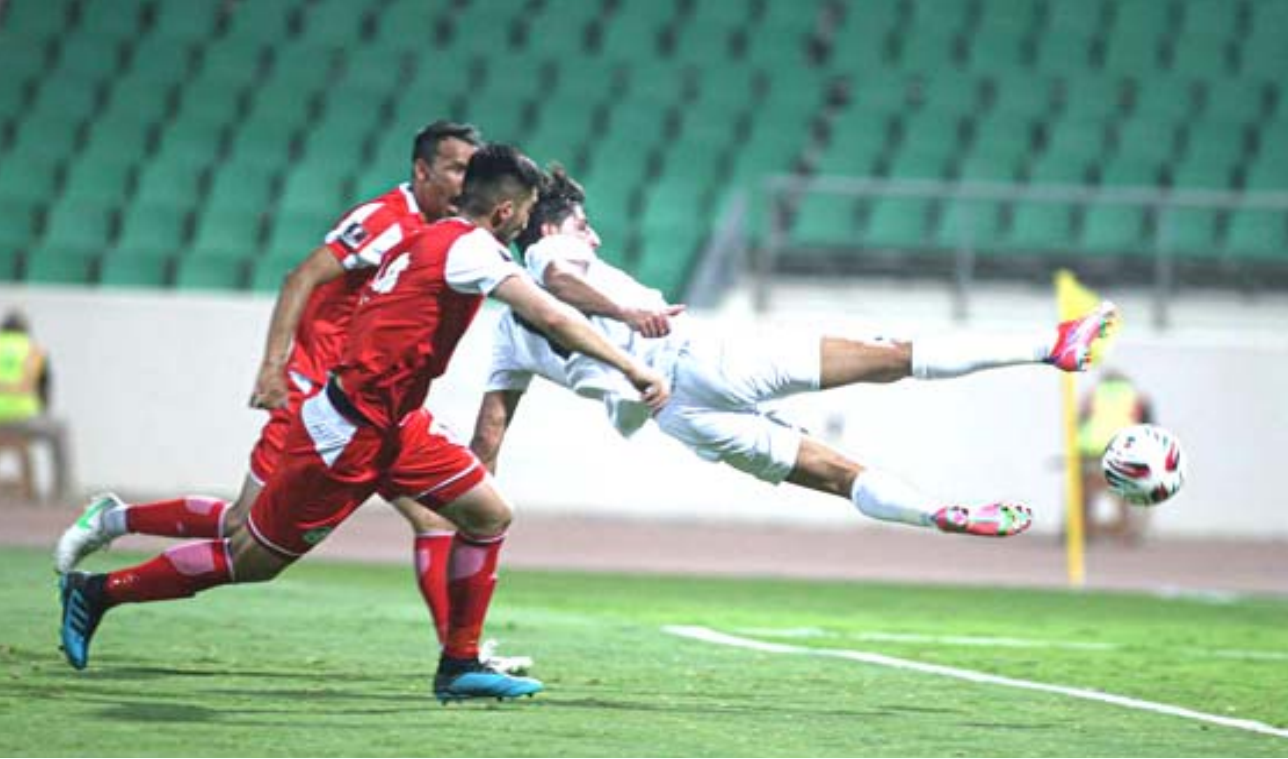
تعاقد: العراق يتعاقد مع طاجكستان في مباراة ودية

البصرة - وفد الاتحاد العراقي للصحافة الرياضية كشفت سلبية النتيجة والأداء للمنتخب الوطني العراقي لكرة القدم أمام نظيره الطاجيكي، عن خلل الثبات على التشكيلة الأمثل التي يفترق إليه الفريق، بعد مباراة كان يفترض ان يستغلها المدرب ستريشكو كاتانيتش في تعميق افكاره الفنية وصولاً إلى الوقوف على الأسلوب الانجح الذي يمكن من خلاله الدخول في معترك ما تبقى من مواجهات في التصفيات الاسيوية المزدوجة التي ستقام في العاصمة البحرينية المنامة في النصف الأول في من شهر حزيران