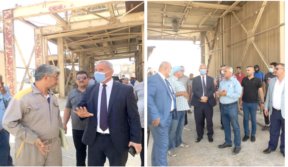
تفقد: مدير عام الشركة العامة لتجارة الحبوب يتفقد صومعة خان بني سعد

وسيطرات خارجية وتابع (كنا نعمل على مقترح مسك السيطرات الخارجية من قبل قوة امنية خاصة لانتهاء هذه الظاهرة السلبية، لكن لم تحصل اي استجابة ولا تزال مستمرة ومنذ سنوات عدة)، مؤكداً ان (فرض