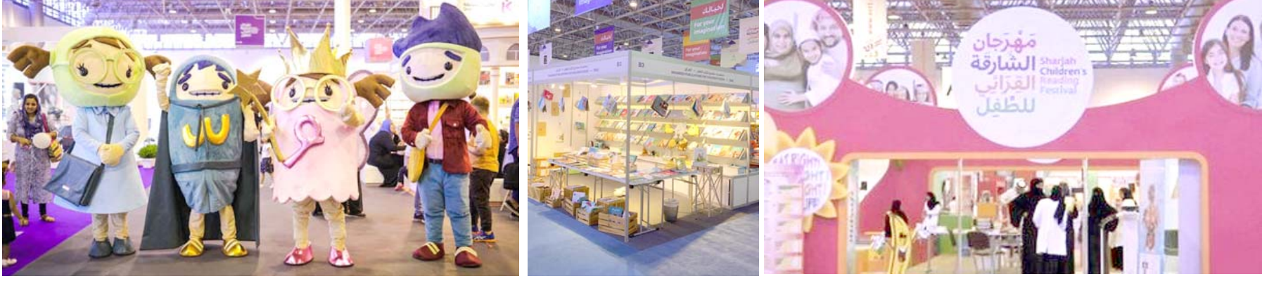
كتب: مشاهد من مهرجان الشارقة القرائي للأطفال

مشاركون في الدورة 12 لمهرجان الشارقة القرائي :