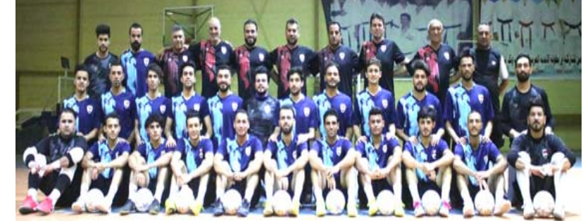
تشكيلة منتخب الصالات

بغداد - الزمان أعلن الإتحاد الآسيوي لكرة القدم مواعيد مباريات الملحق الآسيوي لكرة الصالات المؤهلة لمونديال كأس العالم 2021 في لتوانيا. وقرر الآسيوي إقامة مباراة منتخبنا الوطني للصالات أمام منتخب تايلاند نهائياً في العشرين من الشهر الحالي، وستقام على صالة خورفكان بمدينة الشارقة الاماراتية، بينما سيخوض منتخبنا