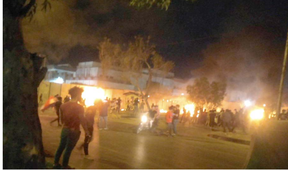
نيران : محتجون غاضبون بضمرون النيران بحميط القنصلية الايرانية في كربلاء

احرار العراق ، انه لا يمكن إجراء انتخابات نزيهة مع وجود السلاح المنفلت والكواتم والاعتقالات المنهجية ضد الناشطين. وادانت حق الحياة والامان وحرية التعبير والراي وتعزيز الديمقراطية والسلام للشعب). وادان الموقف الوبائي اليومي ، الذي اطلعت عليه (الزمان) امس ان (عدد الفحوصات المختبرية التي اجرتها الوزارة، بلغت أكثر من 34 الف عينة لحالات مشتبه إصابتها بالفايروس حدث تم تسجيل 4902 إصابة مؤكدة في