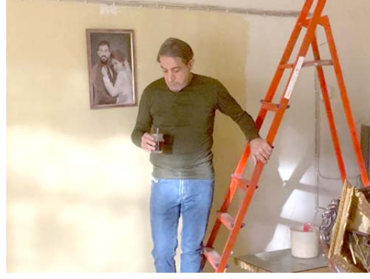
باسم قهار في مشاهد من مسلسل (المنطقة الحمراء)