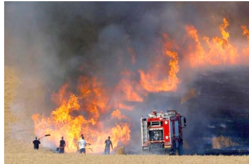
حرائق: الدفاع المدني يحاول اخماد حريق اندلع في احد مزارع الحنطة في كربلاء

شركة لوكهيد مارتن الايركية الى مغادرة العراق. ونقلت التقارير عن المصادر القول، ان (موظفي الشركة سينغادرون العراق بسبب الهجمات على القواعد العسكرية).