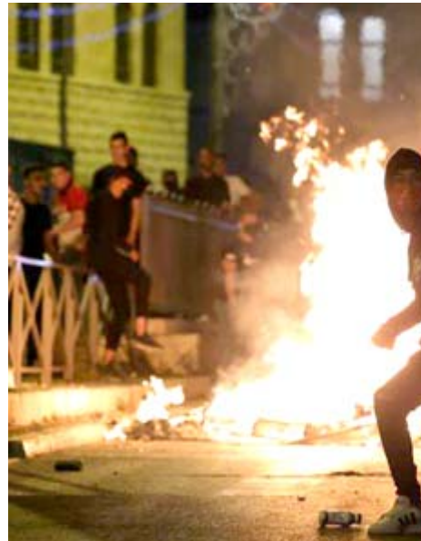
اشتبكات : مظاهرون فلسطينيون يشتكون مع جنود الاحتلال الاسرائيلي

واحد ان تؤكد لالأخوة في حماس ان الانتهاكات لم تلغ ولكن تم تأجيلها حتى يمكن مشاركة سكان القدس في الانتخابات كما اننا سوف ننسق مع الاخوة في الأردن باعتماره ان لها ولاية على الامكن المقدسة لإنشاء صندوق لدعم سكان القدس نقوم بالإنشرف عليهم من جهته حذر محمود الهماش مستشار الرئيس الفلسطيني للشؤون الدينية في تصريحات خاصة للزمان من احتمال اندلاع حرب دينية في المنطقة تسعى إسرائيل إلى اشغالها. وتظاهر مئات الأرمنين بالقرب من السفارة الإسرائيلية في عمان لإحتجاج على أعمال العنف في القدس الشرقية،