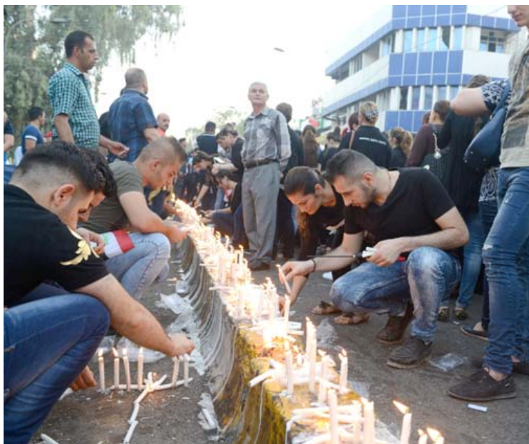
شموع : ذوو شهداء الكرادة الشرقية يستذكرون فاجعة 27 رمضان