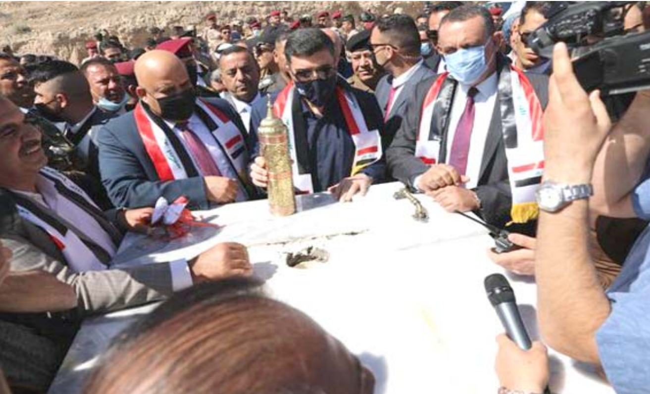
حجر : وزير الموارد المائية يضع حجر اساس سد مكحول

والذي ستغمر بحيرية السد اراضيهم من خلال لجان مشتركة (بهذا الخصوص).