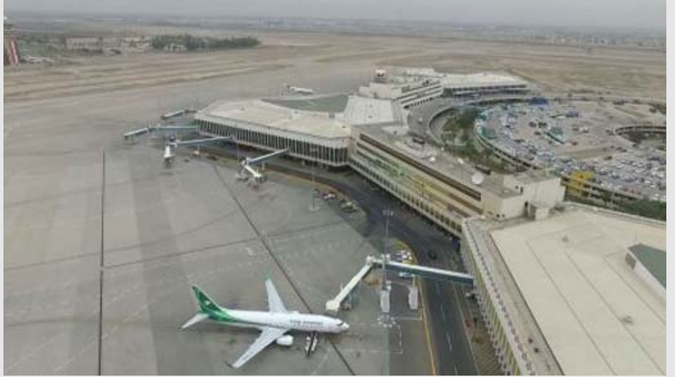
مطار بغداد الدولي

وتستمر الشركة العامة للاتصالات والمعلوماتية متفصلة بملاكات مديرية خدمات الاتصالات والمعلوماتية، ببذل الجهود للتعريف بأهمية النحول الإلكتروني في عمل