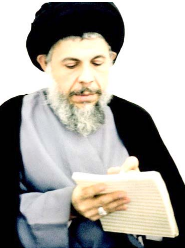
محمد باقر الصدر

تمثل الأعراف والتقاليد وقواعد السلوك ومنظومة القيم، ويؤكد أن هذه المناسمة هي التي تمنح لكل اقتصاد بنية الضوابط والحوافز الضرورية للتطور والارتقاء.