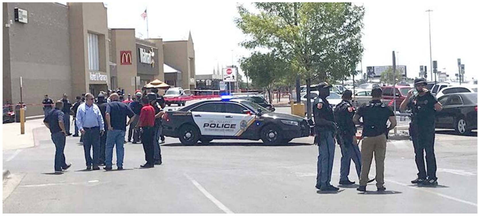
اطلاق : عناصر الشرطة يحيطون بمتجر شهد اطلاق نار وقتلى

تسلسلي. في العام 2020 قتل في الولايات المتحدة أكثر من 43 ألف شخص بالأسلحة النارية بما في ذلك في حالات انتحار، بحسب موقع "غان فايلونز أركايف". وأحصت هذه المنظمة 611 عملية إطلاق نار ضحايا على الأقل، في 2020 مقابل 17 ألفي السنة السابقة ومنذ الأول من كانون الثاني/يناير، قتل أكثر من أربعة آلاف شخص بسلاح ناري في الولايات المتحدة لكن العديد من الأميركيين ما زالوا متعلقين بشدة بأسلحتهم وقد سارعوا إلى شراء المزيد منها منذ بدء جائحة كوفيد-19 أوحيت خلال الاحتجاجات الضخمة المناهضة للعنصرية التي جرت في الربيع والتوترات الانتخابية التي شهدتها البلاد في الخريف.