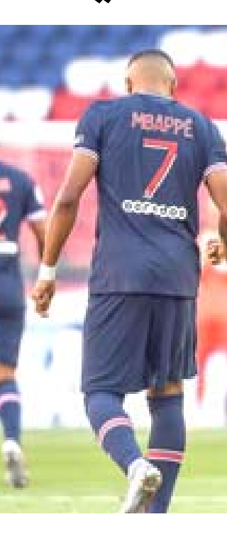
مباراة: جانب من إحدى مباريات الدوري الفرنسي

□ باريس- وكالات: يخطط باريس سان جيرمان للتعاقد مع 3صفقات مدوية خلال الميركاتو الصيفي المقبل، وقال الصحفي في راديو كاديان كوبي، رافا المناسا، خلال استضافته ببرنامج الشيرنجيتو الإسباني، إن سان جيرمان يستهدف جمع الثلاثي كريستيانو رونالدو (يوفنتوس)، وسيرجيو راموس (ريال مدريد)، وسيرجيو أجويرو (مانشستر سيتي) سعياً في حديقة الأمرار خلال الموسم المقبل. وينتهي عقد راموس وأجويرو مع أنديتهم في الموسم الحالي، بينما يتبقى عام واحد في عقد رونالدو مع السيدة العجوز. وزعمت تقارير عدة أن سعر رونالدو محدد بـ 29 مليون يورو، إذا قرر اللاعب البرتغالي الرحيل عن يانكوتيري في الصيف المقبل. يذكر أن سان جيرمان مهتد بخسارة نجميه كيليان مبابي ونيمار دا سيلفا في الصيف المقبل، لذا يسعى لتعويضهما باسماء مميزة. وأعلن لنس الذي يحتل المركز الخامس في ترتيب الدوري الفرنسي لكرة القدم، عن إصابة أربعة من لاعبيه بفايروس كورونا، ليتضمو بذلك إلى عدد كبير من لاعبيه الذين سبقوا أن أصيبوا بكوفيد-19. وقال لنس الذي يخاض من أجل مركز مؤهل