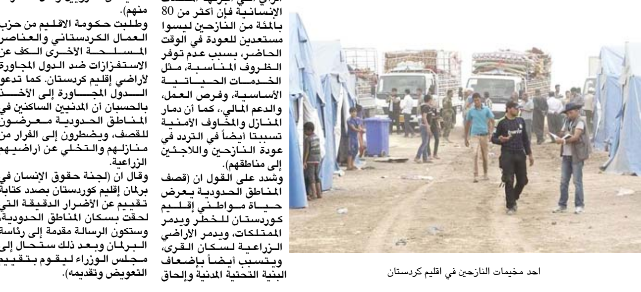
أحد مخيمات النازحين في إقليم كردستان

الإنسان في 149 دولة. وفيما يتعلق بإقليم كردستان، أثار التقرير بعض المخاوف والتي سيتم توضيحها) وفقاً لذلك في هذا البيان. وقال ان (حكومة إقليم كردستان تضيف 992732 من النازحين واللاجئين- 734.713 منهم نازحون، هناك 238345 سوريا، 8440 تركياً، 10534 إيرانياً، 700 فلسطيني، وعلى عكس التصور الشائع، يعيش غالبية النازحين واللاجئين في سكان المنطقة، بينما يعيش 29 بالمئة فقط في 35 مخيماً. فحوالي 38 بالمئة من إجمالي النازحين يعيشون السكان في اربيل، 41 بالمئة في دهوك، و21