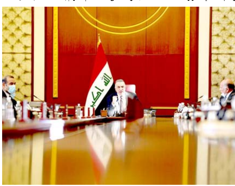
جلسة: رئيس الوزراء خلال ترؤسه جلسة مجلس الوزراء