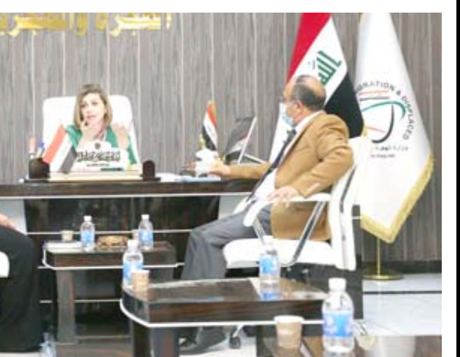
استقبال: وزيرة الهجرة خلال استقبالها وفد منظمة الهجرة الدولية وعددا من الناجيات الأيزيديات

ناقشت وزيرة الهجرة والمهجرين لجان فائق جابرو مع وفد منظمة الهجرة الدولية وعدد من الناجيات الأيزيديات، لإعادة اعمار المدن المحررة