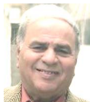
محمد حسين عبد الرحيم

عمل مؤدب ووجه الوزراء كافة، بمبذل الجهود لدعم وزارة التجارة من أجل توزيع سفردات البطاقة التموينية على المواطنين، وعدم منح الفرصة لبعض التجار الذين يحاولون استغلال احتياجات المواطن، واخذ سيادته أنه وجه ايضا وزارة الداخلية وجهاز الأمن الوطني بمراقبة الارتفاع غير المنطقي في الاسعار نتيجة جنش بعض التجار. ودعا الكاظمي الوزارات الى العمل الدؤوب لدعم القرارات الاصلاحية وفق الاستراتيجية المعدة لها، ومواجهة الضغوط بالصبر والعمل الجاد. ووفق السياق الاسبوعي، استعرض وزير الصحة والبيئة حسن التميمي مستجدات عمل لجنة تعزيز الاجراءات الحكومية في مجالات الوقاية والسيطرة الصحية والتوعوية بشأن الحد من انتشار فايروس كورونا، كما