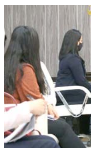
استقبال: وزيرة الهجرة خلال استقبالها وفد منظمة الهجرة الدولية وعددا من الناجيات الأيزيديات

ناقشت وزيرة الهجرة والمهجرين لجان فائق جابرو مع وفد منظمة الهجرة الدولية وعدد من الناجيات الأيزيديات، لإعادة اعمار المدن المحررة