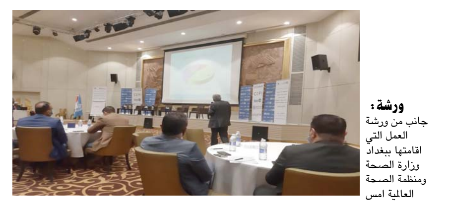
ورشة: جانب من ورشة العمل التي اقامتها بغداد وزارة الصحة ومنظمة الصحة العالمية امس

قررت اللجنة العليا لمكافحة فيروس كورونا في إقليم كردستان تعطيل الدوام الرسمي ليوم الخميس من كل اسبوع، مع فرض حظر لحركة التنقل مع المحافظات الأخرى ، لمدة ثلاثة أيام من كل اسبوع ، فيما سلحت وزارة الصحة والبيئة 5995 إصابة مؤكدة بالفيروس في عموم البلاد، وأوضح الموقف الوياي البيومي، الذي اطلعت عليه (الزمان) امس ان (عدد الفحوصات المختبرية ليوم امس الثلاثاء،