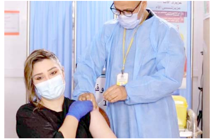
لقاح: آلاء حسين خلال تلقيها لقاح كورونا

بغداد - الزمان تلقت الفنانة المبدعة آلاء حسين اللقاح المضاد لفايروس كورونا في أحد مراكز الرعاية الصحية الأولية ودعت المواطنين المشمولين لأخذ اللقاح حماية لهم ولأحبائهم. مستذكرة والدها الذي غيبه الموت قبل بضعة اشهر اثر اصابته بكورونا.