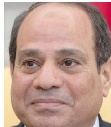
عبد الفتاح السيسي

الإسماعيلية - (ا ب) حذر الرئيس المصري عبد الفتاح السيسي أمس الثلاثاء من المساس بمياه مصر في تعليقه على تطورات مفاوضات سد النهضة الإثيوبي والذي تخشى القاهرة تأثره على حصتها من مياه نهر النيل وقال (نحن لا نهدد أحداً ولكن لا نستطيع أحد أخذ نقطة مياه من مصر وإلا ستشهد المنطقة حالة عدم استقرار لا يتخيلها أحد) وتوعد السيسي الثلاثاء بشراء كافة المعدات التي تحتاجها قناة السويس لمواجهة الأزمات الطارئة غداً بتعويم سفينة الحاويات الضخمة التي أغلقت المجرى المائي لسنة أيام وقال السيسي في مؤتمر صحفي عقد ببركن تابع لهيئة قناة السويس بمحافظة الإسماعيلية: "مهم للغاية توفير أية معدات