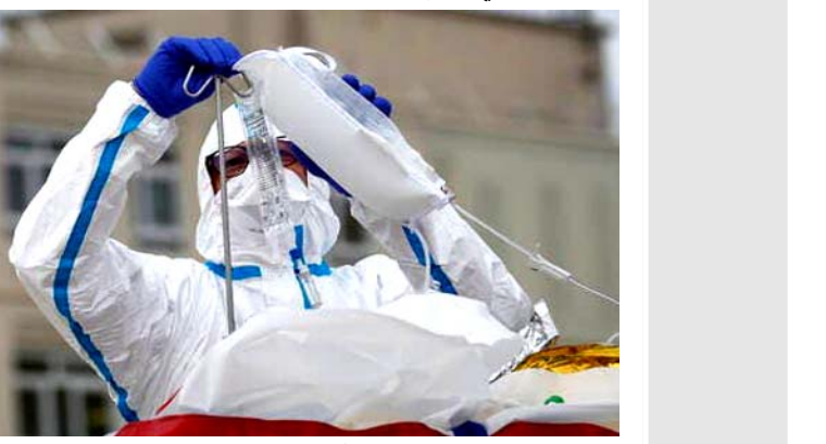
معالجة: فريق طبي يعالج مصاباً

ثمة حيوية وتفاؤل تلبغان حد السير على القدمين من المسبح الى الجانب الشرقي، وصعود سيارة من ساحة الطيران الى العالمة الى سيد الخليب، حيث تنتظري العالدي، ثم معاودة السير من المحطة العراقية؛ فاطمة زحمة.. من وكالة الأنباء العراقية؛ لنالك هميركي. مكنتني طاقة التفاؤل والمناعة البايولوجية، من قسر فايروس كورونا