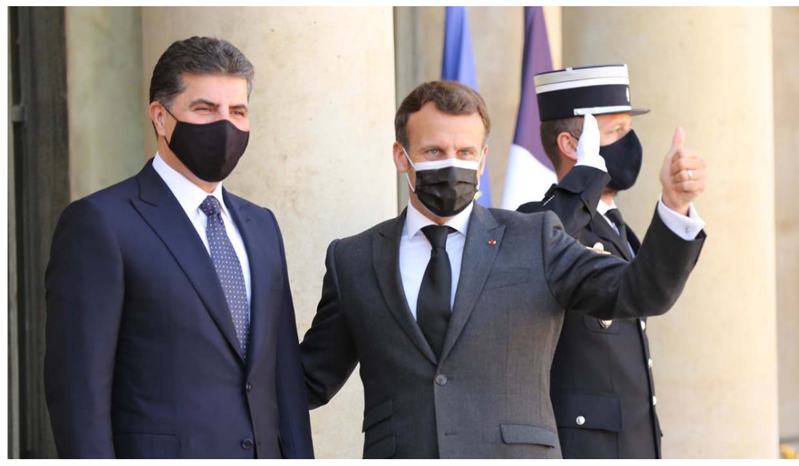
استقبال: الرئيس الفرنسي يستقبل في الاليزيه بباريس امس رئيس اقليم كردستان

التي رئيس اقليم كردستان الرئيس الفرنسي ايمانويل ماكرون في العلاقة وسبل تعزيز التعاون بين الطرفين. وقال بيان لفته (الزمان) امس ان (الجانين ناقشا خلال العلاقات بين باريس وبغداد والاقليم، والتشديد على تعزيز التعاون المشترك بما يخدم جميع الاطراف). فيما أكد ممثل حكومة الاقليم في باريس، علي دولري، وجود علاقات متينة بين كردستان وفرنسا. ووصل البارزاني، امس الأول إلى باريس، في زيارة رسمية، تلبية لدعوة ماكرون. واستمر مباحثات وزير الخارجية فؤاد حسين مع نظيره البرني امين الصفدي والمصري سامح شكري، بشأن تحضيرات القمة الثلاثية المرتقب انعقادها خلال الایام المقبلة في بغداد بحضور العاهل الأردني عبدالله الثاني والرئيس المصري عبد الفتاح السيسي، فيما حددت الولايات المتحدة الامريكى، السابع من نيسان المقبل موعداً لمباحثات الحوار الاستراتيجي مع العراق. وقال حسين خلال مؤتمر مشترك مع الصفدي وشكري ان (الاجتماع تطرق إلى التعاون وتحقيق التكامل الصناعي وتعزيزه بين الدول الثلاث، كما بحثنا تسهيل منح تأشيرة الدخول للجزائر). من جانبه، أكد شكري (اللقاء تناول القضايا الاقتصادية ومنها الطاقة والبيئة والتعاون الدولي والغذائي والاعمار والبناء)، وأضاف انه