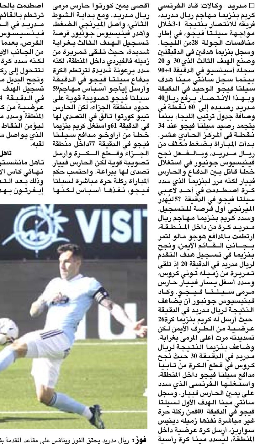
فوز: ريال مدريد يحقق الفوز وينتس على مقاعد المقدمة بقوة