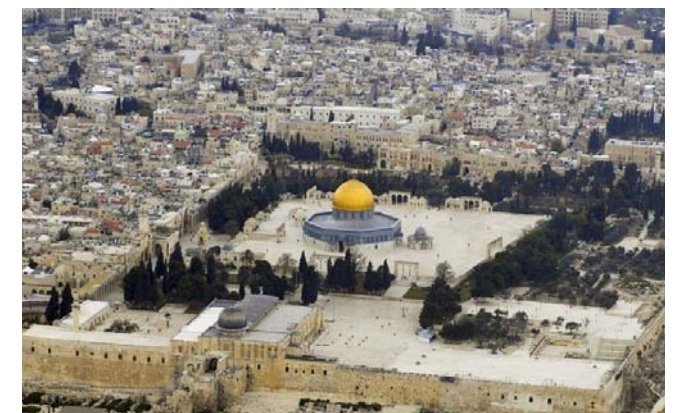
لقطة جوية لبيت المقدس

وسينظم الاقتراع التشريعي في أيار في حين ستعقد 22 الانتخابات الرئاسية في تموز. وشهد الرئيس الفلسطيني محمود عباس على ضرورة إجراء الانتخابات في القدس. لكن ذلك يبدو صعباً ويواجه تحديات قانونية تفرضها إسرائيل التي تمنع أي مظهر سيادي للسلطة الفلسطينية في المدينة تستند إسرائيل في منعها النشاط الفلسطيني إلى قانون تطبيق الاتفاقية المحلية بشأن الضفة الغربية وقطاع غزة للعام 1994. ويعقد الحامي المتخصص 1994 في القانون الدولي معين عودة أن إسرائيل لن تسمح بإجراء الانتخابات الفلسطينية بالقدس. وقال اليوم هناك حكومة يمينية لن تسمح أبداً بانتخابات في القدس من باب إثبات الواقع على الأرض وفرض السيادة. ويرى عودة أنه حتى إذا سمحت إسرائيل بذلك تحت ضغط دولي،