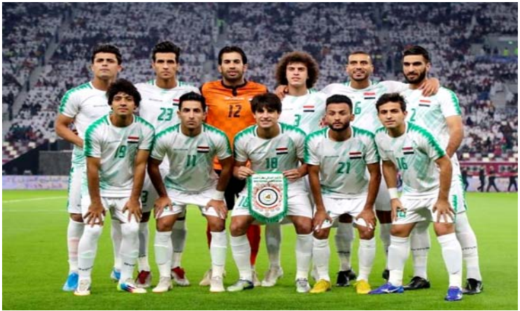
تشكيلة المنتخب الوطني