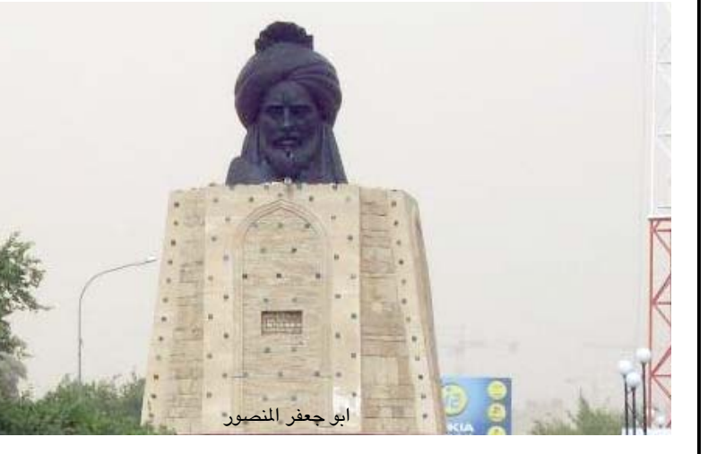
ابو جعفر المنصور

صنع من مادة البرونز والحجر هذا النصب عبارة عن عمود حجري مكسور ايل السقوط يمثل الثقافة العراقية وهناك ابياد واذرع يحاولون جاهدين بان لا تسقط الثقافة ومكتوب على العمود بالخط المساري من هنا بدأت الكتابة يبلغ ارتفاع النصب فقط 60امتار ويبلغ ارتفاعه الكلي مع القاعدة 10امتار . نصب بغداد / تم تأسيسه في عام 2011م يقع في ساحة الاندلس في منطقة