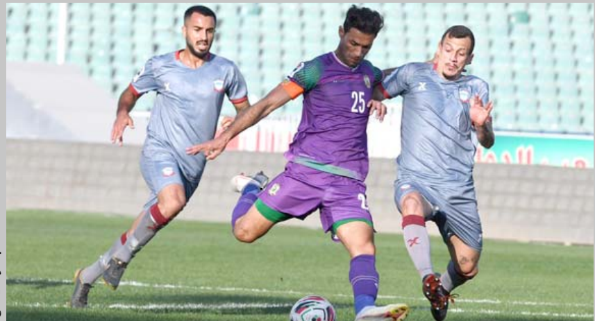
جانب من مباراة الشرطة وزاخو

الجولة 22 في دوري الكرة الممتاز التي احتضنها ملعب الشعب الدولي، قد تم إرساله إلى لجنة الانضباط لاتخاذ القرارات المناسبة بحقها. وأضاف عوفي: ان لجنة المسابقات، الشرطة وزاخو إلى لجنة الانضباط من أجل البت في جميع الملابس التي حصلت في المباراة، واتخاذ القرارات اللازمة بشأنها.