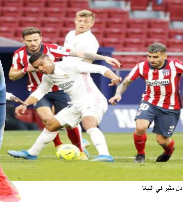
تعال؛ دربي مدريد ينتهي بتعادل مثير في الليغا

بمدينة مباشرة على الطائر ذهب بعيدا عن المرعى، واجرى جوارديولا التبدل الأول للسيتي في الدقيقة 66 بنزول الكر على حساب كانسيلو، فرصة محققة وأهدر مارسيلال فرصة محققة للتسجيل في الدقيقة 68 بانفراد تام بإدريسون، سدادا كرة أرضية تالق الحارس البرازيلي في التصدي لها، ودفع جوارديولا بورفته الثانية في الدقيقة 71 بنزول فودين على حساب جيسوس، وتبعه سولسكار بالذفع بجريشود على حساب راشفورر لمخانة الأخير من الإصابة في الكاثل. وأرسل والكر عرضية مميزة لجيسوس الخالي من الرقابة داخل منطقة الـ6 ياردة في الدقيقة 79 إلا