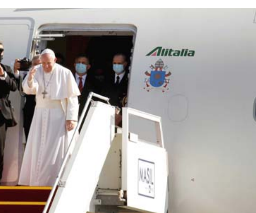
مغادرة: البابا فرانسيس يغادر بغداد امس متوجهاً الى روما

بغداد - (ا ف ب) - غادر البابا فرانسيس امس الإثنين بغداد متوجهاً الى روما بعد إنهاء زيارة تاريخية هي الأولى لحبر أعظم إلى العراق. وافادت تقارير صحفية ان الزيارة انتهت بدون أي حوادث في بلد غالباً ما يشهد توترات أمنية وأعمال عنف. وأكدت السفارة العراقية في دولة الفاتيكان ، ان زيارة البابا فرانسيس هي رسالة أخوة وتضامن مع الشعب العراقي بكافة مكوناته الدينية والمذهبية والعرقية. وفي ختام القداس الذي أحياه في أربيل في اليوم الأخير من زيارته إلى العراق، قابل البابا