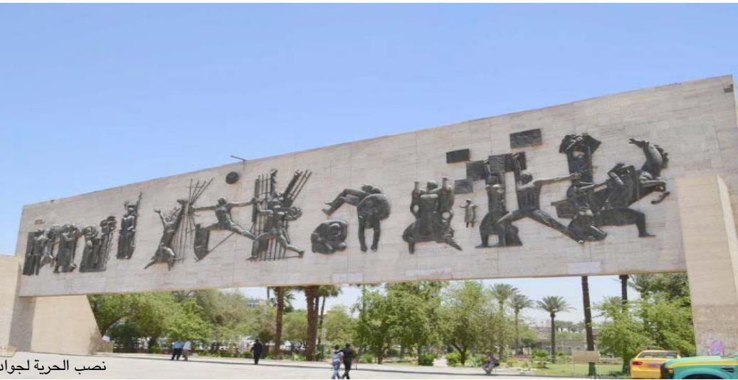
نصب الحرية لجواد سليم

مادة المرمر والفولاذ دفن فيه النحات خالد الرجال يبلغ قطر التل الاصطناعي 250م أما القبة الناتجة فيبلغ قطرها 42م . نصب الثورة / تم نصب ثورة 14تموز / تم تأسيسه في عام 1963م يقع في ساحة 14تموز في المنطقة الخضراء قام بنحته النحات ميران السعدي صنع من مادة البرونز يظهر 4جنود ابطل بشقون طريقهم نحو النصر . نصب انقاذ العراق / تم تأسيسه في عام 2012م يقع بالقرب من ساحة الفارس العربي ومنجزه الزوراء في منطقة المنصور قام بنحته النحات محمد غني حكمت