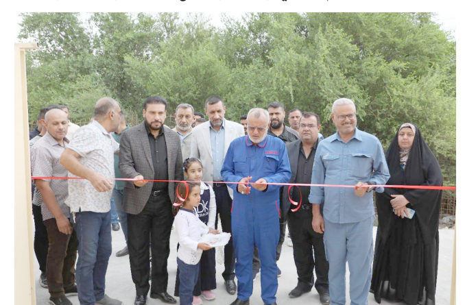
افتتاح: محافظ ميسان يفتتح مدرستين جديدتين

مبان مدرسية وافتتح محافظ ميسان، علي دوي، مدرستين جديدتين في ناحتي الخبر المشاريع في ستة قطاعات، وقال الرئيس التنفيذي للصندوق محمد النجار، في تصريح تابعته (الزمن) امس، ان (التخصيص الأولي لصندوق العراق للتنمية مع الموازنة يبلغ ترليون دينار سنويا، وثلاثة ترليونات طوال اعوام الموازنة الثلاثة)، مبيناً ان (الهدف الرئيسي هو تغيير فلسفة إدارة اقتصاد العراق لخلق تنوع اقتصادي وإدخال آخر التطورات التكنولوجية والاستعانة بالخبرات الارابية عبر الاستثمار الخاص)، ووضح النجار، ان (الصندوق يدعم الاستثمار الخاص، وتوجه لإطلاق أول مشروع خاص بإنشاء مدارس خلال الأسابيع المقبلة).