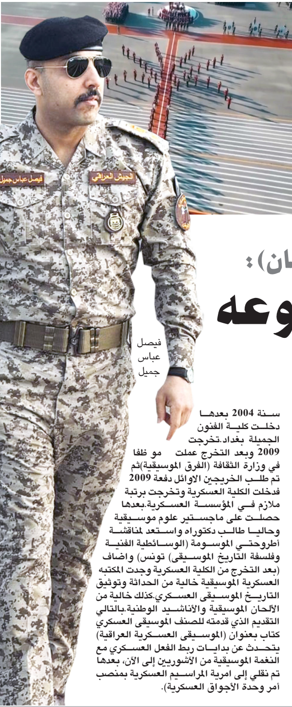
فيصل عباس جميل

أعلنت إدارة مهرجان الأقصر للسينما الإفريقية، برئاسة السيناريسست سيد فؤاد، ومديره المهرجان المخرجة عزة الحسيني، عن تكريم النجمة المصرية ريهام عبد الغفور في الدورة الخامسة عشرة للمهرجان، المقرر إقامتها خلال الفترة من 30 آذار وحتى 6 نيسان المقبل بمدينة الأقصر جنوب مصر. ويأتي تكريم عبد الغفور بناءً على جنيات أقرتها اللجنة العليا للمهرجان، من بينها أنها ممثلة قدمت بأقة من الأدوار التي رسّخت حضورها كممثلة متعددة المواهب في الدراما والسينما، وأن مسيرتها الفنية حافلة وتمتد لأكثر من ربع قرن من العمل في التمثيل، والمشاركة في أعمال مؤثرة على الشاشة الكبيرة والصغيرة، وكُرست ريهام حضورها كإحدى أهم ممثلات جيلها، القادرات على الجمع بين الحس الفني الرفيع والمصق التعبير، حيث تمثل نموذجاً للممثلة التي رامت منذ بداياتها على الجودة متصفاً بالعقد الأول من الألفية، من بينها حريم كريم وملكي إسكندرية عام 2005. وفقدت أيضاً أفلاماً مثل ري البوا جيلتني مجرماً عام 2006، حيث برزت في أدوار أكثت نضجها الفني المبكر، واستمكنت مشوارها السينمائي بأعمال مثل مجيبتا عام 2007، والغاية عام 2008، وصولاً إلى مشاركتها اللافتة في أفلام الهرم الرابع عام 2016، والخليفة عام 2017، وسوق الجمعة عام 2018، وصاحب القام عام 2020، وأزع الولد عام 2021.