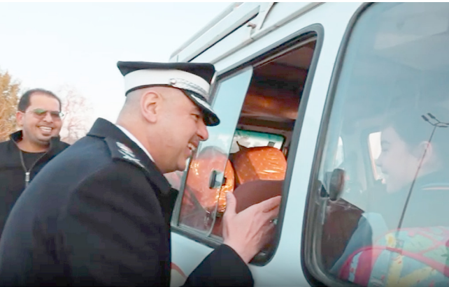
موقف: عدي الحساني خلال تفقده تلاميذ مدرسة

بغداد - قصي منذر لاقت مبادرة مدير المرور العام الفريق عدي سمير الحساني، استحسانا واسعا على مواقع التواصل الاجتماعي، بعد انتشار مقاطع فيديو وهو يقوم شخصيا بتوصيل تلاميذ بالابتدائية تأخروا عن مدارسهم في بغداد بسبب تعطل الباص الخاص بهم. وعلق مدونون على المقطع المتداول بانه (تصرف إنساني استثنائي يعكس حرص المسؤول على خدمة المجتمع، بعيدا عن الطابع البروتوكولي المعتاد). وأضافوا إن (هذا الموقف يبرهن على مسؤولية الحساني، وممارسته للواجب الميداني بشكل مباشر)، مشدين على إن (المسؤولية الحقيقية لا تقتصر على المكاتب والإجراءات الإدارية، بل تتجسد في مساعدة المواطنين، ومساندتهم عند الحاجة)، مؤكداً إن (هذه المبادرة تعكس نموذجاً إيجابياً للتواصل بين المواطن والمؤسسة الأمنية، وتشجع على تعزيز الثقة والاحترام المتبادل بين المسؤولين والمجتمع). مقطع فيديو وأشاروا إلى إن (مثل هذه الممارسات تستحق التقدير والإشادة). وانتشر في وقت سابق، مقطع فيديو يظهر الحساني، وهو يقوم شخصيا بتوصيل تلاميذ تأخروا عن مدارسهم بعد تعطل حافلتهم في بغداد، حيث قام بتوجيه دروبة للمرور لتخليص أو نقلهم بنفسه، لضمان وصولهم إلى في الوقت المحدد، وهي لفحة إنسانية لاقت استحسانا واسعا.