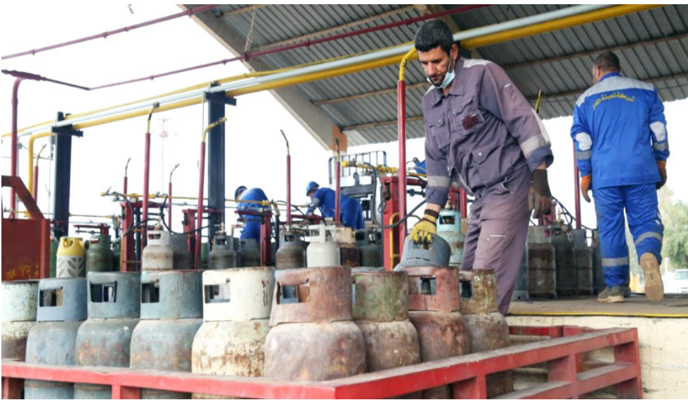
تعبئة : عمال يقومون بتعبئة قناني الغاز

إلى ذلك، نفي رئيس مجلس محافظة كربلاء قاسم البساري، وجود أي شح في مادة الغاز أو وصول سعر القنبلة إلى 33 ألف دينار. وأكد البساري في بيان امس (جيب قطع الطريق أمام المعلومات سديم المونوقفة)، وأضاف (لدينا 10 معامل تعبئة، ما بين حكومية واهلية، تعمل بطاقة إنتاجية تتجاوز 30 ألف أسطوانة غاز يومياً)، مشيراً إلى أن (أي وكيل غاز يشتد منه سعر القنبلة سيتم سحب الوكالة منه وإحاقته إلى القضاء بالتنسيق مع مديرية المنتجات النفطية في كربلاء)، مبيناً أن (الاحتياطي من مادة الغاز يغطي حاجة المواطن الفلبية طوال فصل الشتاء)، واستطرد بالقول إن (هناك لجاناً مستمرة في عملها لمتابعة الأسعار ومحاسبة المتلاعبين، ولا توجد أي أزمة في كربلاء، وأن هذه الشائعات صدرت من بغداد)، وشدد على القول إن (المعامل العشرة يتم تأمين حاجتها من الغاز عن طريق مصرف كربلاء، لضمان استمرار التزويد بشكل منتظم).