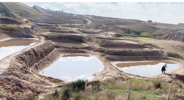
منظر خلابة من سنكاو

اكذ في دراسة سابقة، أجراها مع منظمة الأغذية والزراعة التابعة للأمم المتحدة (الفاو)، على «أهمية المنطقة وصلاحياتها لأن تكون منتجعا سياحيا وصحيا لما تضمه من ميا معدنية (كبريتية) لإسسيا بنابيع منطقة الوادي الأبيض في طبة أجداغ إحدى طبات تركيب سنكاو الكبير»، لافتا إلى أن منطقة الوادي الأبيض.