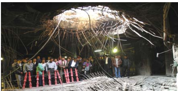
بغداد - الزمان

أكدوا ان المنظمات الدولية مطالبة بإرسال الولايات المتحدة بفرق تفويضات لمحوال الشهداء وعدم الإفلات من العقاب. واستنكرت المنظمات الحقوقية والعالم هذه الجريمة ونادتوا الولايات المتحدة لعدم تكرارها. كما تأسد مواطنون، الحكومة إعادة فتح ملف هذه الجريمة أمام المحكمة الجنائية الدولية لإصدار قرار بإدانة معها وعدم نسيان هذا العمل غير الإنساني والمخالف لقواعد الحرب. بالبنظر لإستهداف ملاذ مندي في العراق والمخالف لقواعد الحرب. وداعين إلى احياء نكراها كل عام قصف جوي استمر اربعين سنة الهجوم وتسيبت بدمار ليلحق العراق جيلا بعد جيل.