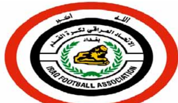
شعار اتحاد الكرة العراقي

عرف عن أغلب المسؤولين من المختصين .. انهم لا يعرفون وربما معهم كثير يتذكرون نجومنا وموزنا الا