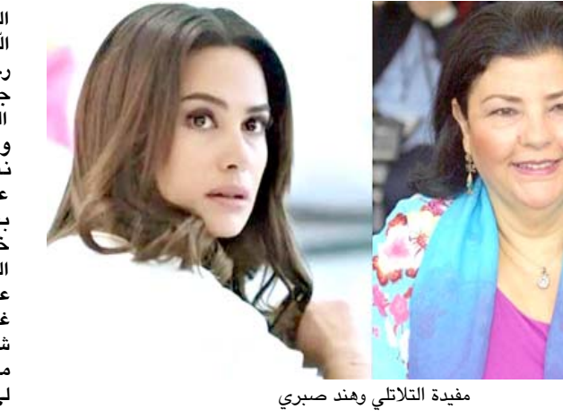
مفيدة التلاتي وهند صبري

تونس - الزمان توفيت الأحد المخرجة السينمائية ووزيرة الثقافة السابقة في تونس مفيدة التلاتي