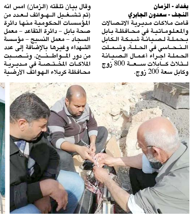
صيانة: ملاكات الاتصالات والمعلوماتية يقومون بحملة صيانة

بغداد - الزمان وقال بيان تلقته (الزمان) امس انه (تم تشغيل الهواتف لعدد من قامت ملاكات مديرية الإتصالات والمعلوماتية في محافظة بابل بحملة لصيانة شبكة الكابل النحاسي في الحلة، وشملت الحملة إجراء أعمال الصيانة لثلاث كابلات سعة 800 زوج وكابل سعة 200 زوج.