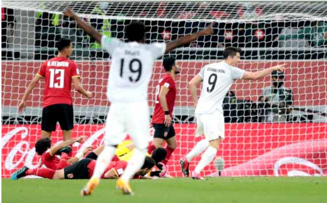
نهائي: يصل الفريق البافاري الى نهائي اندية العالم بعد فوزه على الأهلي

للغفرول، يضغط على إدارة ناديه من أجل التعاقد مع أحد نجوم ريال مدريد. ويسعى كلوب لتدعيم الخط الأمامي في صفوف الريزن، في ظل تراجع النتائج هذا الموسم، وخصوصاً في البريميرليج. وبحسب صحيفة "إكسبيرس" البريطانية، فإن كلوب يرغب في ضم البرازيلي فينيسيوس جونيور في الصيف، مشيرة إلى أن موافقة إدارة ريال مدريد على هذا الانتقال مرهونة بنجاح البرنجنج في التعاقد مع كيليان جبرمان لبيعته في الصيف المقبل، ولغبتى إلى أن فينيسيوس لم يعد أساسياً في حسابات المدير الفني للريال زين الدين زيدان.