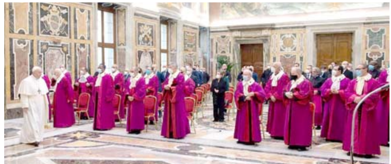
خطاب: البابا فرنسيس خلال لقائه خطاباً أمام السفراء المعتمدين لدى الفاتيكان

بين الشعوب والثقافات). وتوقف البابا عند أهمية الاتفاقات الدولية (التي تسمح بتوسيع علاقات الثقة المتبادلة وتفسح المجال أمام الكنيسة كي تتعاون لصالح الرخاء الروحي والاجتماعي في مختلف البلدان) كما ورد على موقع الفاتيكان. وكان البابا وقع قبل سنتين في أبو ظبي على وثيقة الأخوة الإنسانية من أجل السلام العالمي، مع إمام الأزهر الشيخ أحمد الطيب، ومن المقرر أن يزور البابا فرنسيس العراق في لمدة من الخامس إلى الثامن من آذار في أول زيارة يقوم بها حبر أعظم إلى العراق دون استبعاد أي تلميح في اللحظة الأخيرة بسبب الوضع الوبائي والأمني وتشمل زيارته بغداد والموصل ومدينة أوز الأثرية مسقط رأس النبي إبراهيم.