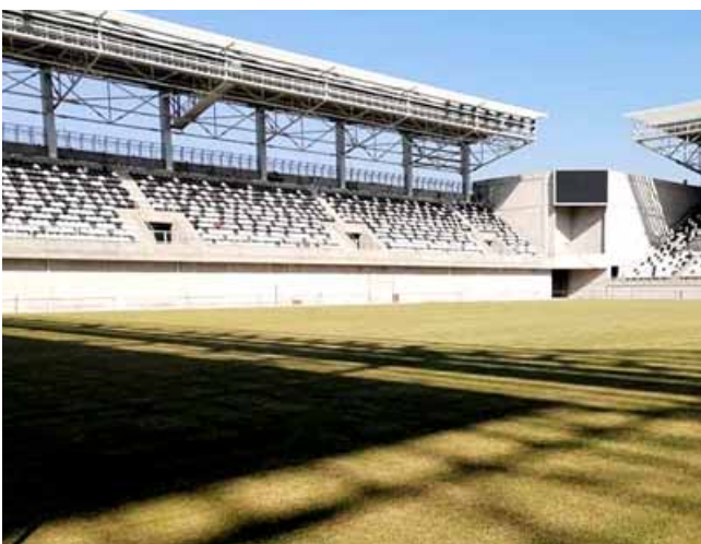
جانب من ملعب الزوراء

بغداد- الزمان أعلنت وزارة الشباب والرياضة، الشروع بتنفيذ أعمال الهيكل الحديدية لملاعب الزوراء الرياضية. وذكرت الوزارة في بيان صحفي ان متابعة وزير الشباب والرياضة عدنان درجال لتفاصيل العمل يومياً، والوقوف على جميع المعوقات وتذليلها اسهم الى حد بعيد عن تقدم العمل بصورة جيدة في مجال التشطيبات والإنهاءات وأعمال الدفن والحمل وتجهيز مواد الهيكل