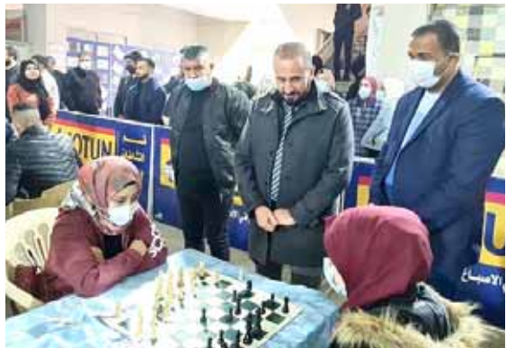
بطولة ، مواجهة نسوية في بطولة الشطرنج في الجامعة التكنولوجية

بغداد- ساري تحسين اقامت الجامعة التكنولوجية بطولة بلعبة الشطرنج فئة الشباب بمرحلة اولية بمشاركة 48 لاعبا