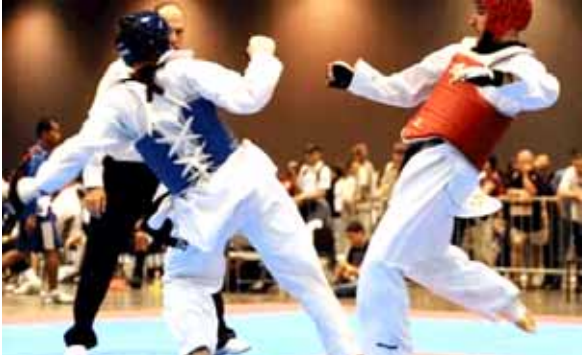
جانب من مواجهات بطولة التايكواندو