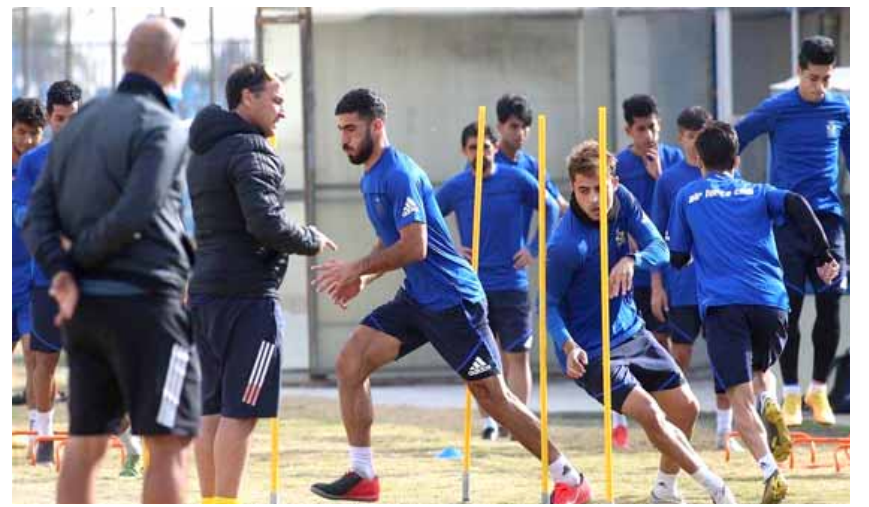
جوية: وحدات تدريبية للفريق القوة الجوية

بغداد- الزمان أكد المكتب الإعلامي لنادي الجوية أن الهيئة الادارية للنادي اتفقت مع عدد من اللاعبين المحليين للتعاقد معهم خلال فترة الانتقالات الشتوية وذلك لتدعيم صفوف الفريق الاول الذي تنتظره مشاركة مهمة في مباريات الملحق المؤهل لدوري