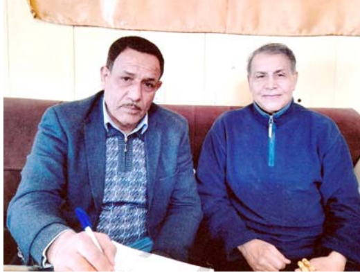
المحرر في حوار مع الفنان

انا لم اغن من اجل لقب ولا اريد ان اكون سفيرا او وزيرا او احمل اي لقب ولكن جاعني اللقب من قبل الناس والصحافة العربية. اغنية يا امي يا ام الوفاء هل كانت لام الغائبة الحاضرة دور في تشاكك فنان ؟ حب الوالدة يسري في كل انسان ولكن جاءت هذه الأغنية بمضمون مصادفة عندما ذهبتا انا والشاعر كريم العراقي لمشاهدة مباراة لكرة القدم وفي إحدى ساعات بغداد شاهدنا اما تحضن أطفالها وما هنا جاء هذا النص للشاعر واللحن لعباس جميل. ما هو الشيء الذي جعل سعدون جابر فنانا؟