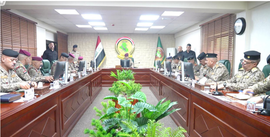
مؤتمر : رئيس اركان الجيش يترأس مؤتمراً لمناقشة آلية اختيار الطلاب المتقدمين للكلية العسكرية

التقديم سيكون إلكترونياً حصراً عبر تطبيق عين العراق وعلى الرباط المخصص. فيما ترأس رئيس أركان الجيش الفريق أول قوات خاصة الركن عبد الأمير رشيد يار الله، مؤتمراً في جامعة الدفاع للدراسات العسكرية لمناقشة آلية اختيار الطلاب المتقدمين للخدمة للكلية العسكرية. ووجه يارالله خلال المؤتمر أسس (بتوفير بيئة تعليمية مناسبة للطلاب القبوليين لضمان إعداد جيل مهني قادر على تحمل المسؤولية وتطوير المؤسسة العسكرية نحو مزيد من الاحترافية)، وأوضح بيان تلقته (الزمان) أمس إن (رئيس أركان الجيش استمع إلى إيجاز مفصل عن آلية اختيار الطلاب وإجراء الفحوصات البدنية والطبية وفق الضوابط والشروط المعمول بها)، مؤكداً