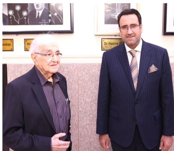
زيارة : سعد الوئري خلال زيارته كلية الطب

محسدة رابطاً حياً بين الماضي الذي صنع الهوية الطبية، والحاضر الذي يواصل فيه الوئري تعزيز مكانة العراق العلمية عالمياً.