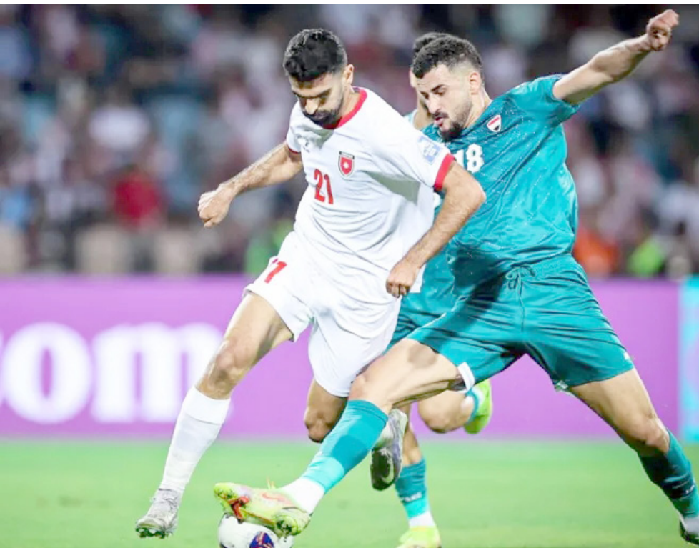
وداع: المنتخب الوطني يودع بطولة كأس العرب بخسارة أمام الأردن

الحلظة الأخيرة د 58 ومرار أكثر من كرة عرضية إلى منطقة الهدف لكن لا يوجد من ينهي الهجمات التي عانى منها الدفاع الأردني فقط تشتتتها الكرات كيما اتفق أغلبها تحولت الى كرات ركنية لكنها لم تستغل أيضا كما يجب وواصل الفريق هجومه المكثف وحاول المنافس استغلال اندفاع لاعبو الوطني وشن هجمات مرتدة لكن الدفاع والحارس لعبودورا في افساسها .