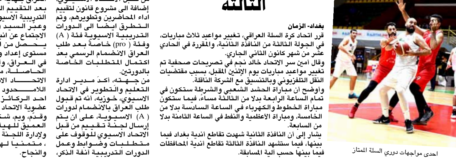
احدى مواجهات دوري السلة الممتاز