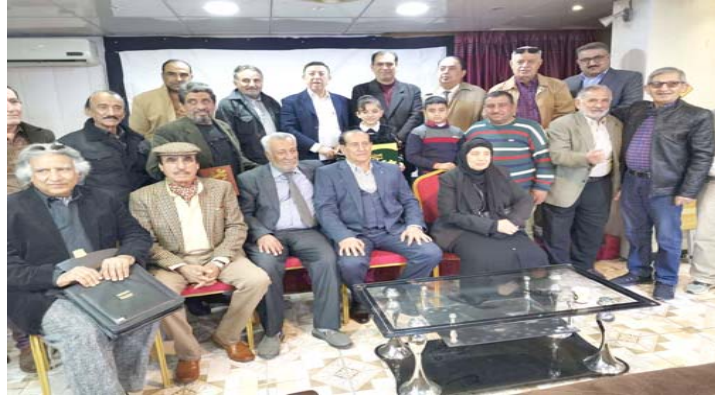
فيلم: منير راضي في ضيافة اتحاد الإذاعيين والتلفزيونيين

هو إضافة الى جهود متميزة). وفي ختام الجلسة تم تكريم المحترفي به شهادة تقديرية قدمها الإذاعي علي جاسم وشهادة اخرى للمخرج علي كاظم الذي عرض سابقا احد افلامه