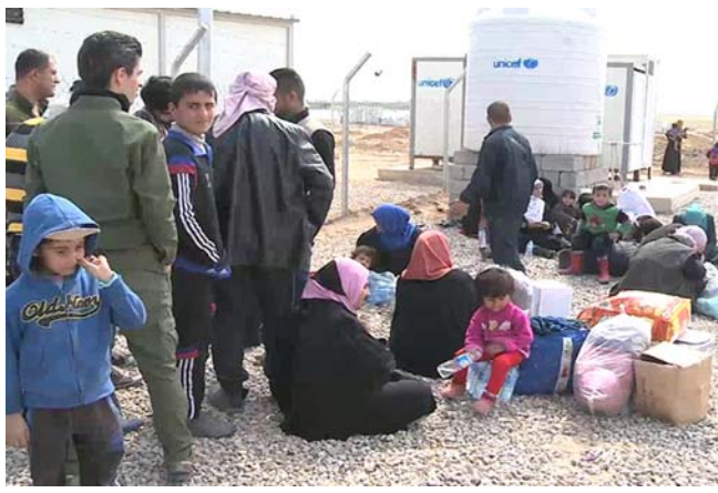
إصابات: عوائل تامل حمايتهم من حبة بغداد

في احتواء مرض حبة بغداد في صفوف اطفال العظيم بعد تسجيل اكثر من 50 اصابة خلال الاسباع 3 الماضية)، لافتا الى (انطلاق حملة لعلاج المصابين بعد وصول ادوية بعقوية). وأضاف العبيدي، ان (الفرق الصحية نجحت في ايقاف