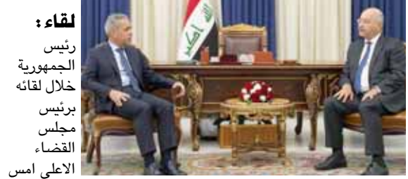
لقاء: رئيس الجمهورية خلال لقائه برئيس مجلس القضاء الأعلى امس

بغداد - ياسين ياس سجلت وزارة الصحة والبيئة 839 إصابة مؤكدة بفيروس كورونا المستجد و9 وفيات جديدة . وأشار بكونرونا في البلاد 599 ألفا و965 إصابة، بينها 549 ألفا و346 حالة بنسبته 91.6 بالمئة. وعلقت الوزارة على موضوع الاصابات