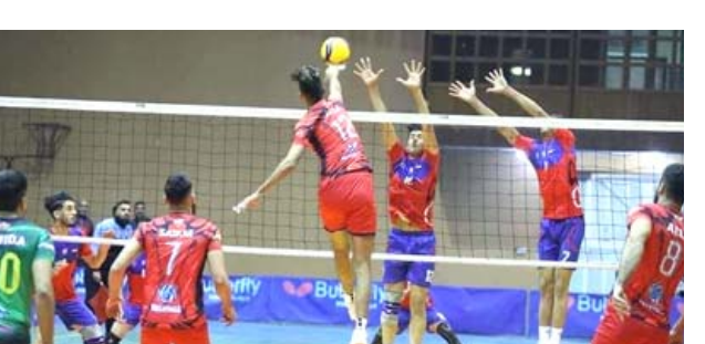
جانب من مواجهات دوري كرة الطائرة

بغداد- الزمان حقق فريق نادي بيشمركة الرياضي بالكرة الطائرة فوزاً مستحقاً على فريق الحبانية بثلاثة اشواط مقابل شوط ضمن منافسات الجولة الثانية من المجموعة الاولى لبطولة اندية العراق باللعبة. وتضم المجموعة اندية الصناعة وديكان والشرطة والقاسم ومصافي الشمال وبيشمركة والحبانية ويستضيف منافساتها نادي بيشمركة.