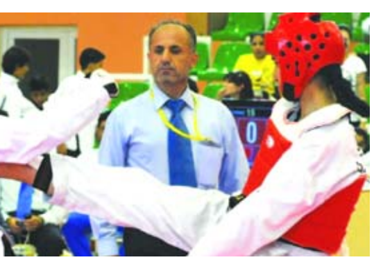
احدى منافسات التايكواندو المحلية

بغداد- الزمان اعلن رئيس الهيئة الادارية للاتحاد المركزي للتايكواندو العراقي ابراهيم البهادلي، ان اللجنة الاولمبية ووزارة الشباب والرياضة، نقضتا قرار اعفائه من منصبه. وقال البهادلي في بيان ان اللجنة الاولمبية العراقية الغت قرار الاعفاء الذي تقدمت به الهيئة الادارية للاتحاد المركزي للتايكواندو العراقي بحق رئيسها ابراهيم البهادلي. واضاف كذلك رفضت وزارة الشباب والرياضة الاعتراف بالرئيس الجديد للاتحاد وابتقت التعامل حصراً مع الرئيس الحالي.