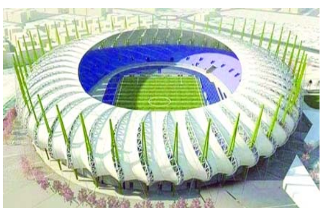
مبنى ملعب الميناء الجديد

استضافة البطولة ثلاثة ملاعب وهي: ملعب البصرة الدولي الذي يتسع لـ 65 ألف متفرج وملعب الفيحاء الذي يتسع لـ 110 آلاف متفرج بالإضافة الى ملعب الميناء، ومن المقرر ان يرسل اتحاد كاس الخليج وفداً الى البصرة للاطلاع على البنى التحتية وتحضيرات العراق لاستضافة البطولة.