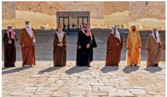
لقطة: زعماء مجلس التعاون الخليجي في لقطة تذكارية

رحب رئيس اقليم كردستان نيجيرفان البارزاني، بنجاح أعمال مؤتمر قمة مجلس التعاون الخليجي والإعلان المشترك لها، مشيراً إلى أن لهذه التطورات الإيجابية تأثير كبير على الأمن والاستقرار في المنطقة.وكتب البارزاني في تغريدة من موقع تويتر(رحب بمساج أعمال مؤتمر قمة مجلس التعاون الخليجي والإعلان المشترك و إعادة فتح الأجواء والعمل من اجل حل الخلافات بين اشقائنا في دول الخليج)، مؤكداً ان (لهذه التطورات الإيجابية سيكون تأثير كبير على الأمن والاستقرار في المنطقة).