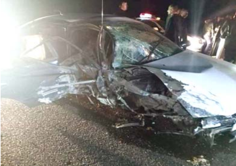
جانب من الحادث الذي تعرض له الحكام