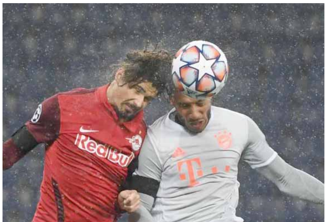
مواجهة: إحدى مواجهات دوري الإبطال في منافسة المجموعات

على سولسكاير إيجاد التوليفة المناسبة والمستقرة، فليس من المقبول أن يقود المدرب النرويجي بتغيير توليفة وسط الميدان كلما سحنت له الفرصة. ويبقى البرتغالي برونو فرنانديز اللاعب السبدي لا يمس في وسط يونايتد، ويتنافس فريد وسكوت ماكومينياني ونيمانيا ماتيتش على موقعين آخرين، في وقت لا يحظى فيه الأول بدعم الجمهور، وإن كان يتمتع بثقة غير مفعومة من سولسكاير.