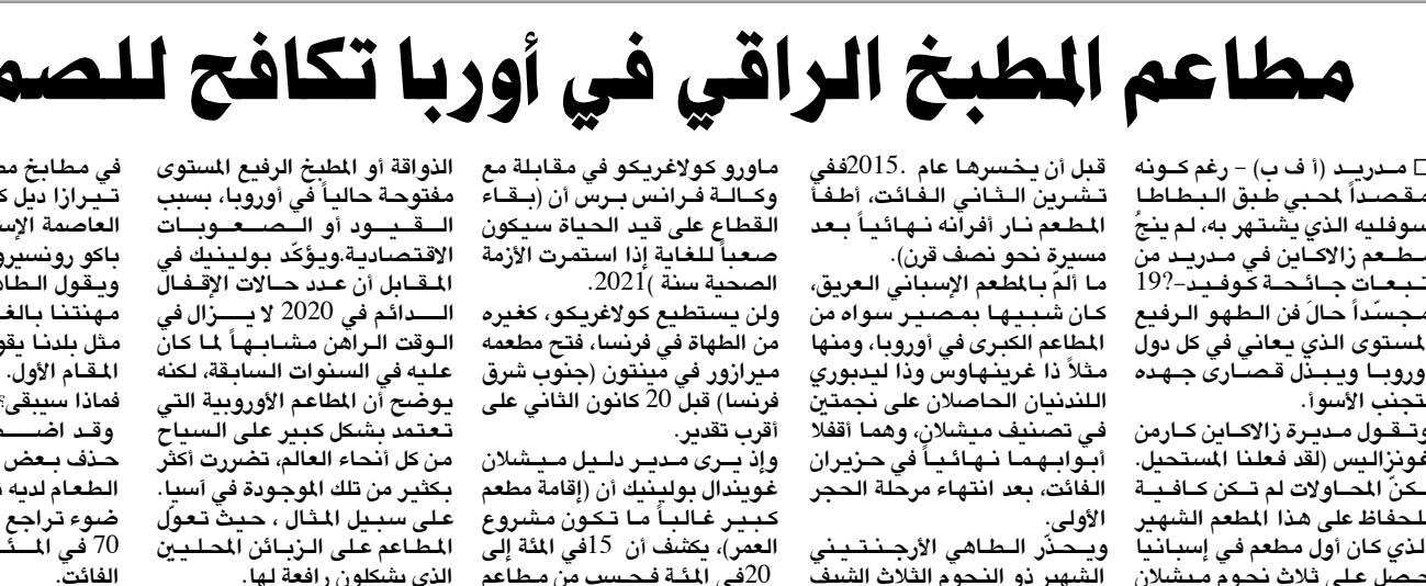
بقية الخبر على موقع (الزمان)