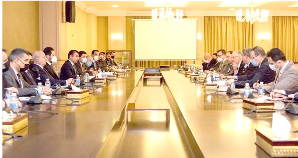
حوار: الوفد الكردي في اجتماع مع الحكومة الاتحادية في بغداد