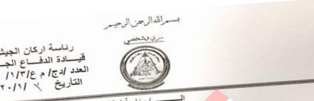
عادل عبد المهدي

اغتيال لقادة النصر (وبعدما). لافتا النظر الى انه (قبل ساعات من عملية الاغتيال، تم استلام رسالة رسمية من الفريق روبرت بات وايت قائد قوات التحالف يوضح فيها بعد عملية الاعتصام امام السفارة الامريكية، الحاجة الى تسنيق افضل مع قيادة العمليات المشتركة وطالب بإزالة القيود الموضوعة على التحالف والسماح بالدخول الى المناطق المحظورة للمجال الجوي العراقي بالإضافة الى ذلك طلب من قيادة الدفاع الجوي العراقي ان تستعد على الفور بإشارة الرادار للتحالف حتى تساعد هذه الاجراءات على تحسين القدرة على مشاركة المعلومات والتعاون لضمان سلامة الجميع).