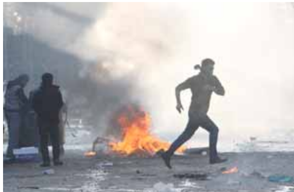
نيران: متظاهر يهول وسط نيران الاحتجاج

التصرف حسب القانون والالتزام عن استخدام العنف، وفتح المجال أمام وسائل الإعلام لممارسة عملها بحرية دون تخيد أو تضيق أو اعتداء، واستمرار صحفيين وأعلاميين في كوردستان، قرار غلق قناة أن تي، بعد نقلها للتظاهرات الأخيرة في الاقليم، مطالبين بإعادة فتحها بأسرع وقت، فيما شنّدوا على ضرورة عدم انخراط المؤسسات الإعلامية والصحفيسين في الصراعات السياسية، على صعيد متصل، ردت وزارة المالية في حكومة الاقليم، على كتاب مرسل من وزارة المالية، الذي ابدت فيه استخدام اربيل للاحتجاج بالقانون، وقال الوزير اوت شيخ جبار، خلال مؤتمر مشترك مع وزير الإقليم لشؤون التقاوض خالد شواني، ورئيس ديوان مجلس وزراء الإقليم أحمد صباح أن (الوزارة تسلمت كتاباً من الحكومة الاتحادية بشأن قانون تمويل العجز المالي وقد أجبنا باتبنا مستمعين للاقتراح بالقانون)، وزار وفد رفيع من إقليم كوردستان، بمراسلة وزير المالية، شيخ جبار بغداد الخميس الماضي، بخصص التقاوض مع الحكومة بشأن ملفي النفط والموازنة.