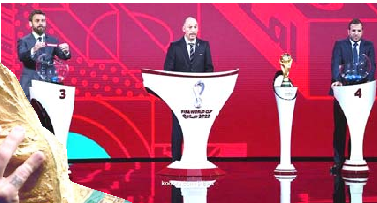
قرعة؛ مشاهير الكرة تسحب قرعة القارة الأوروبية المؤهلة الى كاس العالم في قطر

وفقاً للنظام الأوروبي، يتم تقسيم 55 منتخبا على عشر مجموعات بحيث تضم كل مجموعة خمسة أو ستة منتخبات، ما أسفر يوم الإثنين عن مواجهات على سبيل المثال لألمانيا مع ليشتنشتاين وإنجلترا مع سان مارينو وهولندا مع جبل طارق، وهذا بالتالي يتسبب في انتشار فكرة أن التوقف الدولي يكون مملاً ولا يكون مرحياً بظهوره خلال منافسات الأندية الأوروبية، ولم يكن صعود إنجلترا إلى كاس العالم الأخيرة بعيداً حيث أنه بعد الفوز 0-1 على سلوفينيا وضمان التأهل إلى روسيا، التي المشجعون الذين يشعرون بالملل طائرات ورقية في الملعب بدلاً من الاحتفال، لكن في بعض مناطق أخرى في العالم، يكون التوقف الدولي