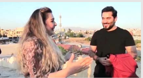
جمال الطبيعة: مشاهد من جولة (كلام الناس) في دهوك