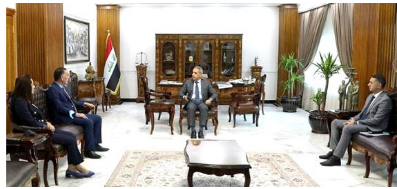
جانب من اجتماع رئيس مجلس القضاء مع لجنة الشباب في البرلمان

بغداد - الزمان استقبل رئيس مجلس القضاء الأعلى فائق زيدان في مكتبه امس الأربعاء رئيس لجنة الشباب والرياضة في مجلس النواب عباس عليوي والاعضاء ارة زو محمود خدر وديار طيب بروار وبحث معهم الاشكاليات التي رافقت انتخابات اللجنة الاولمبية العراقية والمعالجات المقترحة بخصوصها. واوضح زيدان ان المحكمة المختصة بالنظر في المنازعات الرياضية في الكرخ سوف تنتظر وفق القانون بالدعوى التي قدمت بخصوص هذه الاشكاليات . وأرسلت اللجنة الاولمبية الدولية رسالة الى نظيرتها العراقية تبغها بتجميد أنشطة اللجنة الاخيرة بعد شكوى رئيس اللجنة الاولمبية المنتهية ولايته رعد حمودي لدى اللجنة الدولية والطعن الذي قدمه ضد قرارات الهيئة القضائية المشرفة على الانتخابات والمندوبة من قبل مجلس