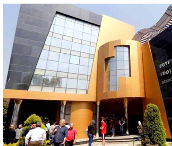
اتحاد الكرة المصري

جماهيري كبير ولاسيما انها سوف تحدد أيضا الفريق الذي يمثل مصر في بطولة العالم للاندية. ومع زيادة الشحن