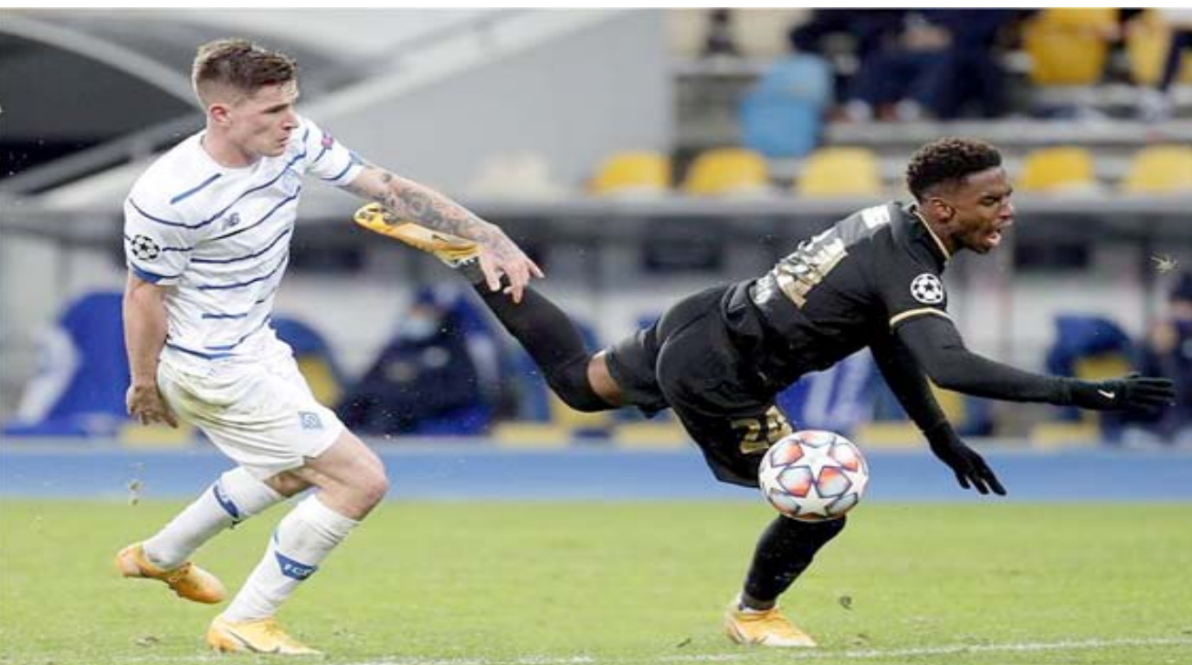
فوز: برشلونة تحقق فوزاً عريضاً في مسابقة دوري الاطال

وضع اسمه على لائحة الهادفين، لكنه سدد فوق المرمى إثر تمريرة من فرنانديز بالدقيقة 49. وجرب فيسكا حظه بتسديدة من بعيد تألق حارس يوناييتد دافيد كرتي المرمي في الدقيقة 17. وعزز فرنانديز تقدم فريقه بهدف ثان في الدقيقة 19 عندما فشل الحارس في التخطئ عرضية سهلة من تيليس، لتستقر أمام اللاعب البرتغالي الذي وضعها بسهولة في المرمى الخالي. ونفذ فيسكا ركلة حرة مباشرة من مسافة بعيدة لتخلو الكرة العارضة في الدقيقة 28 واحتسب الحكم ركلة الجزاء ليوناييتد بعد تعرض راشفورد للقرعة، داخل المنطقة، نفذ ثوروك ركلة حرة فوق الحائط البشري، لتجتاز خط المرمى قبل ان يبعدها دي خيا. وكان المتألق فيسكا يسجل هدفاً ثانياً لتسديته الصاروخية البعيدة ارتدت من العارضة، وتمكن فرنانديز إثر هجمة مرتدة من إضافة الهدف الرابع في الدقيقة الثامنة من الوقت بدل الضائع بإضواء جيمس، إثر تمريرة على طبق من ذهب أمام المرمى من جرينوود.