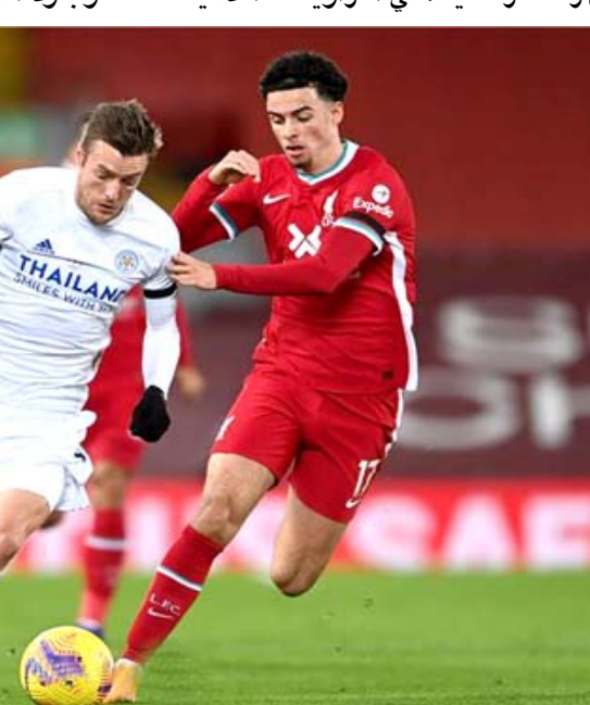
فوز فريق ليفربول يستعيد نغمة الفوز في الدوري الانكليزي

الضيقة، لكنه هز الشباك من الخارج في الدقيقة الثانية. وانفذ حارس ليستر، كاسبر شمبايكل، هدفاً محققاً في الدقيقة 11 عندما شن ليفربول هجمة مرتدة، مرر على إثرها نايي كيتا الكرة إلى كورتيس جونز، الذي اطلق تسديدة قوية أبعداً الدنماركي. وعاد شمبايكل ليتلقى في الدقيقة 14 عندما مرر ماني الكرة إلى جوتا، الذي سددها من مشارف منطقة الجزاء، لكن الحارس كان لها بالمرصاد. وسجل ليفربول هدفه الأول بالدقيقة 21 عندما حاول إيفانز تمريرة من ميلنر، في الدقيقة 56 بينما أصاب فيرمينو القائم في الدقيقة 57 بضربة رأسية من عرضية قصيرة لجوتا. وبسدد الكرة وكانها ترفض دخول مرمي الخعالب، عندما