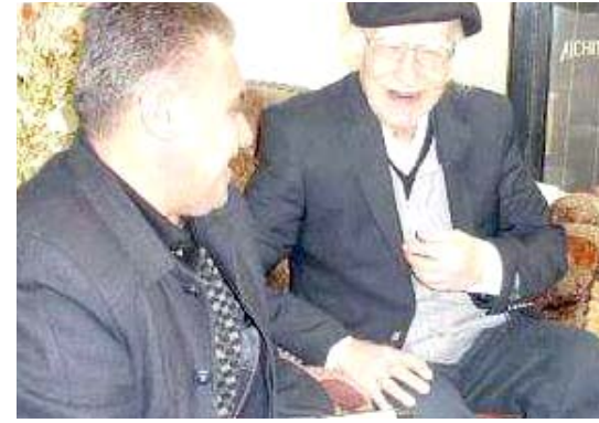
آخر حوار مع (الزمان) للراحل