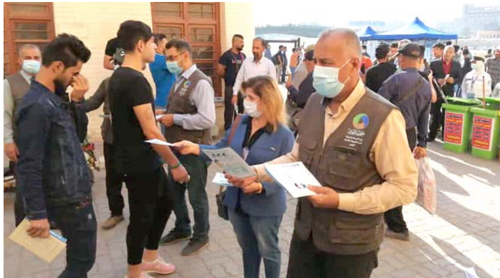
موظفو الصحة يوزعون إرشادات ضد كورونا

طويل قبل السيطرة على فيروس كورونا المستجد على مستوى العالم وسجلت منظمة الصحة لأول مرة أكثر من 9500 وفاة في ثلاثة أيام متتالية: 9928 الخميس و 9567 الجمعة و 9924 السبت.