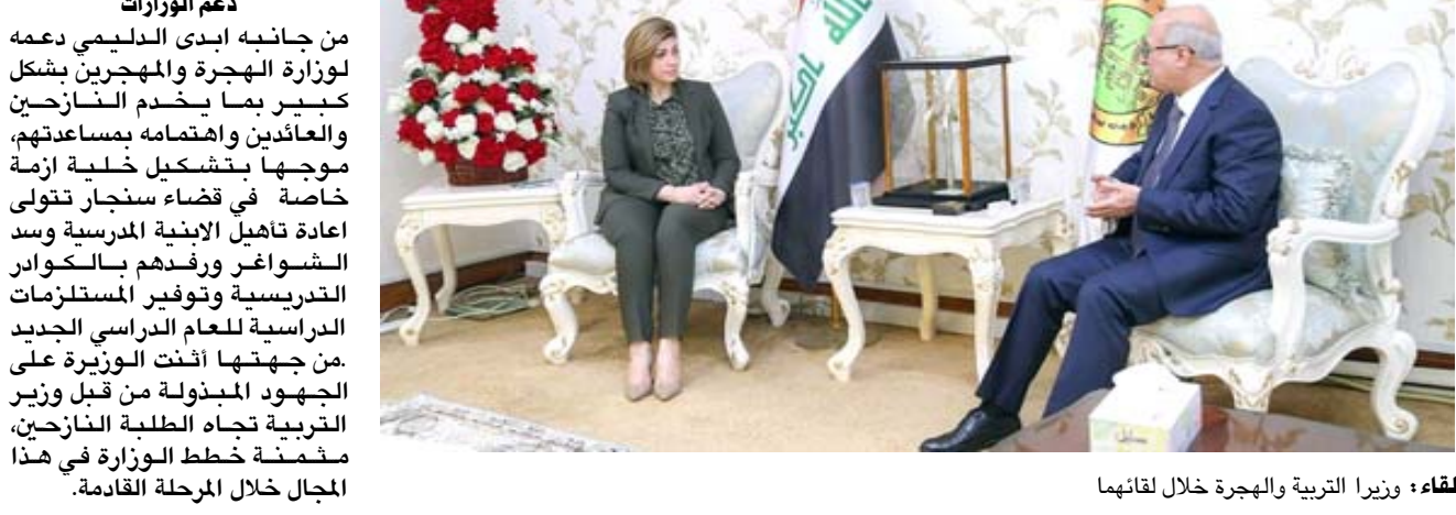
لقاء وزير التربية والهجرة خلال لقائهما

بغداد - الزمان بحثت وزيرة الهجرة والمهجرين ايفان فائق جابرو اليوم مع وزير الخارجية فؤاد حسين تعزيز العلاقات الخنائية وتطويرها ، إضافة الى بحث عدد من القضايا ذات الاهتمام المشترك التي تخص العراقيين في بلدان المهجر . ونقل بيان تلقته (الزمان) امس عن جابرو في القول ان (الوزارة) تتطلع خلال الفترة المقبلة الى تنسيق الجهود المشتركة بين الوزارة ووزارة الخارجية من اجل فتح مكاتب لها في الدول التي يتواجد فيها اللاجئين العراقيين باعداد كبيرة ، وبموظف واحد للوزارة ، لغرض تسهيل اجراءات عودة الراغبين طوعا من تلك الدول الى البلاد، فضلا عن رعاية شؤون المهجرين والمهاجرين في تلك الدول الى جانب العمل على تقديم كافة المستلزمات الضرورية لعودتهم ومنها التنسيق مع كافة الجهات المعنية وبضمنها وزارة الخارجية وتوفير المساعدات والتسهيلات اللازمة لهم داخل البلاد بعد عودتهم، مشيرة الى ان