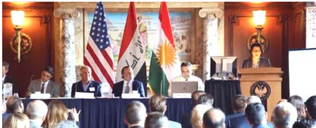
مؤتمر رجال أعمال أمريكيين في مؤتمر للإستثمار في واشنطن