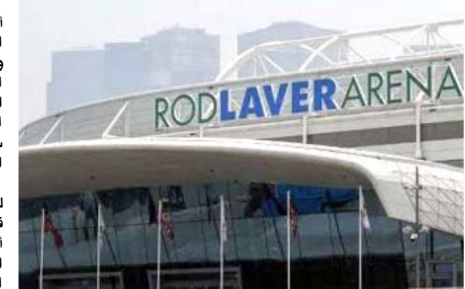
أحد المنشآت الرياضية الأسترالية والتي من المقرر أن تحتضن بطولة التنس

□ سدني - اف ب: ذكرت تقارير صحفية، أمس السبت، أن موعد إنطلاق بطولة أستراليا المفتوحة للتنس، سيتأجل من يناير/كانون ثانياً إلى فبراير/شباط أو مارس/آذار من العام المقبل، بسبب