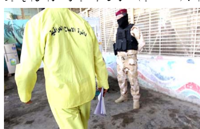
جانب من سجن الناصرية

جنيف- الزمان وصفت المفوضية العليا لحقوق الإنسان في الأمم المتحدة ميشيل باشليه إعدام 21مادانا بتهم على صلة بالإرهاب في سجن الناصرية بأنها (مقلقة للغاية)، محذرة من