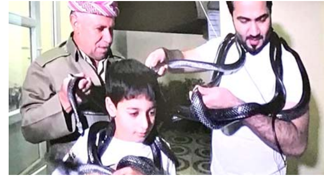
جولة : لقطات من جولة برنامج (كلام الناس) في دهوك