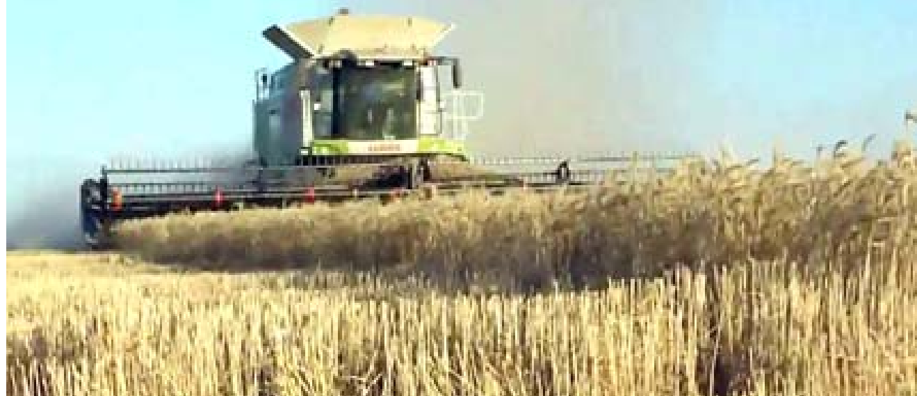
حصاد: البات تحصد الشلب في مشروع النجف