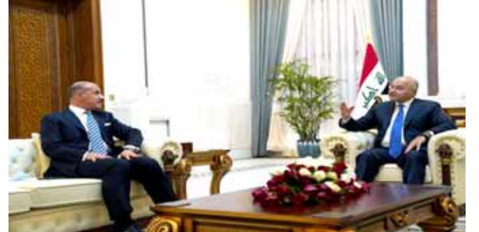
لقاء، جانب من لقاء رئيس الجمهورية مع وزير الشباب والرياضة

بغداد- الزمان أكد رئيس الجمهورية الدكتور برهم صالح، في قصر بغداد، وزير الشباب والرياضة عدنان لثقاق، ان دعم المواهب الشبابية وتدريبهم في مختلف المجالات الرياضية، من شأنه تطوير الواقع الرياضي، وتأهيل الشباب وريادتهم، ومنح الموهوبين الفرص المناسبة لتحقيق طموحاتهم.