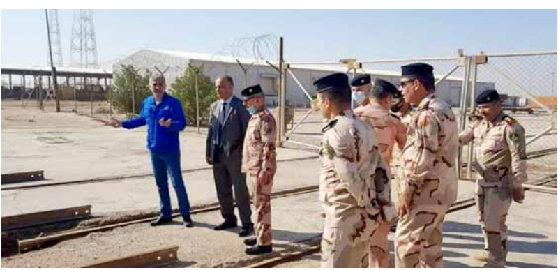
اطلاع؛ وقد وزارة الدفاع يطلع على امكانيات شركة ابن ماجد

للتاهيل ورفع الكلف لوزارة الدفاع . واعلنت الشركة العامة للانظمة