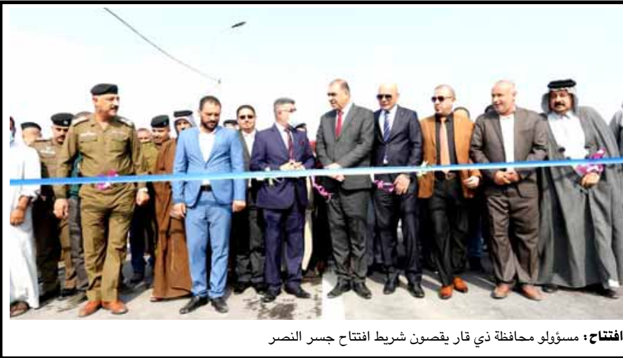
افتتاح ٠ مسؤولو محافظة ذي قار يقصون شريط افتتاح جسر النصر