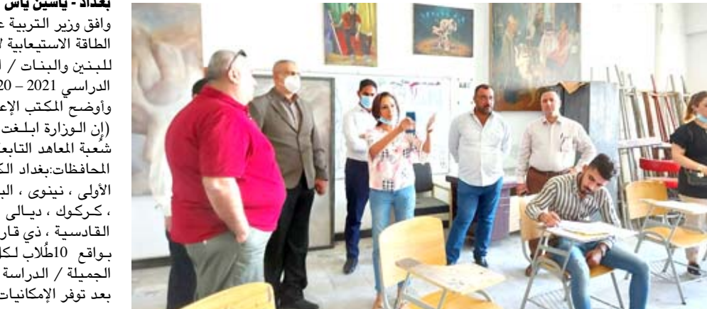
الطالبة في مرحلة الإختبار

بغداد - ياسين ياس وافق وزير التربية علي حميد الديلمي على زيادة الطاقة الاستيعابية لأقسام معاهد الفنون الجميلة للبنين والبنات / الدراسة الصباحية ، للعام الدراسي 2021 – 2020 . وأوضح المكتب الإعلامي للوزارة في بيان أمس (إن الوزارة ابلغت أقسام الأعداد والتدريب / شعبة المعاهد التابعة للمديريات العامة للتربية في المحافظات ببغداد الكرخ الأولى والثالثة ، والرصافة الأولى ، نينوى ، البصرة ، الأنبار ، صلاح الدين ، كركوك ، ديالى ، واسط ، النجف الأشرف ، القادسية ، ذي قار، بزيادة الطاقة الاستيعابية بواقع 10أطلاب لكل قسم في معاهد الفنون الجميلة / الدراسة الصباحية ، على أن يتم ذلك بعد توفر الإمكانيات اللوجستية المتمثلة بالاقاعات الدراسية و الملاكات التدريسية فضلاً عن الأثاث المدرسي).