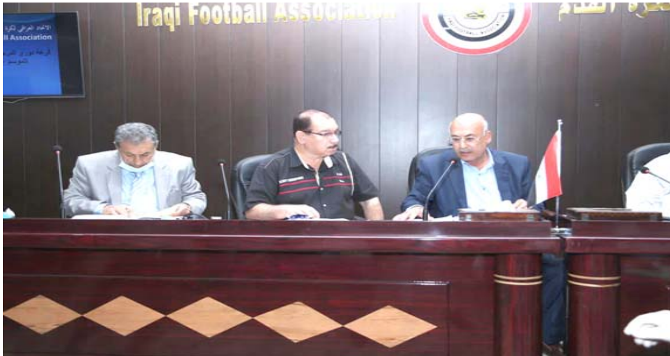
قرعة : وقائع قرعة دوري الدرجة الأولى لكرة القدم