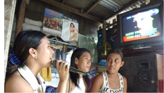
الفلبينيون يفضلون آلات الكاريوكي عند الغناء، وغالباً ما يتم استخدامها في الحفلات، كسما أن سواوي الكاريوكي، التي أغلقت كجزء من إجراءات الإغلاق منذ آذار الماضي، تحظى بشعبية كبيرة في الفيلبين.