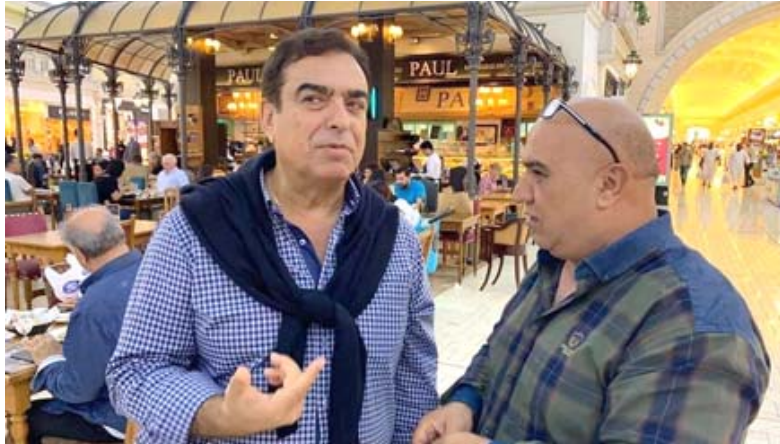
جورج قرداحي وعلي كاظم

بلاد الشام ، اعتقد صار تسرع في وقف عقدي مع قناة (ام بي سي) لأنه بعد سنوات قليلة الذين وقفوا ضد كلامي تبين لهم صحة كلامي ومخاوفي من أحداث سوريا بعد عام 2011 حتى من كان ضدي في المعارضة السورية قالوا مادي كبير لكني رحبت ليس نفسي فقط وإنما رحبت احترام كل الناس لأن ما حدث على ارض الواقع في سوريا كانت أعمال إرهابية وقتل وتدمير خلال السنوات الماضية. □ (الاختلاف في الرأي إيليس في الود قضية) اعتقد كل رأي آخر معايير لهذه المقلدة؟ □ بالأسفة في هذا القول صحيح واحترم آراء من يخالفني لكن التعامل معي أثبت العكس حيث أفسدوا الود واتخذوا موقفاً ضدي وتساؤوا ما قمت به من عمل إيجابي وعطاء في القناة التي عمل بها حتى أنهم تجاهلوا الود الذي بيننا وبينهم الذي كنت أحمله لهم ، واعتقد من كان وراء هذا القرار محرضون جاءوا من وطني لبنان والحمد لله انقضت الغيمة بيني وبين الأضواء من حقي أن اعبر عن رأي المحرضين كانوا مغرضين .