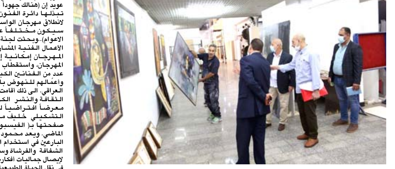
تواصل الإستعدادات للمهرجان.

وتحتضن دائرة الفنون العامة في 28 تشرين الثاني الحالي مهرجان الواسطي السنوي بدورته 13 والتي تشمل فنون الرسم والنحت والخزف والكرافيك وخلال اجتماعه مع لجنة