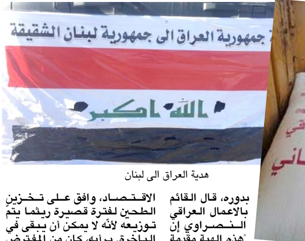
هدية العراق الى لبنان

بذوره، قال القائم بالعمل العراقي النصاروي إن هذه الهدية مقدمة إلى أشقائنا اللبنانيين بمناسبة ما لها من أثر معنوي على لبنان ومرقا بيروت، لتجاوز الصعاب بعد الكارثة الكبيرة، وهي مقرة كمساعدة أنية .