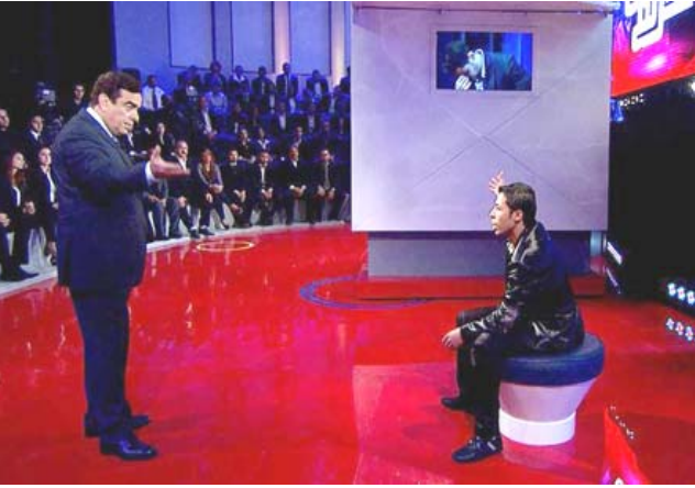
مشهد من برنامج (المسامح كريم)