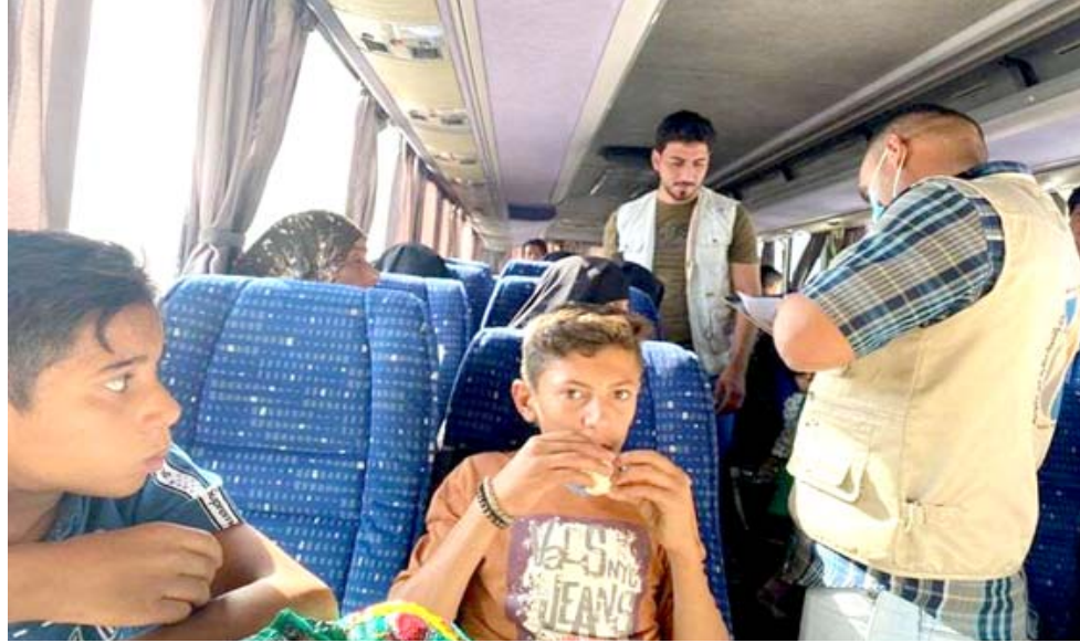
مقل؛ حافلات تنقل عوائل من الانبار الى ديارها

تذليل الصعاب أمام القضايا والهموم المختلفة لإملها من أجل حسم المسائل العالقة، وضمان حماية أمن وحقوق المواطنين، وتوفير المتطلبات العيشية لهم، من جانبه، قدم الوفد شكره وتقديره لرئيس الجمهورية، على حرصه ومتابعته المتواصلة لأوضاع المدينة وإهلها، حيث فتموا دوره الكبير في التعامل مع التحديات والمسائل التي تواجه المدينة وأهلها وضمان الاستقرار فيها .