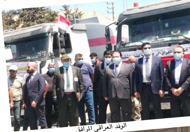
الوفد العراقي المرافق