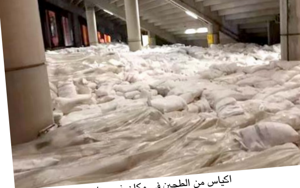
اكياس من الطحين في مكان غير مناسب

الطحين من المساعدات المرسله من العراق في مستودعات المدينة الرياضية، بشكل سيئ أسفل المدرجات وفي القاعات السفلية ويجري الان التحقيق لتحديد مصير هديتنا هل بقي منها ما هو سليم ام يجب ان كله؟