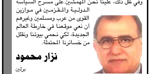
نزار محمود برلين

الشيابة كانت صياداً مختصراً، وهي تشمل طرف ربح حجري وسكيناً وحجارة لتمزيق الحيوانات وسلخها. وكانت هذه الأدوات توضع في حاوية مصنوعة من مواد زائفة، كاتكاس الجلد. وقد استخدمت الصيادات دبليو أم بي 6 أدوات فتح لها زيادة السرعة والمسافة التي يمكن بلوغها لاصطياد الطرائد. ولعرة هل كانت هذه الشيابة حالة استثنائية، درس الباحثون 429 هيكل عظمي مدفوناً في 107 مواقع في القارة يعون تاريخها إلى فترات تراوح بين 14 ألف سنة و 11 ألفاً. وقد عثروا على 27 دفناً تمكنتوا من تحديد جنسهم بصورة موثوقة وكانت أضرحتهم تضم أدوات صيد. وهؤلاء كانوا 16 رجلاً و 11 امرأة. وأشار الفريق البحثي إلى أن العينة كافية للاستخلاص بأن مشاركة النساء في صيد الطرائد الكبيرة كانت أمراً طبيعياً في تلك الحقبة.