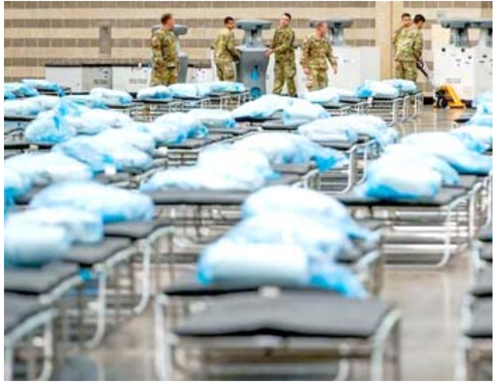
وفيات : ارتفاع اعداد الوفيات بسبب كورونا في العالم

كلوروكين لمعالجة المصابين الجدد بكوفيد-19 أعلى الرغم من ان الدراسات اظهرت عدم جدواه وسجلت البرازيل ثاني اكبر عدد من الوفيات بفايروس كورونا في العالم بعد الولايات المتحدة بحصيلة اجمالية ناهزت 160 الفاً.