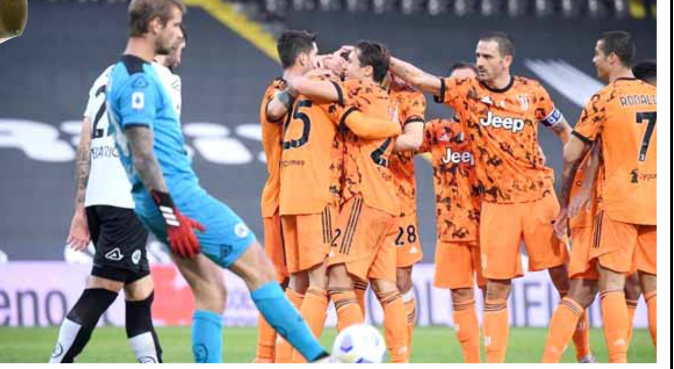
فوز: حقق فريق يوفنتوس فوزاً برباعية في الدوري الإيطالي