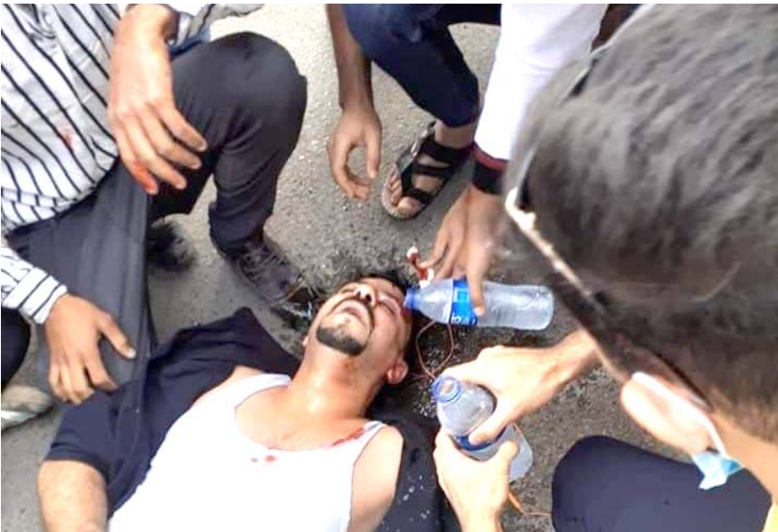
أسعافاً، متظاهرون يقدمون اسعافا اوليا لزميلهم الذي اغمي عليه في احتجاجات الباب المعظم

خلال انتفاضة تشرين التي انطلقت قبل عام، وفي محافظة بابل تظاهر عشرات الطلبة رافعين لافتات تطالب بالعدالة للمتظاهرين الذين قتلوا أو خطفوا منذ أشهر ولا يزال مصيرهم مجهولا، وقبل اسبوع أحيا المتظاهرون الذكرى السنوية الأولى لتورة تشرين ما عقب ذلك عمليات شغب دعت المتظاهرين إلى اتخاذ قرار رفع الخيام بسبب الإحداث، وبعد ما شارك الآلاف في تظاهرات شهدتها مدن عراقية عدة، هدأت الامور واعادت السلطات فتح الساحات والجسور المحفلة منذ عام، أمام حركة المرور، ولكن بحسب شهود عيان (ما زالت المنطفة الخضراء من جهة العراوي مغلقة وان هناك عدد من الحواجز الكونكريتية موجودة على جسر الكونكريتية التي شرعت القوات الامنية الناصر الطرفي أحد أبرز شيوخ العشائرات المؤيدين للإحتجاجات).