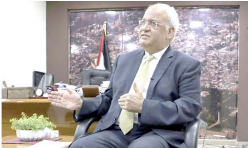
صورة أرشيفية لأمين سر منظمة التحرير الفلسطينية صائب عريقات

القدس، (أ ف ب) - أعلن مستشفى همداسا عين كارم الإسرائيلي في القدس تدهور صحة أمين سر منظمة التحرير الفلسطينية صائب عريقات الذي أصيب مؤخرا بفيروس كورونا المستجد، واصفا حالته بأنها "حرجة". وقال المستشفى في بيان قضى السيد عريقات ليلة هادئة ولكن طرأ هذا الصباح تدهور في حالته يصنف بأنه حرج، سبب ضيق تنفس وأصاف البيان أنه تم إعاشته وتقومه.