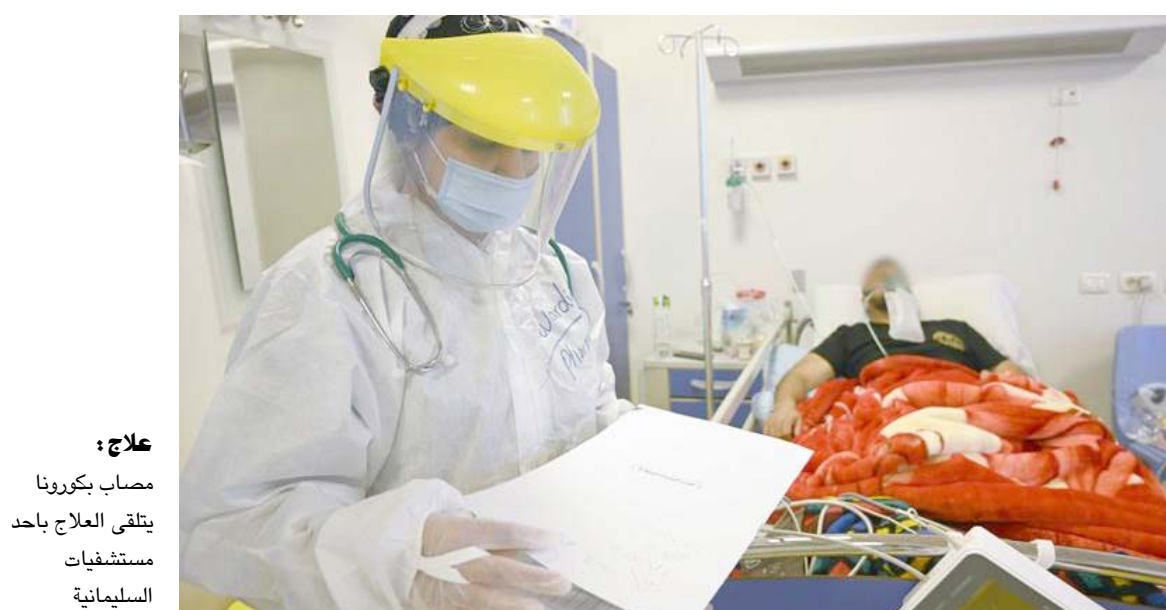
علاج : مصاب بكورونا يتلقى العلاج باحد مستشفيات السليمانية

للغايروس ، واحصي أكثر من 250 ألف وفاة جراء الغايروس الفتاك في أوروبا، لكن الأزمة المتصاعدة تتناقض مع الوضع في استراليا حيث خففت مليونين ثاني كبرى مدن البلاد من القيود الصارمة المفروضة التي أبتت ملايين الأشخاص في بيوتهم لشهور وسيتعين إغلاق كل المقاهي والمطاعم في بلجيكا لشهر على الأقل، وتجاوزت هذه الدولة مؤخراً عتبة مئتي ألف إصابة، بعدما تجاوزت عتبة مئة ألف في 20 أيلول الماضي. ويأتي ذلك في أعقاب أسبوع شهيد ازدياداً في الإصابات في القارة الأوروبية بنسبة 44 بالمئة مقارنة بالأسبوع السابق. لكن هذه الخطوة أثارت رد فعل عنيفاً من قطاع الأعمال رغم تحذير السلطات من أن المملكة البالغ عدد سكانها 11, 5 مليون نسمة تشهد زيادة متسارعة للإصابات. وقال مدير مطعم في بروكسل أنجيلو بوسي (نحن