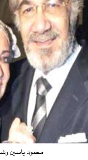
محمود ياسين وشهيرة

غيب الموت في الساعات الأولى من صباح امس الأربعاء الفنان المصري، محمود ياسين، بعد صراع طويل مع المرض عن عمر ناهز 79 عاماً. وأعلن ابنه الممثل الشاب عمرو وفاة والده عبر حسابه على (فيسبوك) قائلاً (توفي إلى رحمة الله تعالى والذي الفنان محمود ياسين إننا لله وإننا إليه راجعون أسألكم الدعاء) فيما عبرت الفنانة شهيرة عن حزنها الكبير لوداع زوجها النجم الراحل محمود ياسين، الذي رحل عن دنيانا اليوم بعد صراع مع المرض، ونشرت شهيرة صورة على (فيسبوك) لزوجها الراحل، معلقة عليها (رحل حبيب عمري خلاص). ولد محمود فؤاد محمود ياسين في مدينة بورسعيد عام 1941 وتعلق بالمسرح منذ أن كان في المرحلة الإعدادية من خلال