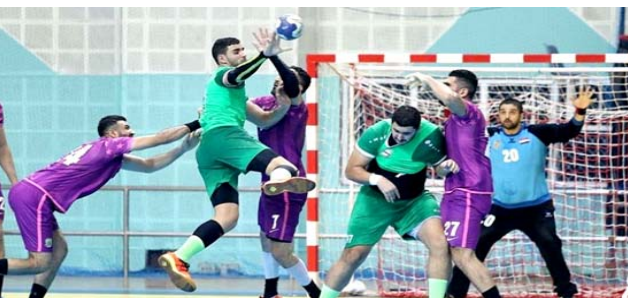
أحدى منافسات كرة اليد المحلية