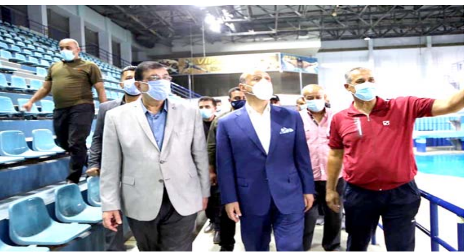
تطوير؛ وزير الشباب يسعى الى تطوير قدرات التدريب في اتحاد السباحة