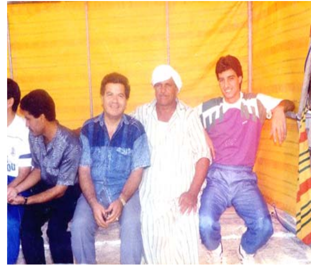
مبدع راحل : فاضل خليل في مشاهد من أعماله المتميزة