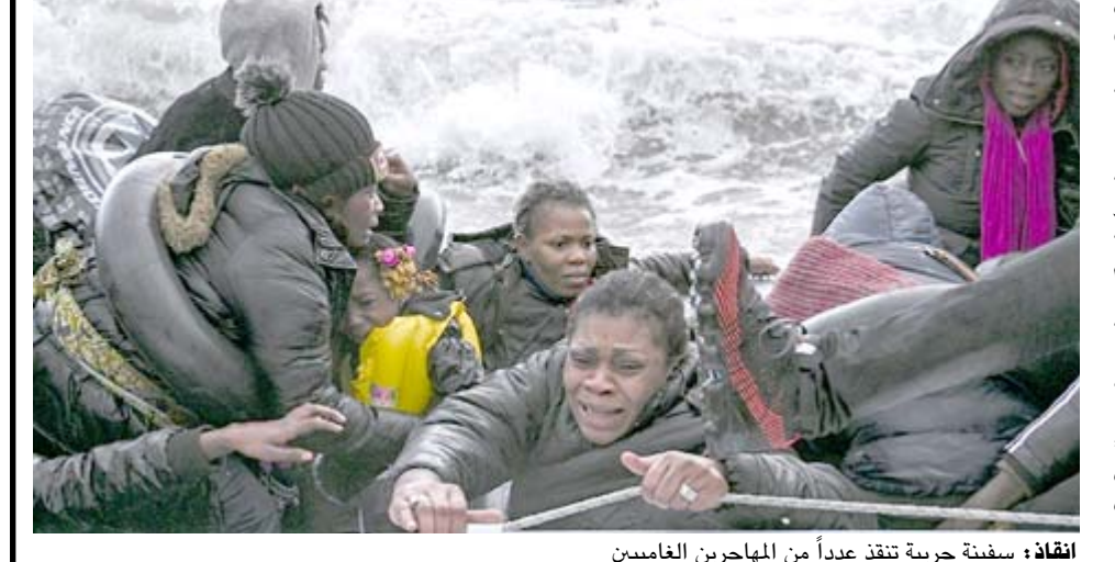
انقاذ: سفينة حربية تنقذ عدداً من المهاجرين الغامبيين