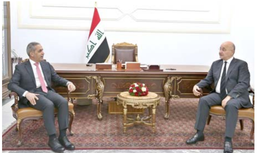
لقاء : رئيس الجمهورية برهم صالح خلال لقائه رئيس مجلس القضاء الاعلى فائق زيدان

مطلوبين والتخري عن اوكار داعش. وقال اللواء يحيى رسول في بيان تلقته (الزمان) امس ان (ابطال قيادة عمليات الجزيرة وضمن عملية اسود الجزيرة رقم واحد التي انطلقت لتهجير صحراء الجزيرة شمال نهر الفرات غرب العراق وخمسة محاور وإسناد من طيران الجيش تمكنا من تفجير 16عبوة ناسفة من مخلفات داعش وتدمير وحرق 7 مضافات ونفق كانت تستخدمها الجماعات الإرهابية). وفي النجف ، اعلنت مديرية الدفاع المدني في المحافظة العثور على قذيفتي هاون وقذيفة مدفع خلف المواكب الحسينية بطريق نجف كربلاء .