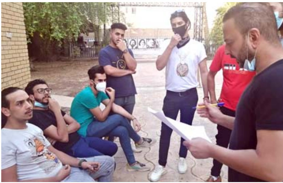
موسم : نشاطات منتدى المسرح في موسمه للعام الجاري تضمن ورش شبابية لاكتشاف المواهب