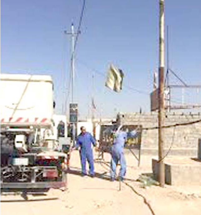
صيانة ملاكات كهرباء كربلاء تواصل صيانة خطوط نقل الطاقة

اعلامي خلال زيارة الاربعيين ويكون مقره في بلدية كربلاء وستكون مهمته نقل نشاطات الاعلاميين والصحفيين سواء كانت قنساء تلفزيونية ام صحفا .