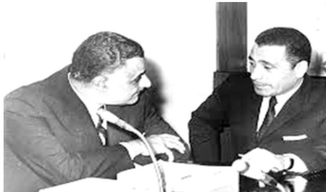
هيكل مع جمال عبد الناصر

هيكل بعد الأهرام لكنه ظل يكتب ويمارس العمل الصحفي ويؤلف كتباً أصبحت من مصادر التاريخ المصري ومنها مؤلفاته باللغة العربية 27 كتاباً إضافة إلى 5 مجلدات من القطع الكبيرتضمن مقالاته