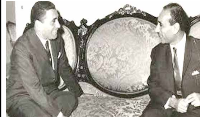
هيكل مع عبد السلام عارف

وظل رئيساً لتحرير جريدة الأهرام 17 سنة، وفي تلك الفترة وصلت الأهرام إلى أن تصبح واحدة من الصحف العشرة الأولى في العالم. وكانت له مكانة متميزة عند الرئيس جمال عبد الناصر الذي عينه عام 1970 وزيراً للإرشاد القومي، ولأن عبد الناصر تربطه مع هيكل صداقة بين رجل دولة وبين صحفي متمسك بمهنة الصحافة، فإن المرسوم الذي عينه وزيراً للإرشاد القومي نص في نفس الوقت على استمراره في عمله الصحفي كرئيس لتحرير الأهرام.