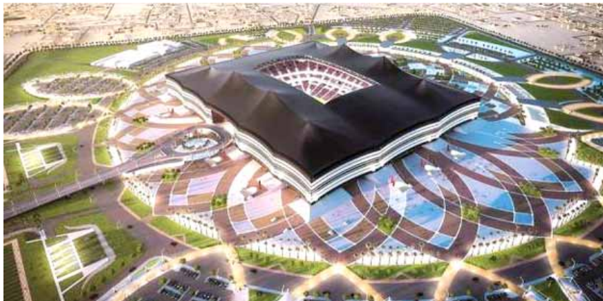
جانب من إحدى ملاعب قطر لاستضافة المونديال

بغداد - الزمان تواصل اللجنة العليا للمشاريع والإرث جهودها الرامية إلى تنظيم نسخة محايدة الكربون من بطولة كأس العالم FIFA في قطر عام 2022 بما يترك إرثاً مستداماً على صعيد المناخ لدولة قطر والمنطقة، حيث تاتي الاستدامة في صدارة استعدادات البلاد لتنظيم المونديال للمرة الأولى في العالم العربي والشرق الأوسط. وفي سبيل تحقيق هذا الهدف يجب الوصول بالانبعاثات الكربونية إلى مستوى الصفر، وذلك عبر خفضها إلى أقل مستوى ممكن، قبل موازنة القدر المتبقي