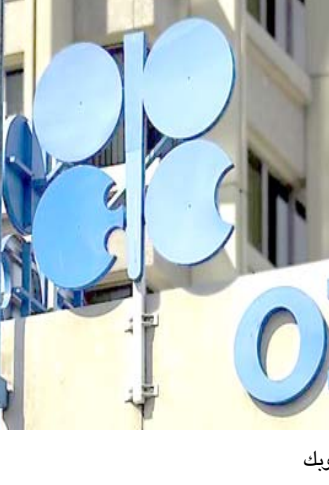
شعار منظمة اوبك

بغداد- قصي منذر اعلنت منظمة اوبك، ان العراق جاء بالمرتبة الاولى بين الدول الاكثر تخفيضاً للإنتاج النفطي داخل المنظمة لشهر اب الماضي،وقالت المنظمة في وثيقة داخلية طلعت عليها (الزمن) امس ان (العراق كان أكثر الدول