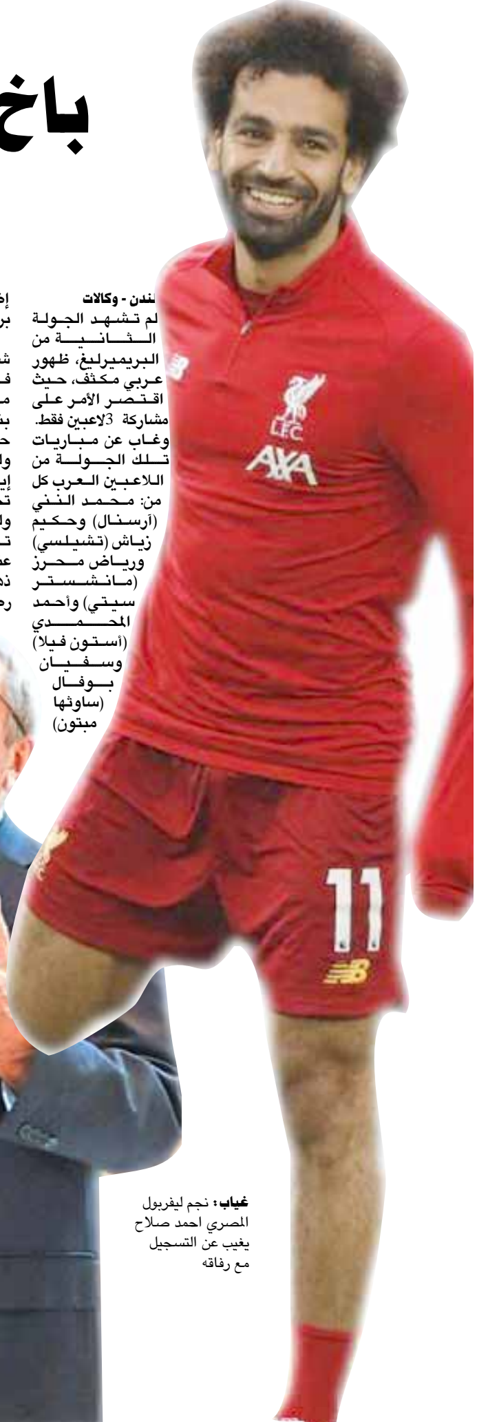
غيباب، نجم ليفربول المصري أحمد صلاح يحيى عن التسجيل مع رفاقه

نندن - وكالات لم تشهد الجولة الثانية من البريميرليغ، ظهور عربي مكثف، حيث اقتصر الأمر على مشاركة 3 لاعبين فقط. وغاب عن مباريات تلك الجولة من اللاعبين العرب كل من محمد النني (ارسنال) وحكيم زياش (تشيلسي) ورياض محرز (مانشستر سيتي) وأحمد السعيد (استون فيلا) وسفيان بوفال (ساوثهامبتون) ميتون) إضافة إلى أحمد حجازي (وست بروميتش). شارك المدافع المغربي في خسارة فريقيه وولفرهامبتون أمام مانشستر سيتي أمس الإثنين، بنتيجة 3-1 على ملعب مولينيو، حيث خاض المباراة بالكامل، ولكنه لم يتمكن رفقة زملائه من إيقاف زحف رجال بيب جوارديولا تجاه مرماهم. ولم يتمكن وولفرهامبتون من تكرار نتائج الموسم الماضي، عندما تغلب على مانشستر سيتي ذهاباً وإياباً في الدوري، ليتجمد رصيد النشاب عند 3 نقاط في المركز 12 في الوقت الذي حصد فيه السبتي 3 نقاطه هذا الموسم بعد غيابه عن الجولة الأولى للحصول