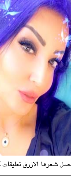
صورة سمية الخشاب التي نشرتها وحصل شعرها الأزرق تعليقات كثيرة

القاهرة - الزمان نشرت الممثلة المصرية سمية الخشاب عبر صفحتها الخاصة على أحد مواقع التواصل الاجتماعي صورة عفوية لها، ظهرت فيها بلون شعر أزرق مع بعض الفراشات المستخدمة إحدى التطبيقات، وعلقت بالبقول (شعر) أزرق لا تهتموا، وتفاعل المتابعون مع الصورة بشكل كبير، إذ أثنوا على جمالها وكيفما كانت.