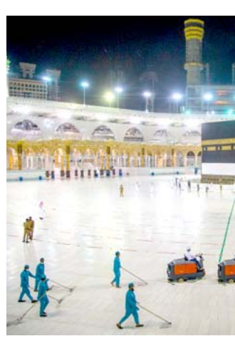
تنظيف: عمليات غسل الحرم المكي الشريف مستمرة استعداد للعمرة

وقالت وزارة الداخلية السعودية في بيان اوردته وكالة الأنباء الرسمية واس ان السماح بأداء العمرة والزيارة سيتم على اربع مراحل تبدأ (اولها في 4 تشرين الاول حين سيُسمح للمواطنين والمقيمين في المملكة بأداء العمرة وذلك بنسبة 100 بالمئة من الطاقة استيعابية التي تراعي الإجراءات الاحترازية الصحية للحد من تفشي الجائحة. وحينئذ سترفع النسبة إلى 100 بالمئة من الطاقة الاستيعابية الطبيعية للحرمين الشريفين. ولفت البيان إلى ان قدوم المعتزين والزوار من خارج المملكة سيتم بشكل تدريجي، ومن الدول التي تقرر وزارة الصحة عدم وجود مخاطر صحية فيها تتعلق بجائحة