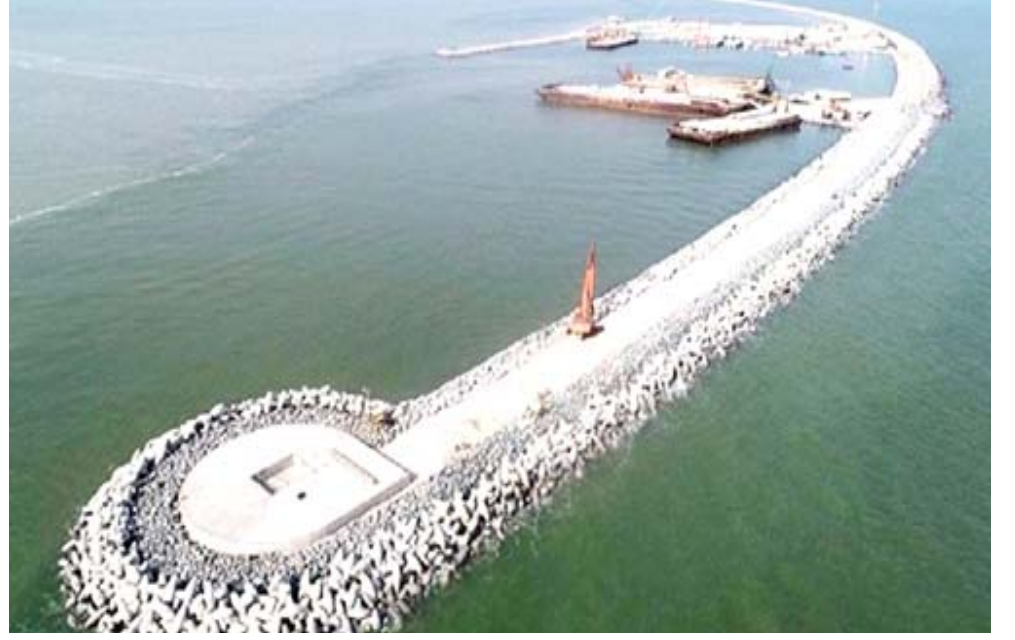
ميناء فاو: منظر علوي لمرحل العمل في ميناء الفاو الكبير