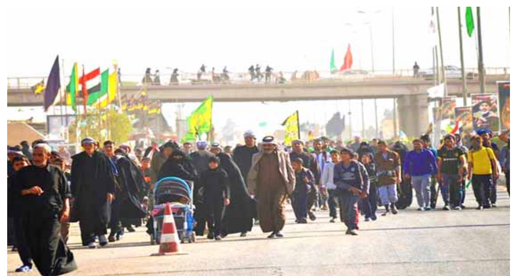
زيارة: الالف زوار يتجهون مشياً الى كربلاء