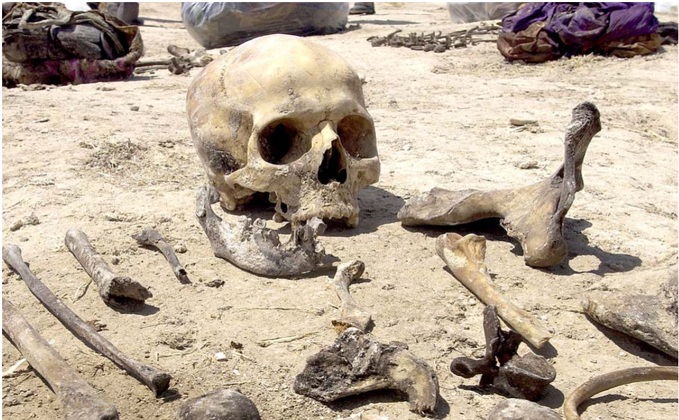
رفات؛ بقايا رفات في مقبرة جماعية

اشباح اللادولة وما يلحقهم من مافيات فساد ودولة عميقة، وهم يتبارون على وضع (بالاتهم ولتكاثرهم) على شماغة أمريكا الشبطنان الأحمر وإسرائيل الشبطنان الأصفر، وقد اضافوا إليها مؤخرًا (الافصاليون المنحرفون) واليهود من عراقيين، واليهود من عراقيين، والشعبوية التي اندوسها في منظومة الانابب الماكلة للثقافة ومشتقاته والمهرية الى ايران وسوريا، ناهيك ما يجوده من استعمار في شعاراتهم الطائفية والخصمية المقيئة ضد الإقليم وضد كل من يختلف معهم حتى في اغنية: لقد تجاوزوا الاسطه في صنعتهم واستحووا ان يكونوا ردة أولك الذين اتهموا شلة من المهريين الامين والهاريين من العسكرية الذين اغتالوا القائم مقام واعتبروهم عمالاً للشركات النفطية وجواسيس الامبريالية الصهيونية منذ نصف قرن، ولإساق المسيرة هي لم تغيرت الا بالالوان وبعض العناوين، في خطاب اعلامي باتس وفكر طائفي وسياسي أكثر بؤساً، في بلاد ما تزال معلقة على شماغة العمالة لإسرائيل وأمريكا، والغريب انهم لا يفتقروا ما جرى لاجلهم من نهبهايات التي رسمتها اعواد المشائق ورضاصات الاعدام من الزعيم وحتى القائد الضرورة؛