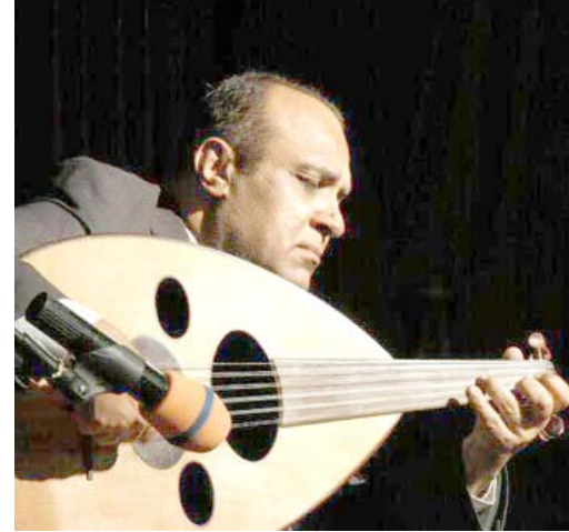
ابتهالات دينية على خشبة الرباط

استشهاد الإمام الحسين (ع) وشهداء معركة الحنف، بالابتهالات الدينية التي قدمتها الفرقة المركزية