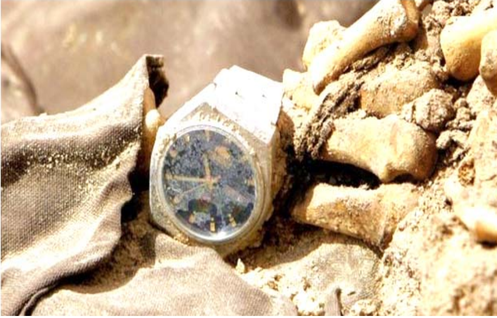
مقابر؛ ساحة أحد ضحايا القابري الجماعية

المرصاح عليها، وهم لا يعلمون من في داخلها غير الشرطة، وقد قُتل الرجل وأصيب آخرون من مرافقيه بجروح، وراح ضحية الزيارة غير موفقة وعلى ايدي اناس ولكن بلوس يعني هذه اكرة حيث تصفي الجيوب من الشوافي! وانا اكتب هذه السطور منذرا كل هذه الاحداث توقفت عند حدث اخصر لي كل ما حصل في عراق ما بعد 1958 افي شكله السياسي والإعلامي والاجتماعي، فقبل نصف قرن تقريبا، قُتل قائممقام قضاء سنجار في شمال غرب العراق على ايدي مهريين وهاريين من الخدمة الإلزامية حينذاك، فلما منهم انه أحد أفراد الشرطة التي تخابيحهم، خاصة وانه كان مستقل سيراتهم المرورة في حينها ب (المسلحة)، وحينما اقتربت من مكان تواجدهم في جبل سنجار، ورغم ان قائممقام لم يكن في تلك الحادثة بمهمة رسمية، بل كان في زيارة تفقدية للمنطقة إلا انه وحينما اقتربت السيارة التي نقله من مكان تجمعهم اطلقوا