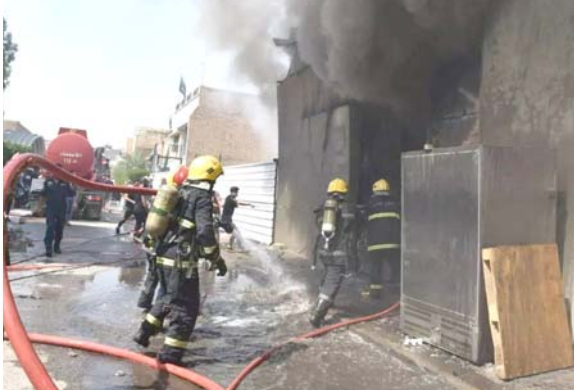
بغداد - قصي منذر

كافحت فرق الدفاع المدني حريقين في منطقة الكرادة. وقال مصدر في تصريح أمس إن (حريقين اندلعا داخل مخازن للمواد الكهربائية في منطقة الكرادة)، مؤكداً أن (20 فرقة إطفاء وإنقاذ تشارك في إخماد الحريقين). واندلع حريق آخر داخل بناية سكنية في منطقة الكرادة في بغداد.