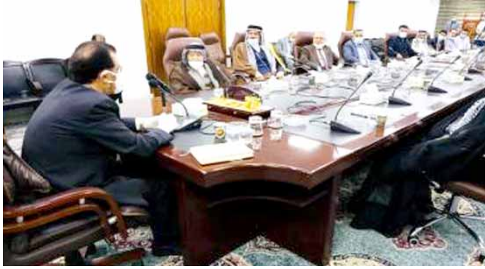
لقاء وزير الزراعة خلال لقائه مزارعي ديالى