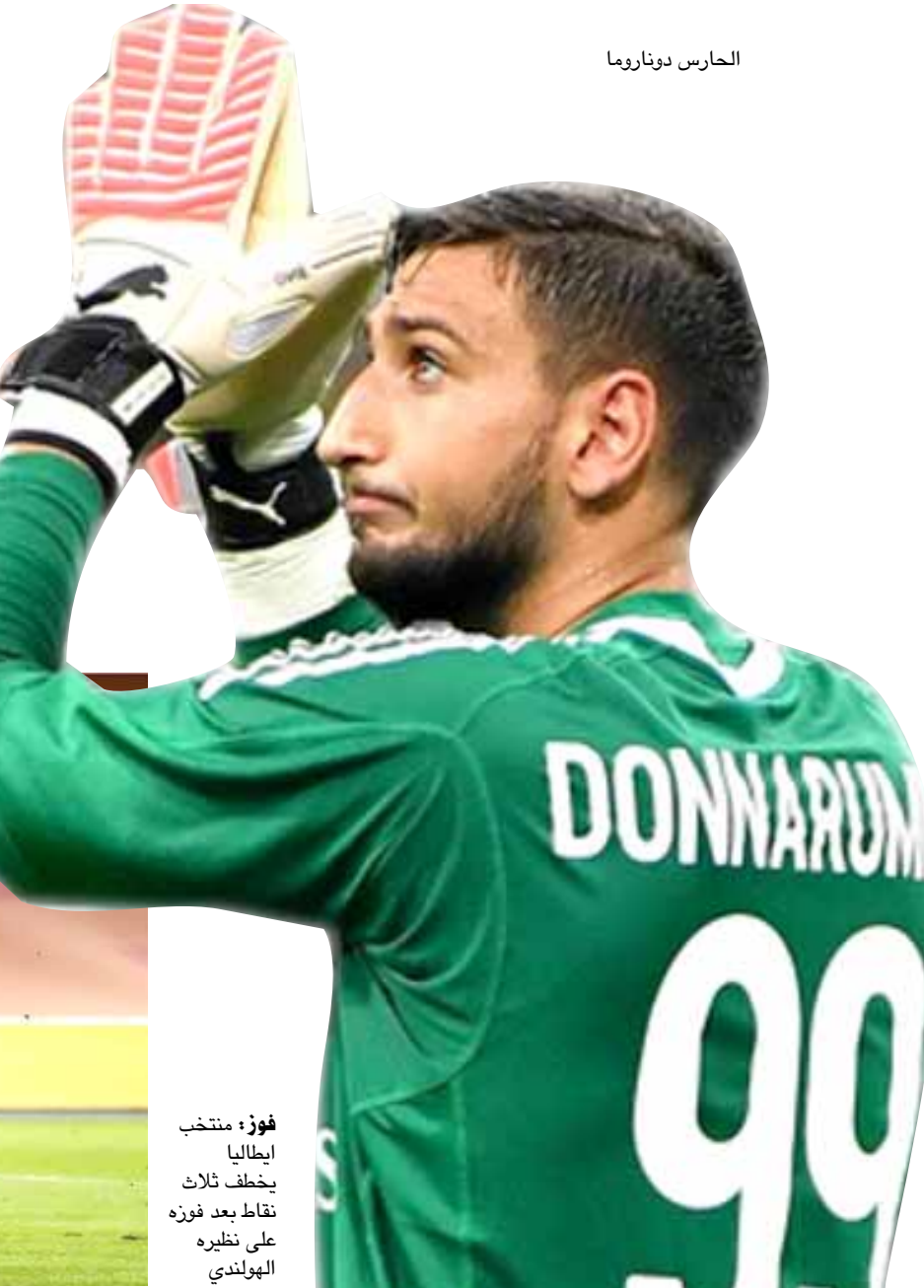
فوز: منتخب إيطاليا يخطف ثلاث نقاط بعد فوزه على نظيره الهولندي