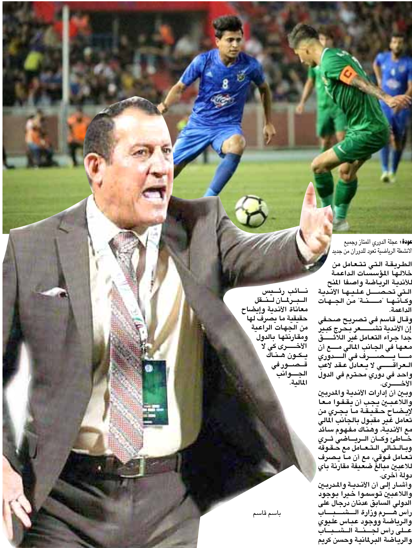
عودة: عجلة الدوري الممتاز يجمع الأنشطة الرياضية تعود للدرجال من جديد

وفي سياق منفصل أكدت لجنة الشباب والرياضة النيابية أنها ستعد لقاءات مع الجهات المعنية بشأن قانون الأندية الرياضية. وأكمل البرلمان القراءة الثانية لقانون الأندية الرياضية في جلسته . وقال قاسم في تصريح صحفي إن الأندية تشجع بخرج كبير جدا جراء التعامل غير اللائق معها في الجانب المالي مع ان ما يصرف في الجانب المالي لا يعادل عقد لاعب واحد في دوري محترم في الدول الأخرى. وبيّن ان إدارات الأندية والمدربين واللاعبين يجب أن يفقوا معا لإيضاح حقيقة ما يجري من تعامل غير مقبول بالجانب المالي مع الأندية. وهناك مفهوم سائد خاطئ وكان الرياضي ثري وبالعكس الأندية تتعامل مع حقوقه لا يعين مبالغ ضعيفة مقارنة بأي دولة أخرى. وأشار إلى ان الأندية والمدربين واللاعبين توسموا خيرا بوجود الدولي السابق عدنان درجال على رأس هرم وزارة الشباب والرياضة ووجود عباس عليوي على رأس لجنة الشباب والرياضة البرلمانية وحسن كريم