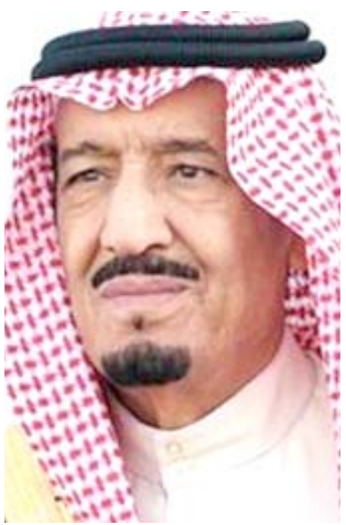
سلمان بن عبد العزيز