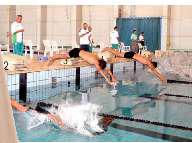
احدى منافسات السباحة المحلية