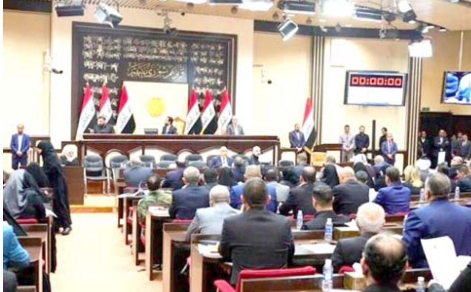
جلسة: جانب من جلسة مجلس النواب الاخيرة برئاسة محمد الحلبيوسي

(وهناك) إجراءات تشريعية يمرّ خلالها (القانون). وفي لقاء أضحى الحلبيوسي ان (امام البرهان) جملة من الامور في مقدمتها (الانتخابات) والقانون المحكم (ومن حق اي طرف تقديم التعديل على القانون سواء كان من النواب او طرف حكومي ولم يبردا شيء وبحال ورد فلن يكون التعديل الا بعد نشر القانون في الصحيفة الرسمية).