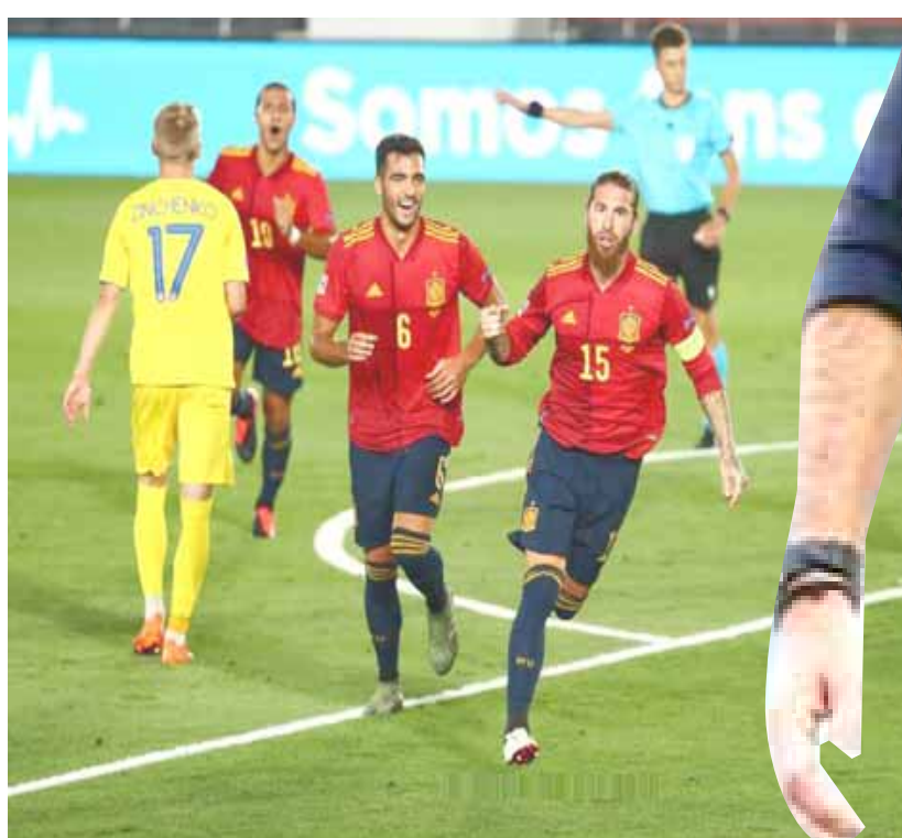
فوز؛ منتخب إسبانيا يحقق فوزاً عريضاً على نظيره الأوكراني

مدن - وكالات اكتسح منتخب إسبانيا ضيفه الأوكراني، برعاية دون رد في الجولة الثانية