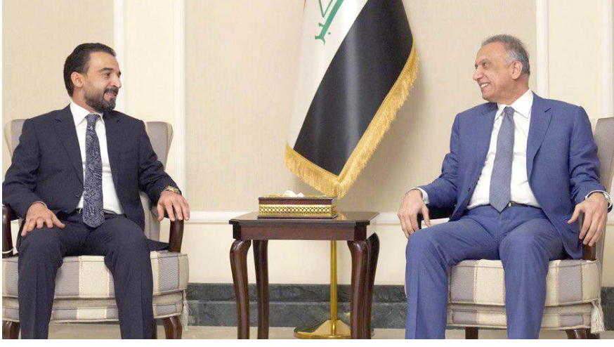
بغداد - الزمان اجتماع: رئيسا الوزراء والبرلمان في اجتماع اللجنة المالية البرلمانية مع الحكومة

تداولت تسريبات اخبارية وقائع اجتماع بين رئيس الوزراء مصطفى الكاظمي ووزير المالية والتخطيط علي علاوي وخالد خصال النجم ورئيس مجلس النواب محمد الحبوسي ورئيس اللجنة المالية هيثم الجبوري شهد مشادة شديدة بين وزير المالية ورئيس اللجنة المالية. وقالت المصادر إن (وزير المالية تجاوزت الجبوري ومجلس النواب فرد عليه الجبوري بقوة ما أدى الى إيقافه عن الاستمرار بالحدث)، مشيفة ان (الجبوري اشار الى فشل علاوي وعدم قدرته على ادارة الوزارة وعدم اجل وضع افضل السبل والركائز التي تخدم الاقتصاد الوطني)، ولفت الى ان (الجانين ناقشا مسودة الموازنة، كونها واحدة من اهم اهداف المنهاج الوزاري للحكومة، وبما يضمن مراعاة مصلحة المواطن ومستوى المعاشي). وتابع ان الاجتماع المشترك تطرق الى متابعة آخر خطوات إعداد ورقة الإصلاح الاقتصادي فضلاً عن مناقشة الاطر العامة للموازنة المقبلة. ووجه الكاظمي الجهات المعنية بتعديل التصميم الاساسي لمحافظة البصرة و إدراج مشروع قناة البصرة الانبوبي ضمن الموازنة. وذكر البيان ، ان (رئيس مجلس الوزراء، عقد اجتماعاً مع كل من وزراء النفط والإعمار والسكان والموارد المائية ومحافظ البصرة، إضافة الى عدد من المسؤولين الحكوميين، تمت خلاله مناقشة