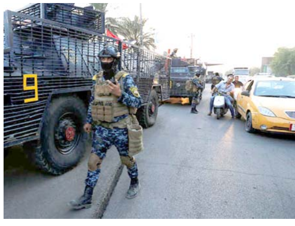
عملية : قوات أمنية في عملية البحث عن الأسلحة المنقولة في بغداد