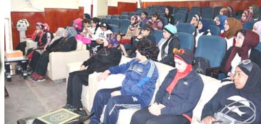
دورة: جانب من دورة تدريبية للنساء