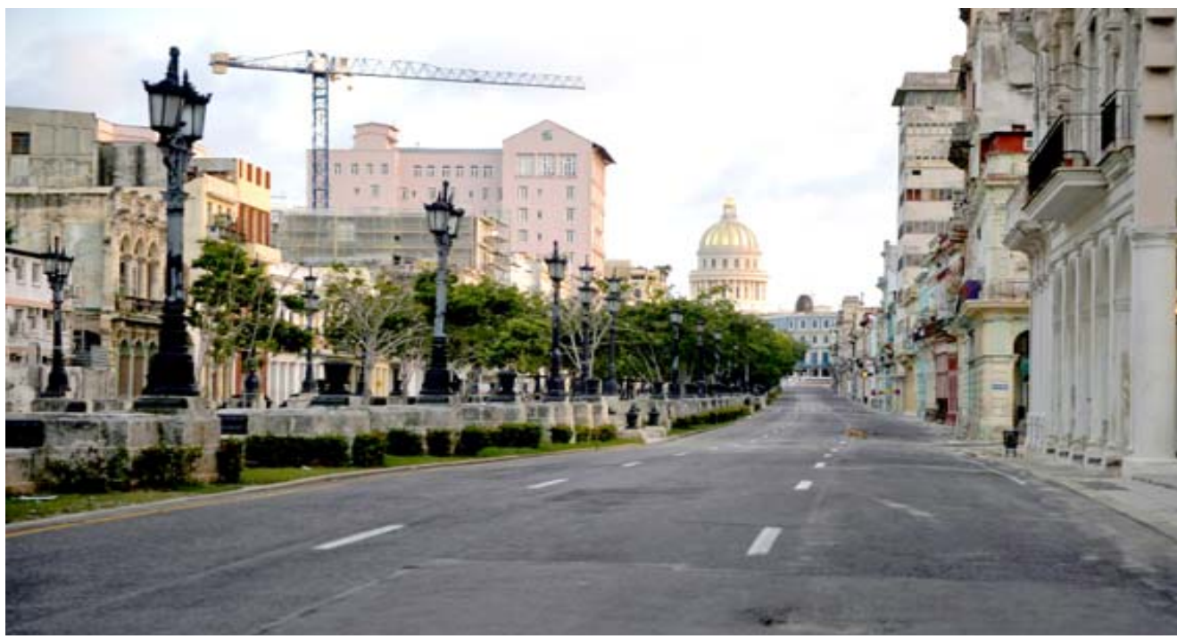
عاصمة: مشهد من العاصمة الكوبية هافانا

البرازيل (إيطاليا)، (ا ب) - افتتح أول مهرجان سينمائي بارز منذ ظهور فيروس كورونا المستجد امس الأربعاء في البندقية فيما يستمر الوباء في الانتشار بلا هوادة مع إصابة أكثر من أربعة ملايين شخص في أوروبا، وتنتقل المنافسة للحصول على الأسد الذهبي مع حضور مفتح وكاميرات حرارية في حين عاد ملايين الأطفال الأوروبيين إلى المدارس والخلافة وأضعف كمادات في ظل تدابير صحية صارمة. وقال البرتو باربييرا مدير مهرجان "لا موسسترا" السينمائي الدولي لوكالة فرانس برس "بعد أشهر من الإغلاق، علينا أن نجد الشجاعة لإعادة فتح دور السينما البدء في إنتاج أفلام جيدة مجدداً لإقناع الجمهور بان الوقت قد حان لمراجعة المنزل والذهاب إلى دور السينما". وأوضح أنه تم اتخاذ كل الإجراءات الاحترازية في مكان الحدث. ولم تكن إقامة الدورة السابعة والسبعين من أقدم المهرجانات السينمائية أصراً أكيدا في إيطاليا، وهي من الدول الأوروبية التي دفعت لمتنا باهظاً للوباء، كما أن استوديوهات الإنتاج تأثرت جدا بالأزمة الصحية. أما مهرجان كان السينمائي، وهو المنافس الرئيسي لمهرجان البندقية، فقد تم تأجيله إلى الربيع. لكن إقامة المهرجان ستكون على حساب خفض عدد الحضور وإجراء صحية صارمة. إلا أن ذلك لم يكن كافياً لإقناع والتر وهو سابق ناكسي ماتي محلي. وقال بحزن لم يتم إنتاج إلا عدد قليل من الأفلام