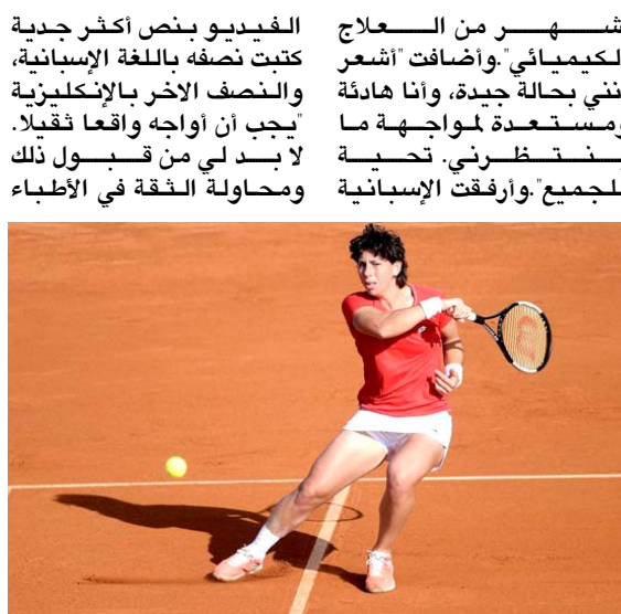
كارلا سواريز نافارو

□ باريس، (ا ف ب) - أعلنت الإسبانية كارلا سواريز نافارو التي انسحبت من بطولة الولايات المتحدة المفتوحة لكرة المضرب لأسباب طبية أنها مصابة بسرطان الغدد اللمفاوية، ما سيطلب خضوعها للعلاج الكيميائي لمدة ستة أشهر. وقالت لاعبة البالغة من العمر 31 عاماً في مقطع فيديو نُشر على حسابها على تويتر: يظهرها وهي جالسة على سرير في مستشفى "مرحباً بالجميع، أريد أن أبلغكم أنه قبل بضعة أيام، شخص الأبطاء أنني مصابة بسرطان الغدد اللمفاوية. سرطان الغدد اللمفاوية هو وحمي الذي يتطلب ستة أشهر من العلاج الكيميائي. وأضافت: "أشعر أنني بخالة جيدة، وأنا هادئة ومستعدة لمواجهة ما ينتظرني، تحية للجميع. وأرفقت الإسبانية صورة لها وهي تلعب كرة مضرب." وأضافت: "أشعر أنني بخالة جيدة، وأنا هادئة ومستعدة لمواجهة ما ينتظرني، تحية للجميع. وأرفقت الإسبانية صورة لها وهي تلعب كرة مضرب." وأضافت: "أشعر أنني بخالة جيدة، وأنا هادئة ومستعدة لمواجهة ما ينتظرني، تحية للجميع. وأرفقت الإسبانية صورة لها وهي تلعب كرة مضرب."