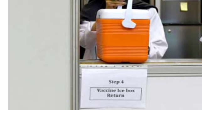
لقاح؛ ممرضة تحضر لقاحا لفيروس كورونا في النامة

المباشرة. وسجلت البحرين التي يبلغ عدد سكانها 1.5 مليون شخص، أكثر من 51500 إصابة بكوفيد-19 بما في ذلك نحو 190 حالة وفاة. وأكد محمد عبد الباقي وهو بحريني المحدود الأول من اللقاحات على مستوى العالم، ويجب ألا تحصل حفنة من الدول على كل اللقاحات التي سيتم إنتاجها في النصف الأول من العام 2021. فإنه من الضروري أن يتختم المتطوعون للدراسة. وقالت لوكالة فرانس برس "الساعات الطويلة التي أمضيها في علاج واختبار الناس في جميع أنحاء البلاد ستذهب هباءً إذا لم يكن لدينا لقاح لحمايتنا والجيل القادم". وتابعت "نشجع الجميع على البقاء بأمان وحماية أنفسهم والمشاركة في التجربة".