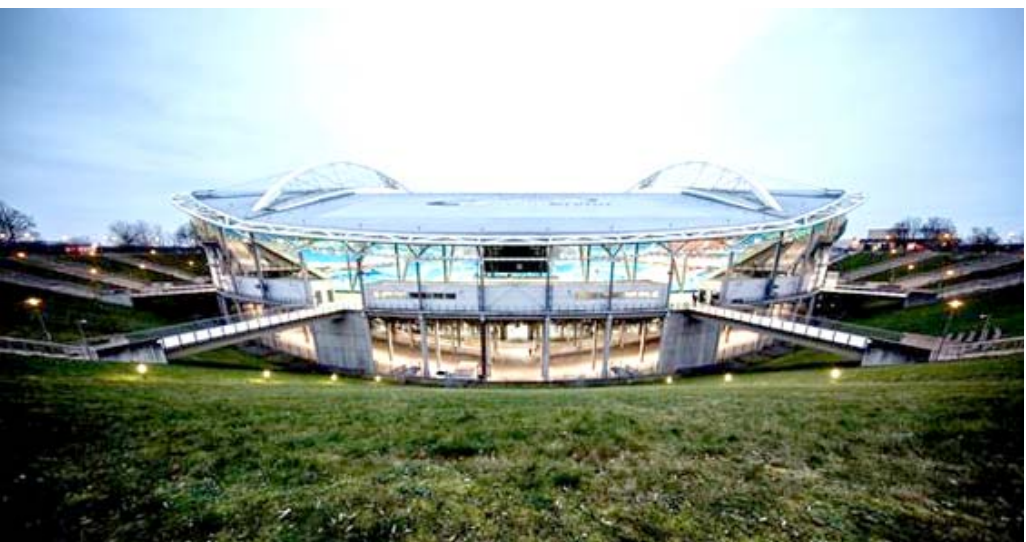
مبنى نادي لايزيرج

□ برلين، (ا ف ب) - حصل نادي لايزيرج الألماني على موافقة أولية من السلطات المحلية لاستضافة 8500 متفرج في مباراته الافتتاحية في الدوري الألماني لكرة القدم ضد