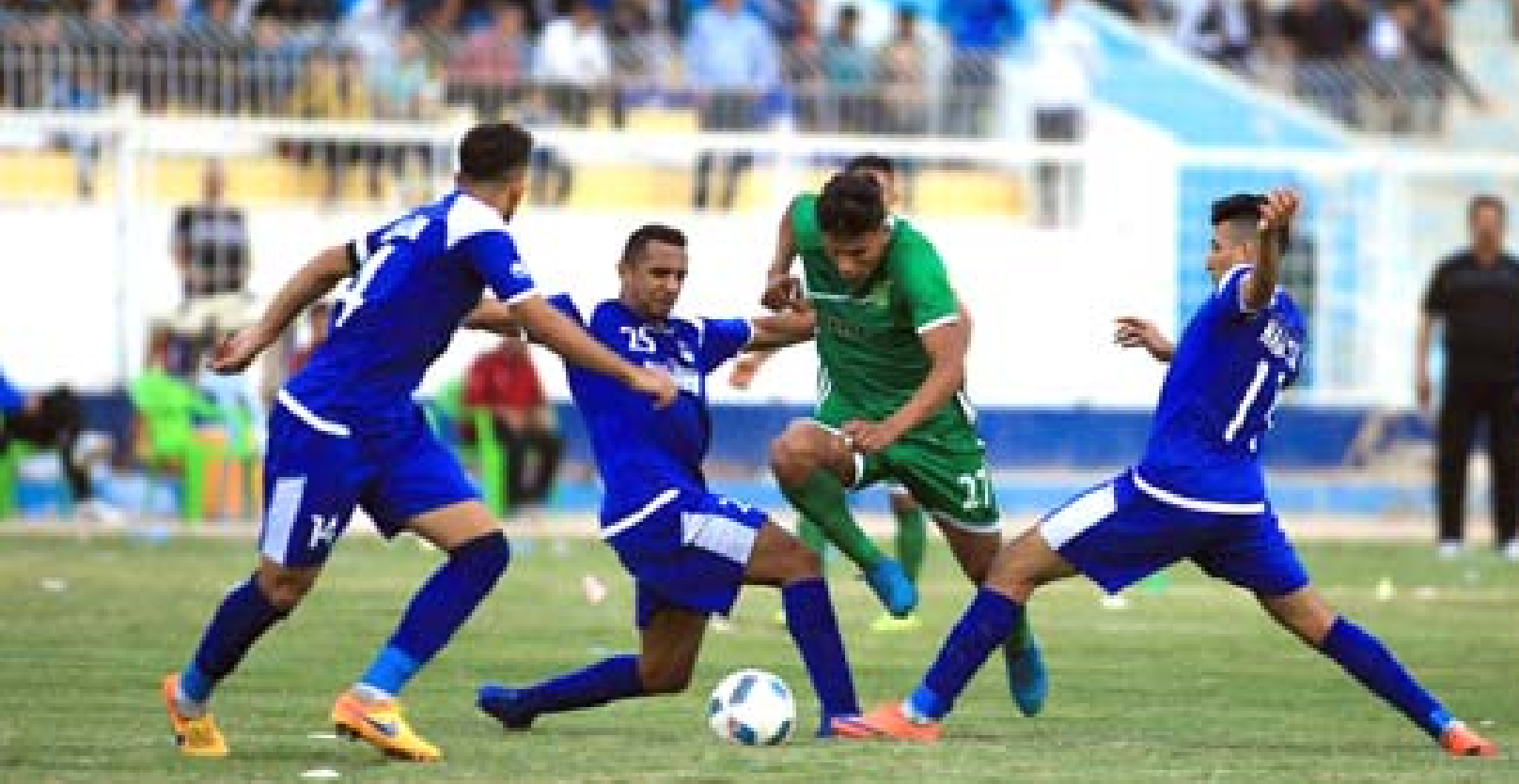
دوري: إحدى مباريات الدوري الممتاز

حيث أجهزة التعقيم ودخول الإداريين بدورات متخصصة، وذلك التحضيرات لم تشغف للأندية للحصول على الضوء الأخضر من خلية الأزمة التي بلغت بتخوفها من عودة الرياضة، بالمقابل عادة الحياة للأسواق والمجمعات التجارية ما دفع الأندية للطلب من وزير الشباب والرياضة، مخاطبة وزير الصحة لإيجاد حلاً مائلاً لبداية التدريبات.