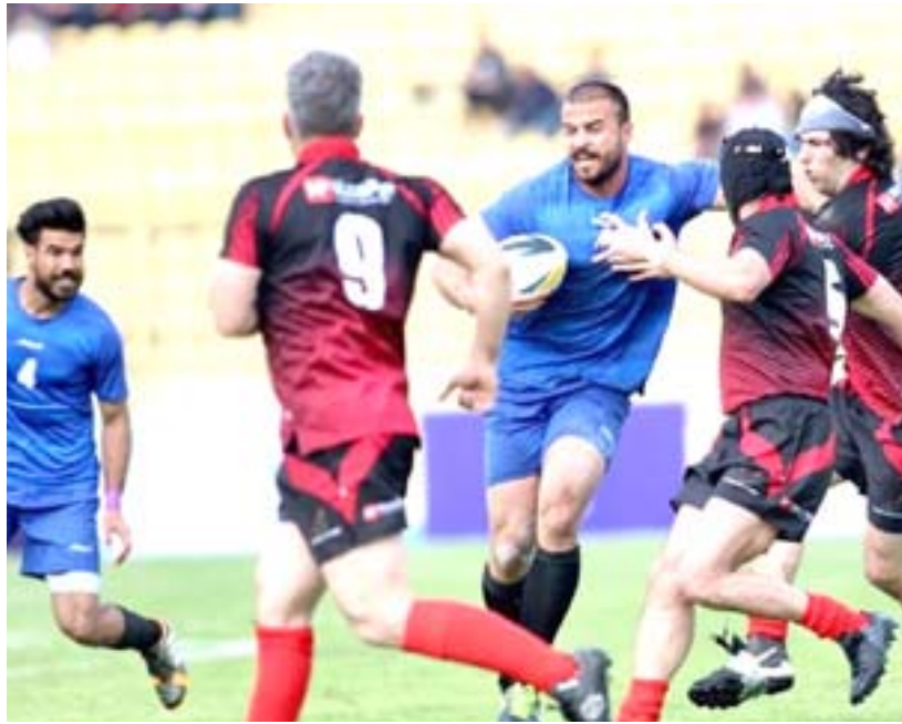
لعبية: إحدى مباريات لعبة الركبي