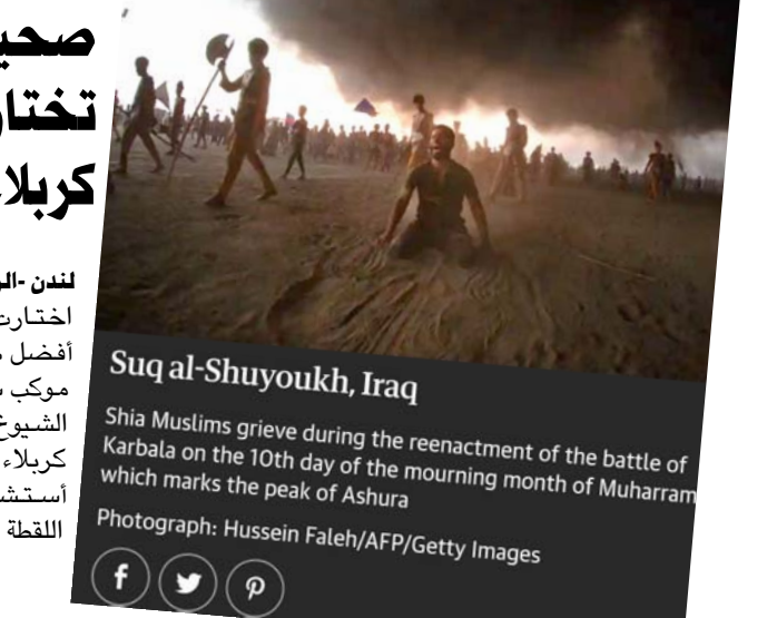
Suq al-Shuyoukh, Iraq. Shia Muslims grieve during the reenactment of the battle of Karbala on the 10th day of the mourning month of Muharram which marks the peak of Ashura.