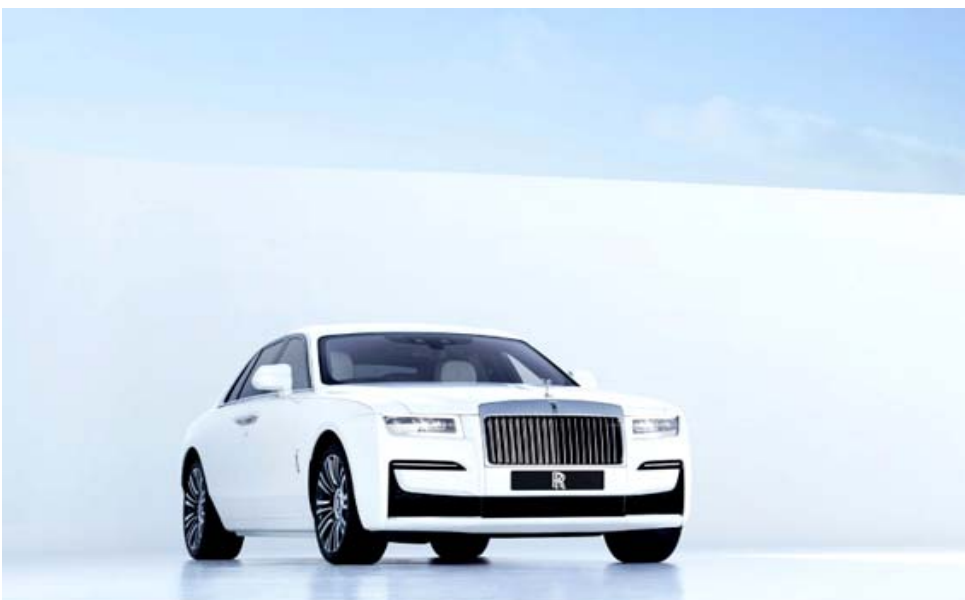
سيارة: سيارة الشبج الجديدة من رولز رويس تباع بسعر 250 ألف دولار على الأقل

لندن، (ا ب) - تعول شركة رولز رويس الشهيرة للسيارات على الطراز الجديد الذي أطلقته أمس من سياراتها الشبج "امس من سياراتها الشبج" لانعاش مبيعاتها في ظل ركود تشهد سوق السيارات بفعل جائحة كوفيد-19. سلك رئيسها توقع استمرار الأزمة، أملاً في العودة إلى الوضع الطبيعي في غضون ثلاث سنوات. وتستهدف الشركة زبائن من عالم الأعمال بسيارتها الجديدة المزودة محرك في 12 سعة 6,75 ليترات ثنائي التوربو. وقال المدير العام للشركة تورستن مولر أوتفوس في حديث هاتفى إلى وكالة فرانس برس "أعدنا إلى ماركتنا شبابها بشكل كبير في السنوات العشر الأخيرة، وبات متوسط أعمار زبائننا 43 عاماً، ويبلغ سعر السيارة الجديدة على الأقل 250 ألف يورو