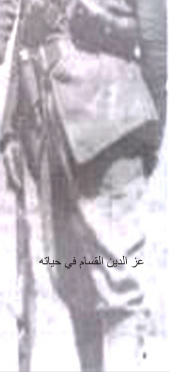
عز الدين القسام في حياته

تلقى عز الدين دراسته الابتدائية في كتائب بلديته جبلة ، وتمييز