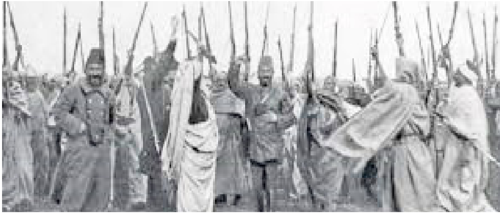
مسلحون عرب مسلحون خلال عرض

بقيادات المبدن الفلسطينية الأخرى، وكسب عددا من شباب المناطق المختلفة للانضمام إلى تنظيم الجهاد الذي كان يعد له، وكان يؤخذ كل اسبوع بمجموعة من الأعضا إلى القرى لإعداد الفروين للدفاع عن اراضيهيم . وقد تمكن من إنشاء عدة فروع لجمعية في كثر قرى اللواء الشمالي من فلسطين.