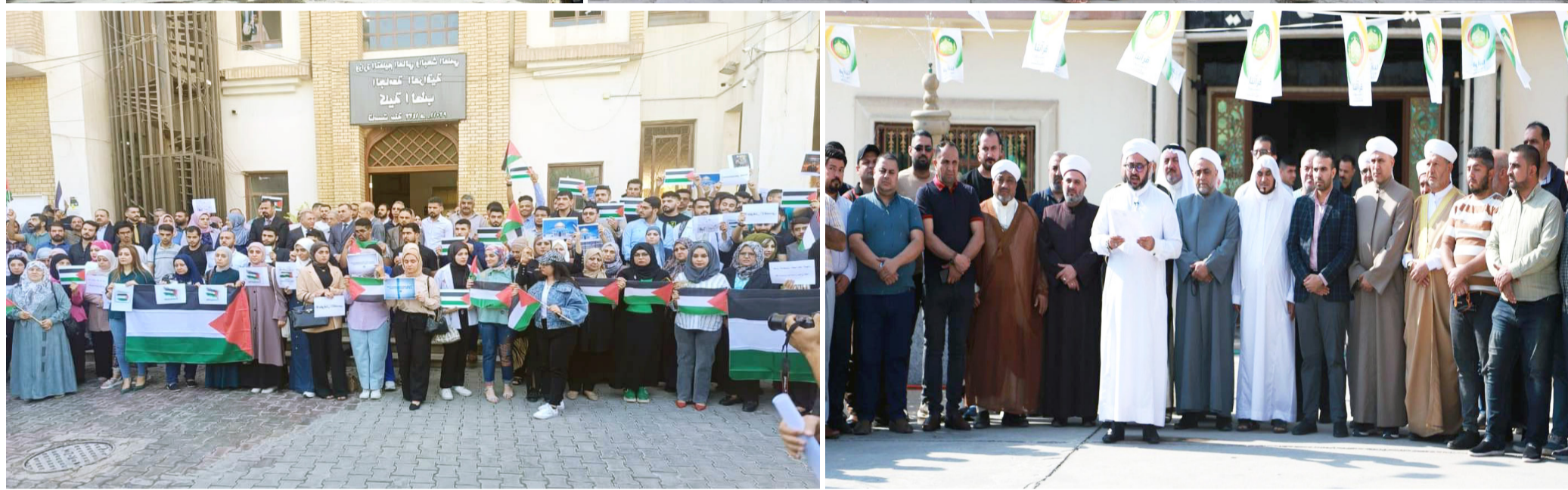
وقفات احتجاجية؛ شهدت الحافظات كافة أمس وقرات احتجاجية تنديداً بجرائم العدوان الإسرائيلي ضد الأمنيين في مستشفى المعمداني امس الاول والوقوف إجلاً وإكباراً لأرواح الضحايا في غزة.