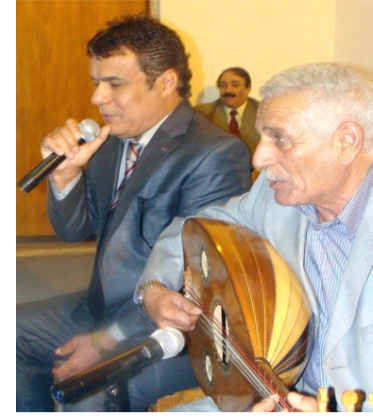
مسيرة: أعمال متميزة في مسيرة محمد الشامي الغنائية