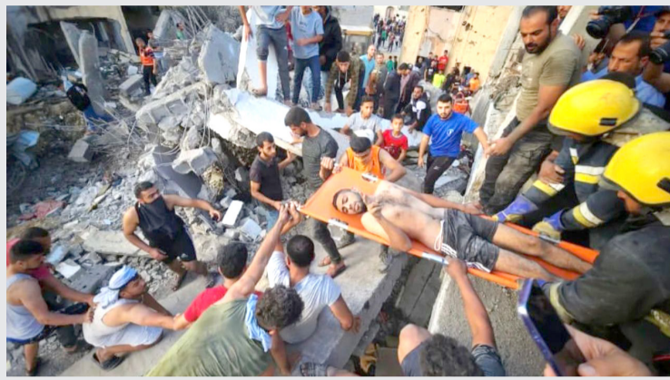
الابرياء والمصابين والمرضى بمستشفى الممداني في غزة. وقال في بيان امس انها (جريمة حرب تكراه لا يمكن السكوت عنها. وعلى إسرائيل ان توقف عدوانها الغاشم على غزة قورا ، الذي يتنافى مع القيم الدولية وضع حد لسفك الدماء

الذي يشكل استمراره وصمة عار على الإنسانية). مغربا عن ترجمته لاسر الشهداء، مترجما على ارواحهم). من جانبه ، قال وزير الخارجية الأردني أيمن الصفدي في بيان امس انه (تقرر عدم عقد القمة الرباعية في عمان لان واشنطن لن تكون قادرة على اتخاذ قرار بوقف الحرب). وكان الرئيس الفلسطيني محمود عباس قد اتهم في كلمة متلفزة (إسرائيل) بقصف مستشفى الممداني في غزة والتسبب في مقتل المئات). ووصف عباس الحادث بأنها (فاجعة كبيرة ومجزرة حرب بشعة لا يمكن السكوت عنها أو ان ندعها تمر دون حساب).