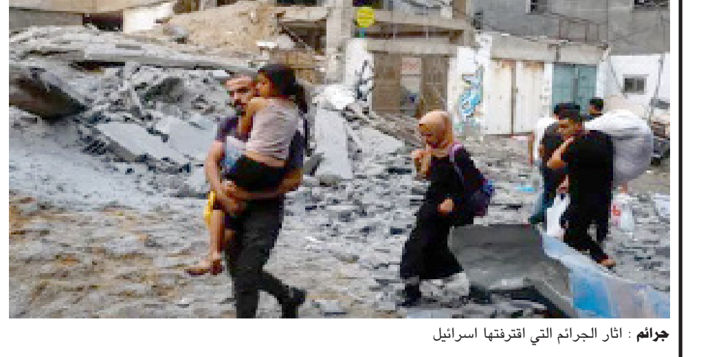
جرائم : اثار الجرائم التي ارتقتها اسرائيل