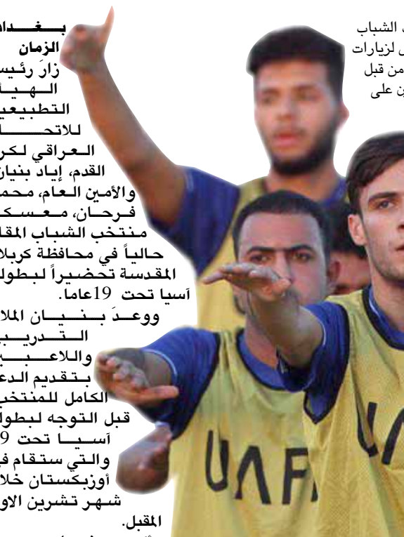
منتخب الشباب يتعرض لزيارات عديدة من قبل القائمين على الكرة