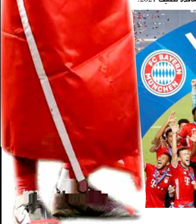
فريق بايرن ميونخ يتوج ببطولة دوري أبطال أوروبا

□ برلين - وكالات - توج بايرن ميونخ بطلاً لدوري أبطال أوروبا، للمرة السادسة في تاريخه، بفوزه على باريس سان جيرمان (1-0) في المباراة النهائية، على ملعب الشور بالعاصمة البرتغالية لشبونة. وجاء هدف المباراة الوحيد عن طريق النجاشي الفرنسي، كينجسلي كومان، في الدقيقة 59 ليذوق العملاق الباريسي بالفشل للمرة الثانية في تاريخه، بعد موسم (2013 - 2012). ضفة الماتي وضغط بايرن على منافسه الباريسي في السدقائق الـ5 الأولى بينما فشل الأخير في تجاوز منتصف الملعب. وغابت الخطورة عن كلا المرشحين، في أول ربع ساعة من المباراة، قبل أن يصل نيمار باول فرصة حقيقية لمرمي مانويل نوير، بعدما تلقى تمريرة بينية من مبابي، لكن الحارس الألماني تصدى ببراعة لكرتين متتاليتين. ووصل بايرن باول فرصة مع انحصاف الشوط الأول، عن طريق ليفاندوفسكي، الذي تسلم كرة داخل منطقة الجزاء، ليستدير ويسدها بيسراه، لكن القائم الأيسر حال دون وصولها إلى الشباك. هجمة مرتدة وشن سان جيرمان هجمة مرتدة سريعة عن طريق نيمار، الذي مرر الكرة إلى دي ماريا داخل منطقة الجزاء، ليهيئها الجناح الأرجنتيني لنفسه، قبل أن يسدد أعلى العارضة.