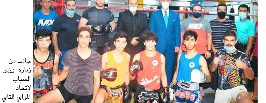
جانب من زيارة وزير الشباب والاتحاد الموائي تاي

بغداد - الزمان أشاد وزير الشباب والرياضة عدنان الموائي تاي على الصعدين العربي والدولي في الفترة الماضية، مؤكداً بالوقت ذاته على دعم الألعاب الفردية باعتبارها صاحبة إنجازات كبيرة للرياضة العراقية. جاء ذلك خلال زيارة مفاجئة لمقر الاتحاد العراقي المركزي للموائي تاي مساء اليوم الأحد المصادف الثالث