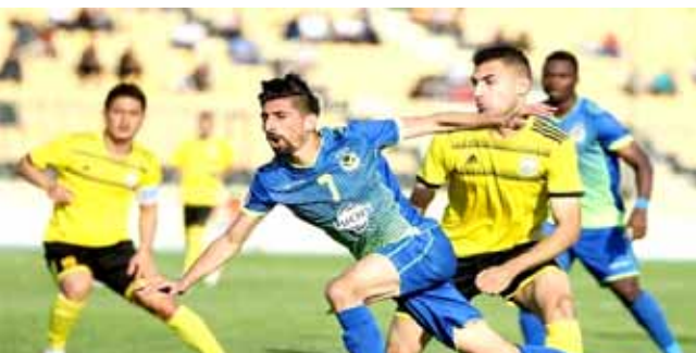
لقطة لأحدى مباريات فريق أربيل

بغداد- الزمان عقدت الهيئة الإدارية المؤقتة لنادي القوة الجوية الرياضي اجتماعاً بحضور جميع الأعضاء اتخذت فيه عدة قرارات تخص النادي خلال المرحلة المقبلة. وقال قائد القوة الجوية رئيس النادي اللواء شهاب جاهد في بيان تلقى السومرية نيوز نسخة منه، إن هذا الاجتماع هو الأخير للهيئة الإدارية المؤقتة كون الثاني عشر من شهر ابلول المقبل سيكون موعداً لإجراء انتخابات لاختيار هيئة إدارية جديدة.