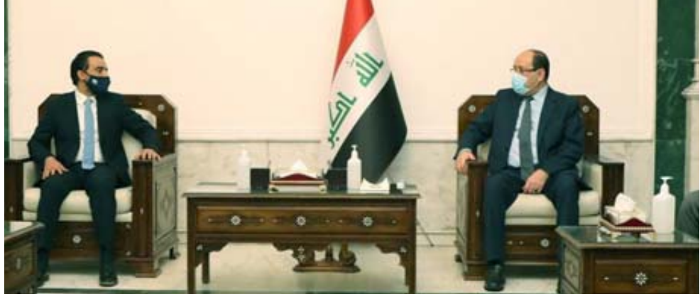
لقاء: جانب من لقاء رئيس البرلمان محمد الحلبوسي برئيس ائتلاف دولة القانون نوري المالكي

بحسب رئيسا البرلمان محمد الحلبوسي واتلاف دولة القانون نوري المالكي استئناف مجلس النواب عقد جلساته وحث القوى على تشريع قوانين تصم مصلحة المواطن.