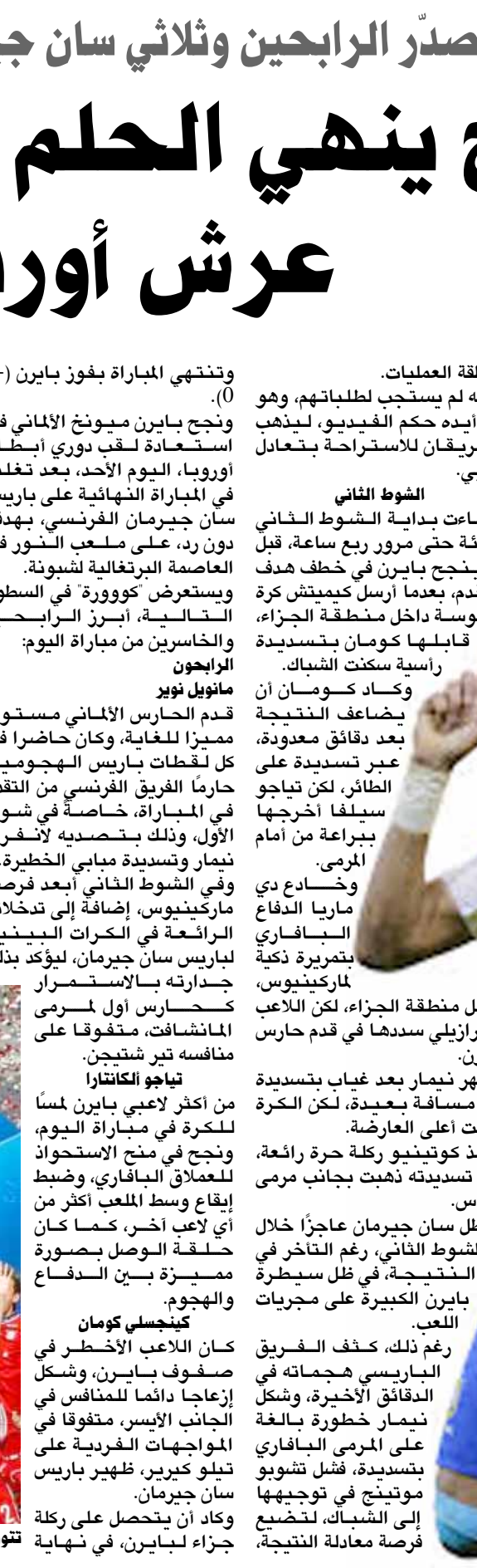
نيمار دا سيلفا

منطقة العمليات، لكنه لم يستجيب لطلباتهم، وهو ما أيدته حكم الفيديو، ليذهب الفريبران للاستراحة بتعادل سلبى. الشوط الثاني وجاءت بداية الشوط الثاني هادئة حتى مرور ربع ساعة، قبل أن ينجح بايرن في خطف هدف التقدم، بعدما أرسل كيميشت كرة مقوسة داخل منطقة الجزاء، قابلها كومان بتسديدة راسية سكنت الشباك. وكاد كومان أن يضاعف النتيجة بعد دقائق معدودة، عبر تسديدة على الطائر، لكن تياجو سيلفا أخرجها ببراعة من أمام المرمى. وخساعد دي ماريا الدفاع الباريسي بتمريرة ذكية لماركينوس، داخل منطقة الجزاء، لكن اللاعب البرازيلي سددها في قدم حارس بايرن. وظهر نيمار بعد غياب بتسديدة من مسافة بعيدة، لكن الكرة ذهبت أعلى العارضة. ونفذ كوتينييو ركلة حرة رائعة، لكن تسديده ذهبت بجانب مرمى نافاس. وظل سان جيرمان عاجزاً خلال الشوط الثاني، رغم التأخر في النتيجة، في ظل سيطرة بايرن الكبيرة على مجريات اللعب. ورغم ذلك، كثف الفريق الباريسي هجماته، وشكل نيمار خطورة بالغة على المرمى الباريسي بتسديدة، فشل تشوبو موتينج في توجيهها إلى الشباك، لتضعب فرصة معادلة النتيجة،