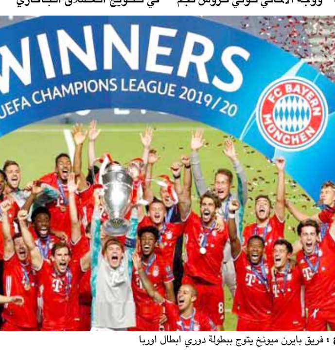
فريق بايرن ميونخ يتوج ببطولة دوري أبطال أوروبا