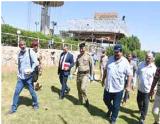
وزير النقل يتابع تجايزات على دجلة

بغداد - قصي منذر اعلن وزير النقل ناصر حسين الشبيبي، مباشرة حفلات الشركة العامة لنقل المسافرين والوفود بتسيير خطوطها المنتظمة الخاصة بنقل المسافرين من المناطق الجنوبية ووسط العاصمة باتجاه مطار الدولي وبالعكس خدمة للمسافرين وكذلك العاملين في الطيران المدني . ونقل بيان تلقته (الزمان) امس عن الوزير قوله انه (بدعم دولة رئيس الوزراء فقلم) . وكانت الشركة قد اتخذت العديد من الخطوات الاجراءات الخاصة بتطوير خدمات النقل للمواطنين والمسافرين، وبإشراف مباشر من الشبيبي ، تابع الفريق المختص من ممثلي وزارة النقل العراقية ومديرية الدفاع المدني بفرعية الكرخ والرصافة وقيادة عمليات بغداد ووزارة الموارد المائية ومديرية النجدة النهرية والكشف والمتابعة الميدانية