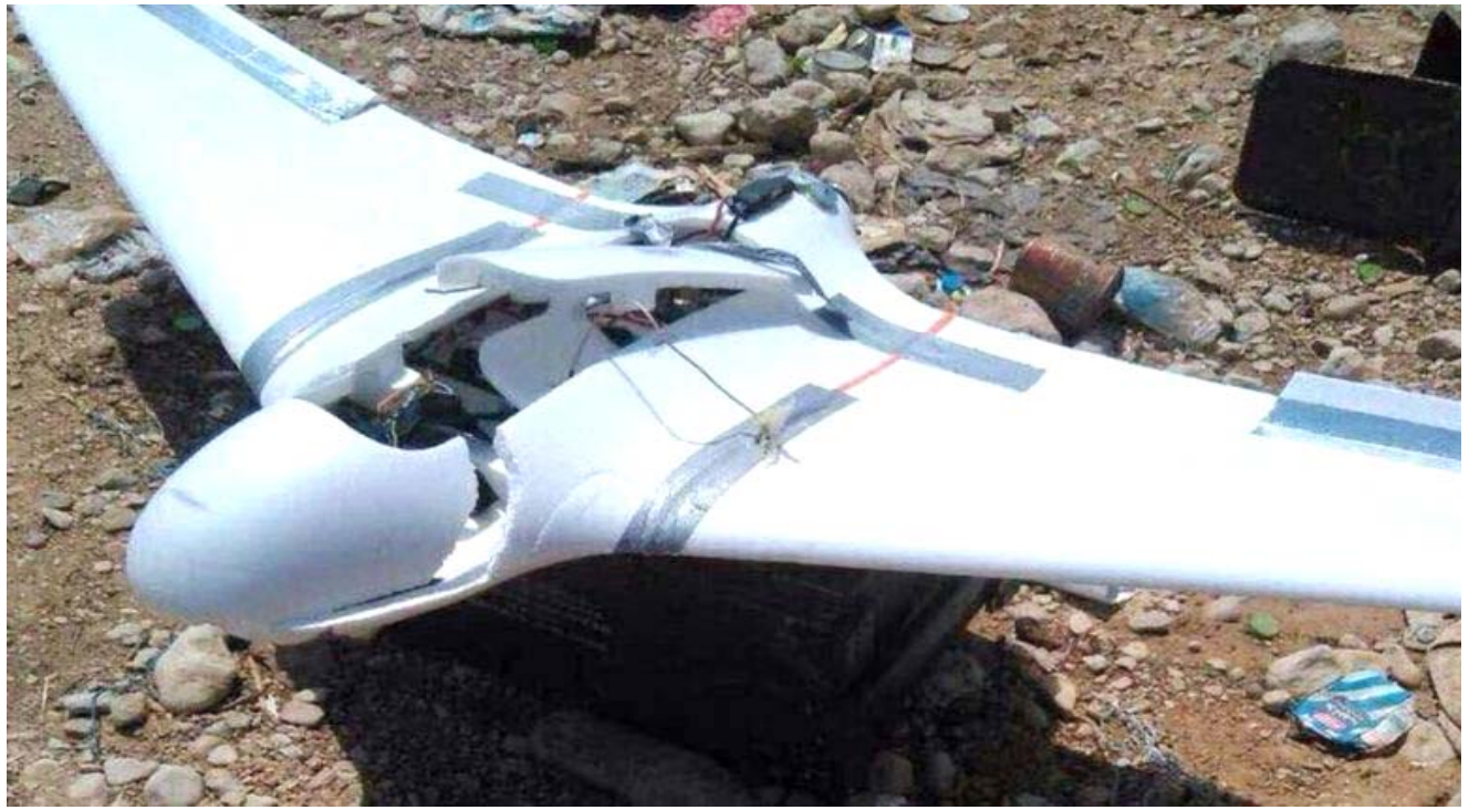
سقوط : الطائرة الاسرائيلية لمسيرة بعد اسقاطها

الوزراء بجانب صورة الفيلسوف مكسافيلي مؤلف كتاب الامير، وافادت الشرطة الاسرائيلية انه تم اعتقال سبعة اشخاص خلال الاحتجاجات في القدس ووفقاً لأحدث استطلاعات الرأي، لا يزال حزب الليكود بزعامة نتانياهيو ينحصر ثوابا التصويت، بينما تشهد ائتلاف أزرق أبيض بقيادة غانتس تراجعاً، ويشهد حزبا "يش عند" (يسار وسط) و"يمين" (يميني متطرف) تقدماً في ثوابا التصويت أيضاً.