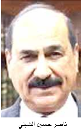
ناصر حسين الشبيبي

بغداد - قصي منذر اعلن وزير النقل ناصر حسين الشبيبي، مباشرة حفلات الشركة العامة لنقل المسافرين والوفود بتسيير خطوطها المنتظمة الخاصة بنقل المسافرين من المناطق الجنوبية ووسط العاصمة باتجاه مطار الدولي وبالعكس خدمة للمسافرين وكذلك العاملين في الطيران المدني . ونقل بيان تلقته (الزمان) امس عن الوزير قوله انه (بدعم دولة رئيس الوزراء فقلم) . وكانت الشركة قد اتخذت العديد من الخطوات الاجراءات الخاصة بتطوير خدمات النقل للمواطنين والمسافرين، وبإشراف مباشر من الشبيبي ، تابع الفريق المختص من ممثلي وزارة النقل العراقية ومديرية الدفاع المدني بفرعية الكرخ والرصافة وقيادة عمليات بغداد ووزارة الموارد المائية ومديرية النجدة النهرية والكشف والمتابعة الميدانية