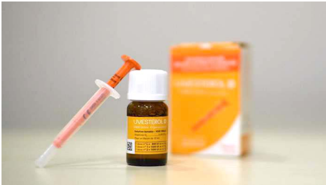
حقة الفيتامين دي

هذا جزئيًا سبب حظري ومنع مقالتي في كل مكان: لأنني كنت أروج للتغذية الوقائية من الأمراض منذ عقدين من الزمن ، مما كلف عمالقة الأدوية مئات الملايين من الدولارات من العائدات المغفوة. يجب عليك بالتأكيد مشاهدة هذا الفيلم الوثائقي المصغر المهم لمعرفة المزيد حول كيفية استخدام شركات الأدوية Big Pharma لسوء الفيرس التاجي لاستبعاد الجنس البشري واحتجاز الناس في دائرة المرض والتلعيمات الضارة. شاهد الفيلم على هذا الرابط: https://www.naturalnews.com/2020-05-08-vitamin-d-survival-nutrient-against-covid-19.html هذه ترجمة لمقالة: Vitamin D identified as the "survival nutrient" against covid-19... could cut mortality rate in HALF, say researchers by: Mike Adams ?Natural News ?Friday, May 08, 2020