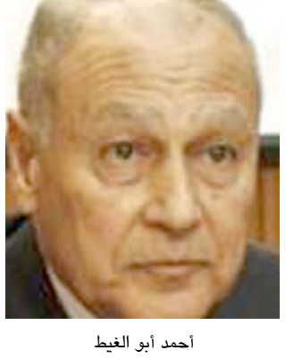
أحمد أبو الغيث

مبادرة السلام العربية التي أعلنتها المملكة العربية السعودية، والتي تهدف لإنهاء الاحتلال، وتحقيق الاستقلال. وحل قضية اللاجئين، وفق قرارات الشرعية الدولية وذكر وكالة الأنباء السعودية نقلاً عن العقيد اليركن تركي الملقب المتحدث باسم التحالف الذي تقوده السعودية في اليمن إن التحالف اعترض ودمر طائرة مسيرة محملة بمتفجرات صباح يوم الأحد (بالتوقيت المحلي) في المجال الجوي اليمني بعدما أطلقتها جماعة الحوثي المتحالفة مع إيران باتجاه المملكة.