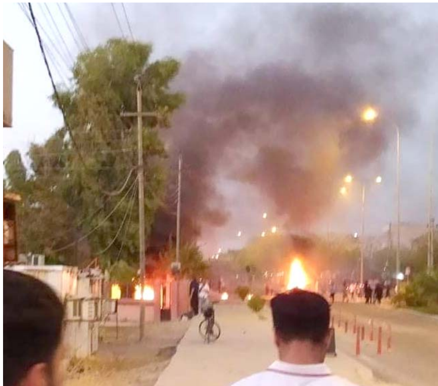
نيران : محتجون يضرمون النيران في مزارع بكار ونظرأهم في بغداد يقطعون سريع محمد القاسم