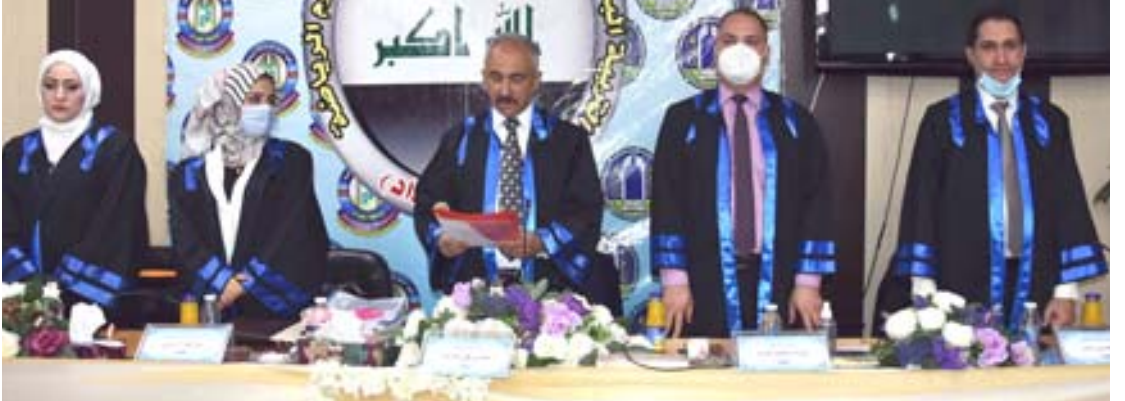
جانب من مناقشة اطروحة عن الكرة الطائرة

وتوصلت الاطروحة الى مجموعة من الاستنتاجات من اهمها شهدت الاختبارات البعيدة تطورا واضحا لمجايي البحث الثلاث التجريبتان والضابطة في قوة السيطرة المعرفية وتعلم بعض المهارات الاساسية في البحث مقارنة مع الاختبارات القبلية. وان اسلوب التلمذة المعرفية خطة كليل تفريد التعليم لهما تأثير فعال في متغيرات البحث مقارنة بالاسلوب المتبع في الدرس وهذا واضح في الؤساط الحسابية التي ظهرت في الاختبارات البعيدة لكل مجموعة.