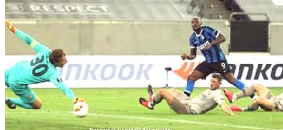
تاهل: فريق الإنتر يتاهل الى ملاقة اشبيلية في الدوري الاوروبي