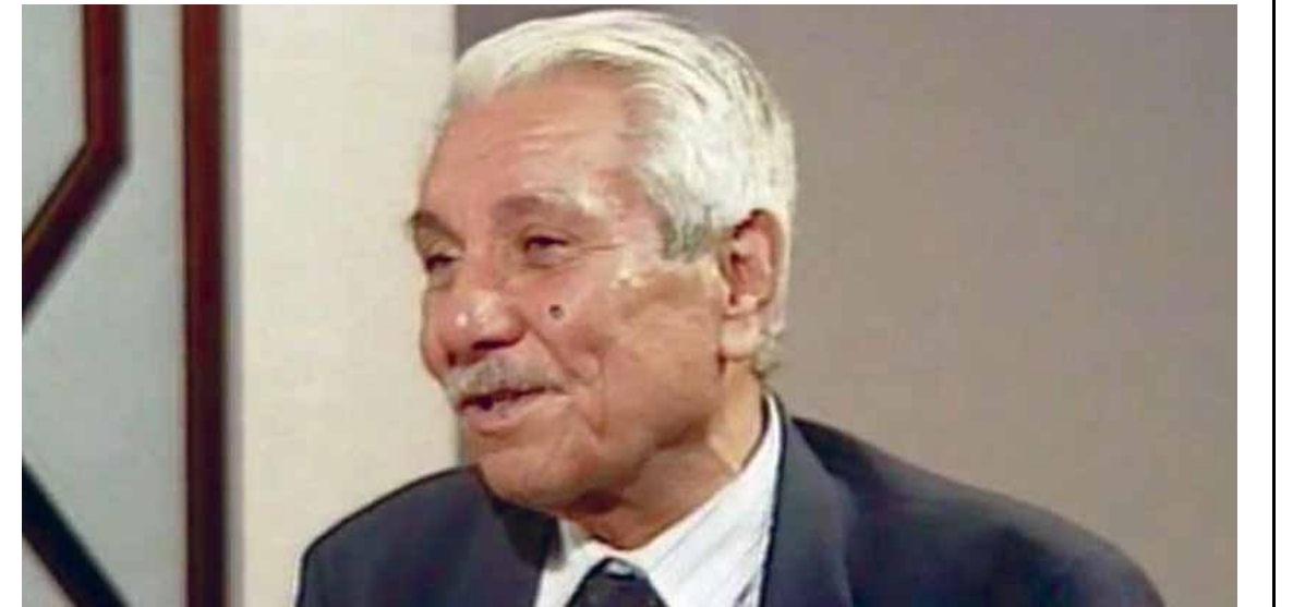
عبد الوهاب البياتي

وقال: المرحوم ابو علي عبدالوهاب البياتي شاعر كبير مبدع واصل ومنتمى جدا في المحافل الادبية والثقافية في العالم وكانت له علاقات واسعة بكبار ادباء العالم ناظم حكمت وبنوشينكو وماركيز وغيرهم وما يقوله الشاعر الذي ينتقده غير صحيح وناجم عن عدم ارتياح شخصي او خلاف بين الطرفين ليس الا باختصار البياتي شاعر رائد وكبير.